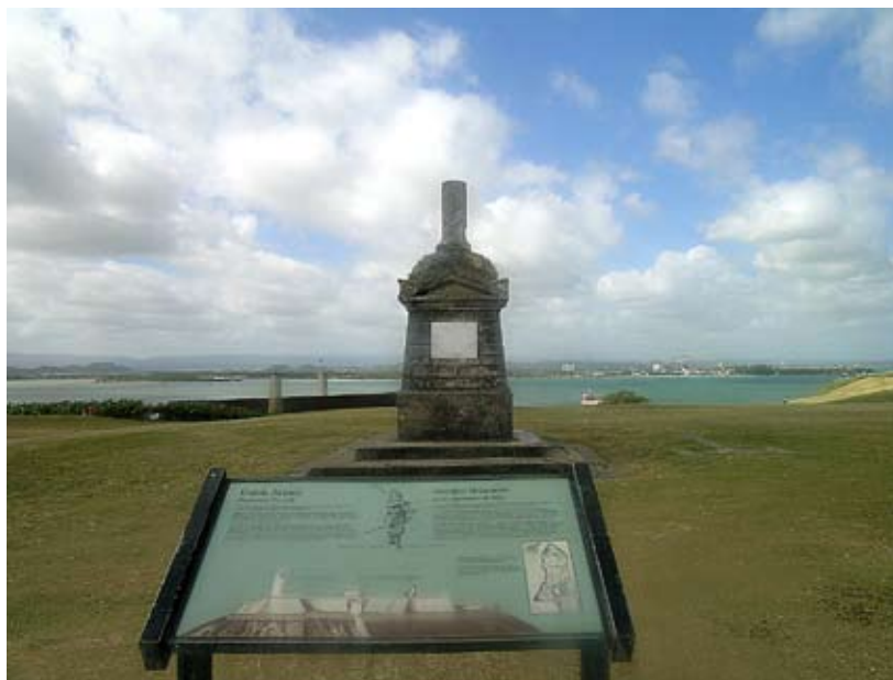
Monumento conmemorativo del ataque holandés a Puerto Rico.

importancia para el avituallamiento de las colonias de plantación, sobre todo tras el final de los asentamientos portugueses tras la guerra de independencia de Portugal. Se puede decir que en estas fechas se produjo un cambio de estrategia, un viraje a la ocupación efectiva de puertos, pequeñas islas y algunas regiones (concretamente