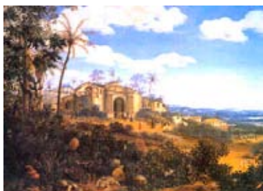
Corte de Johana Maurits Van Nassau.