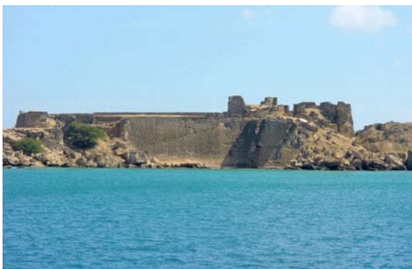
Fortaleza Santiago de León de los caballeros.

(13) Manuel HERRERO SÁNCHEZ, "La explotación de las salinas de Punta de Araya. Un factor conflictivo en el proceso de acercamiento hispano-neerlandés (1648-1677)", Cuadernos de Historia Moderna , nº 14 (1993), pp. 183-184.