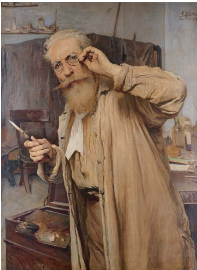
AUTORRETRATO ÓLEO S. LIENZO. 102 X 72 CM. FIRMADO: «JZ. ARANDA / SEVILLA 1901».

a lo Degas y Renoir, En el teatro , con efectos de espacio y luz al gusto de las vanguardias. Tampoco abandona el retrato, el de Sorolla y su autorretrato de la colección del Monte son de lo mejor del retrato moderno español. Su estrecha relación con los paisajistas de Alcalá de Guadaíra le permite también indagar en el terreno de la pintura al aire libre, e incluso la azotea de su casa es motivo de sus experimentos finales.