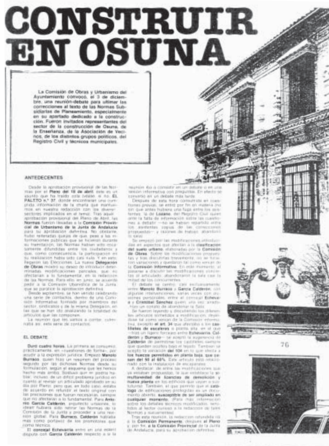
CRÓNICA DE LA COMISIÓN DE OBRAS Y URBANISMO EL PALETO 2ª ÉPOCA N.º 41 (1983).

especifican los destinos). * En Osuna no hubo huelga , en un recuadro, sin firmar.