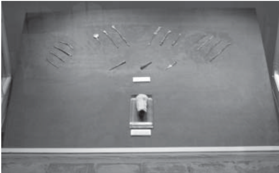
Conjunto de ajuar médico quirúrgico de época romana compuesto por 15 piezas trabajadas en bronce

- Visita guiada al museo el día 24 de febrero en la actividad “Montilla: Un patrimonio por descubrir” , organizada por la Concejalía de Patrimonio Histórico del Exmo. Ayuntamiento de Montilla.