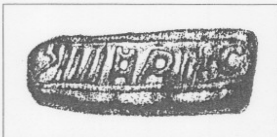
Sello de alfar, probablemente de sigillata hallado en el yacimiento Las Ventas de Cártama (Colección particular).