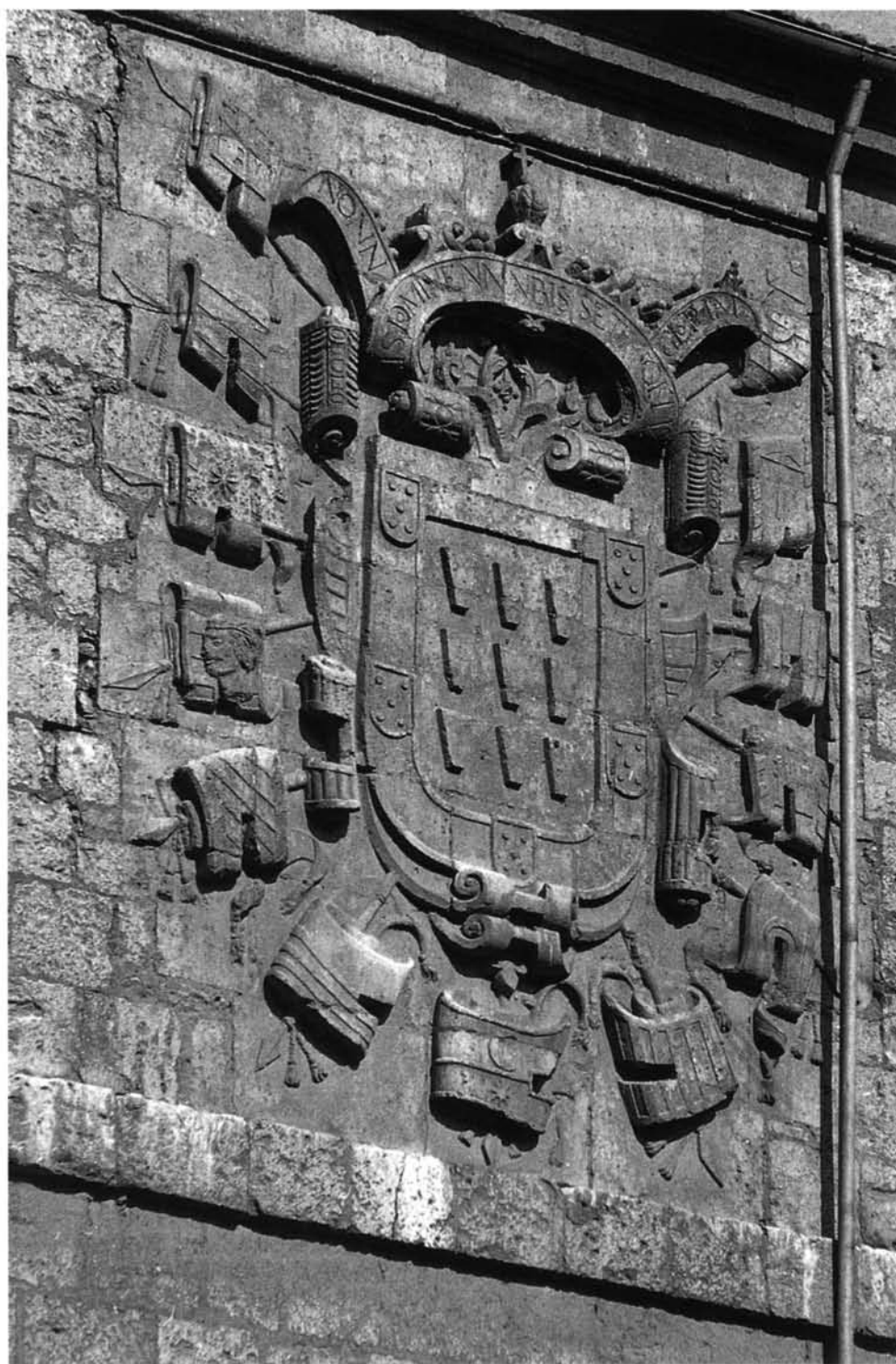
Valladolid. Iglesia de San Benito el Viejo. Escudo del Conde de Gondomar en la fachada de levante.