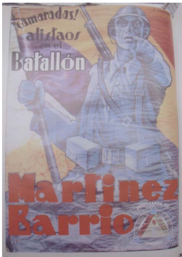
Ilustración 2: Cartel del Batallón «Martínez Barrio» de Valencia durante la Guerra Civil