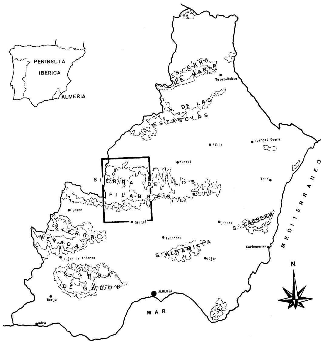
Fig. 1 Localización de la zona de estudio en la Sierra de los Filabres (Almería, Andalucía oriental).