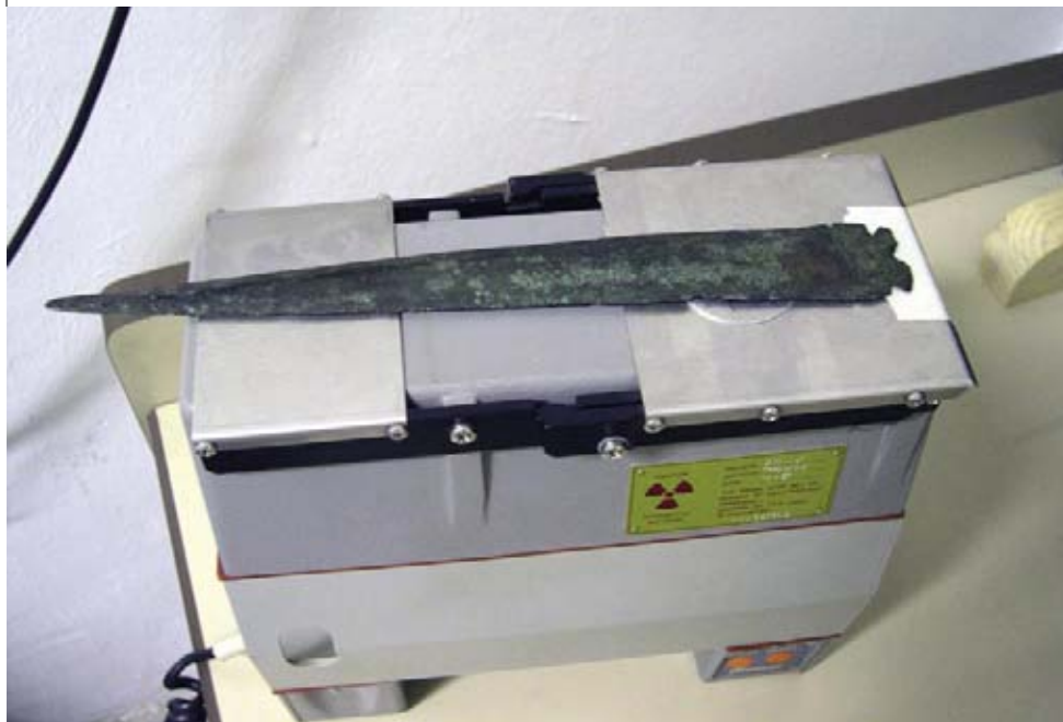
Figura 2. SSPS1 del espectrómetro Metorex XMET920 dispuesto para efectuar el análisis de un puñal de la Edad del Bronce.

Centrándonos en los laboratorios, que es donde se concentra la aplicación de nuevas tecnologías, el CRRMF dispone de los siguientes bloques de métodos y técnicas: