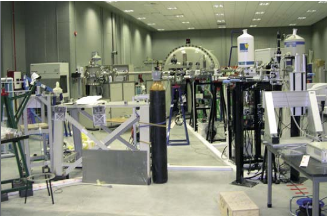
Figura 3. Aspecto general de la instalación del gran acelerador de iones del CMAM (Universidad Autónoma de Madrid).