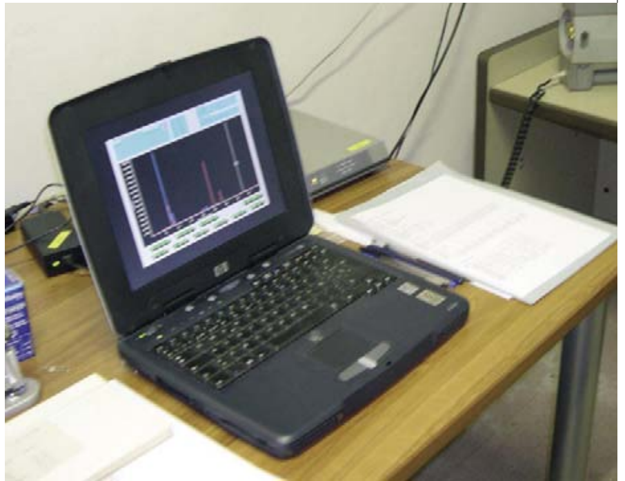
Figura 1. Aspecto general del laboratorio de análisis no destructivo del Museo Arqueológico Nacional. Espectrómetro Metorex XMET920.

Conservar, por qué y para qué. Se podría decir a bote pronto que porque lo mandan las leyes específicas. Pero, descendiendo al universo cotidiano de los museos, conservamos porque los objetos que constituyen las colecciones son los instrumentos básicos y fundamentales de la exposición permanente, aquellas reliquias históricas que el visitante quiere ver para encontrarse con un pasado que no necesariamente ha de ser el suyo pero que sabe (o debe saber) que constituye una celda en la compleja red de la Historia Universal. Conservamos también porque la cultura material es la piedra angular sobre la que descansan las posibilidades de investigación del pasado histórico y prehistórico, sobre todo de este último. Si no conservamos adecuadamente se irán perdiendo ciertos vestigios del pasado que no siempre será posible reponer mediante nuevos trabajos de arqueología de campo. Las posibilidades del registro arqueológico no son ilimitadas en ningún sentido. Tampoco es posible sustituir las grandes obras maestras de los genios de las artes.