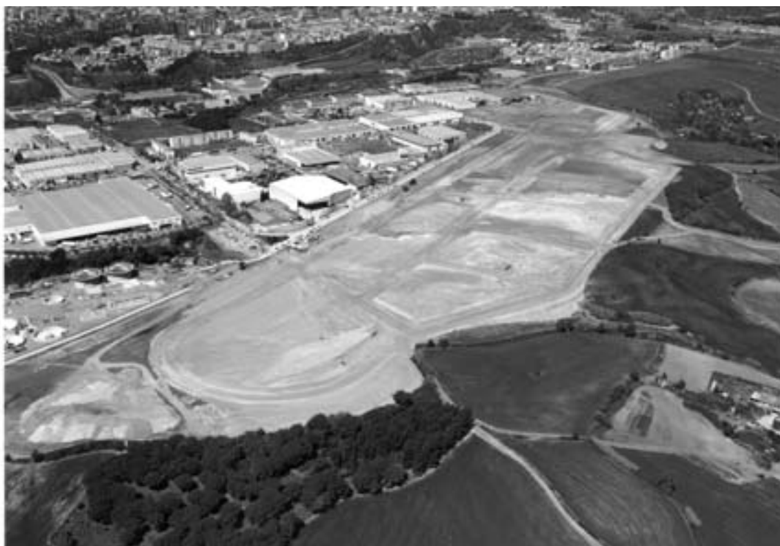
Fig. 1. Paraje de Can Roqueta. Espais Aèris. Fotografia cedida por SERVIAL (marzo-abril de 2000).

el Avanç del Pla Especial de Protecció del Patrimoni de Sabadell (2000).