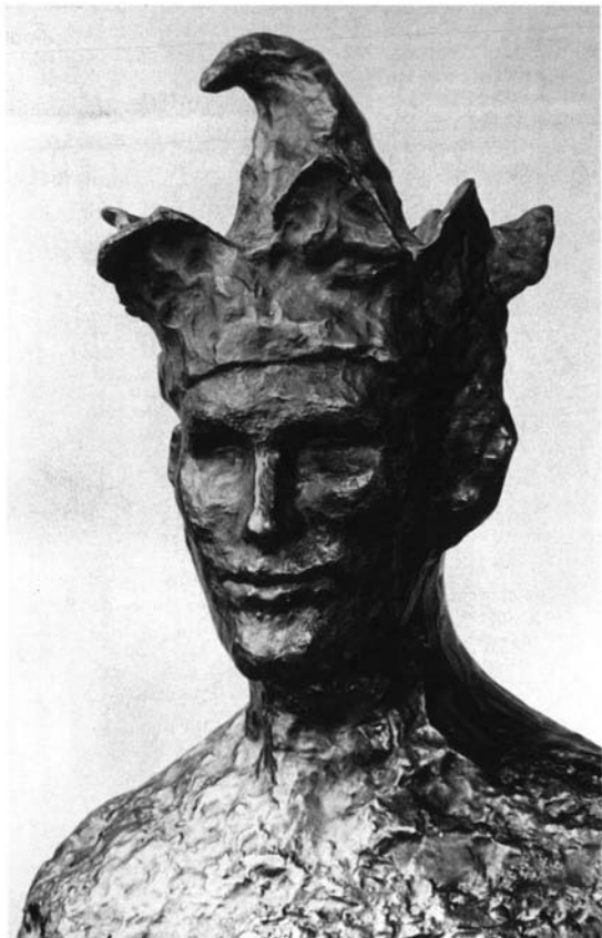
Picasso, El bufón o El loco . París, 1905. Bronce. Museo Picasso de París. MPP 231, ZI, 322, KB2, WS4