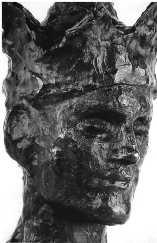
Picasso. El bufón o El loco . París, 1905. Bronce. Detalle. Museo Picasso de París. MPP 231, ZI, 322, KB2, WS4