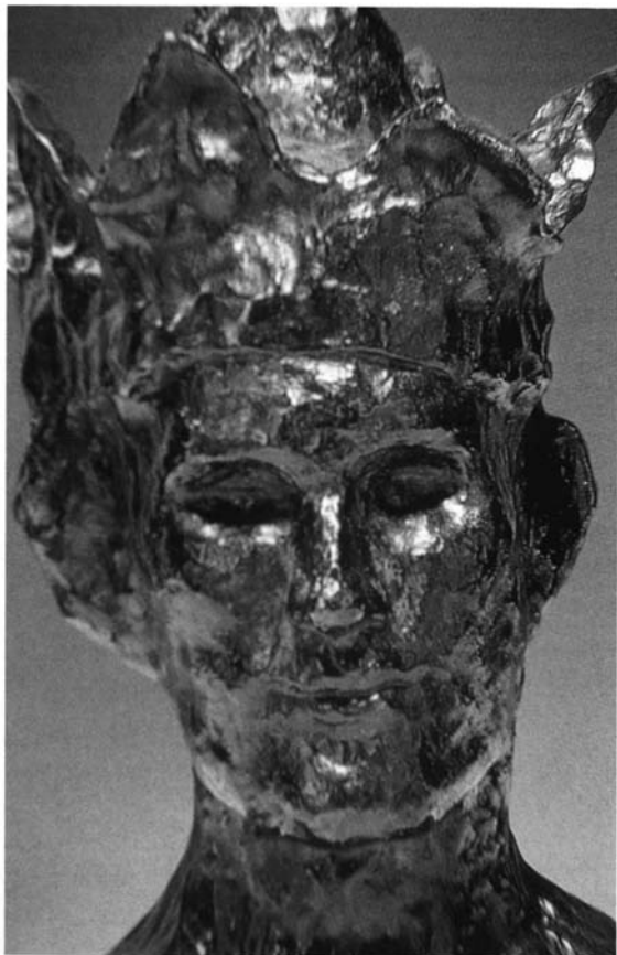
Picasso. El bufón o El loco. París, 1905. Bronce. Fondation Pierre Gianadda