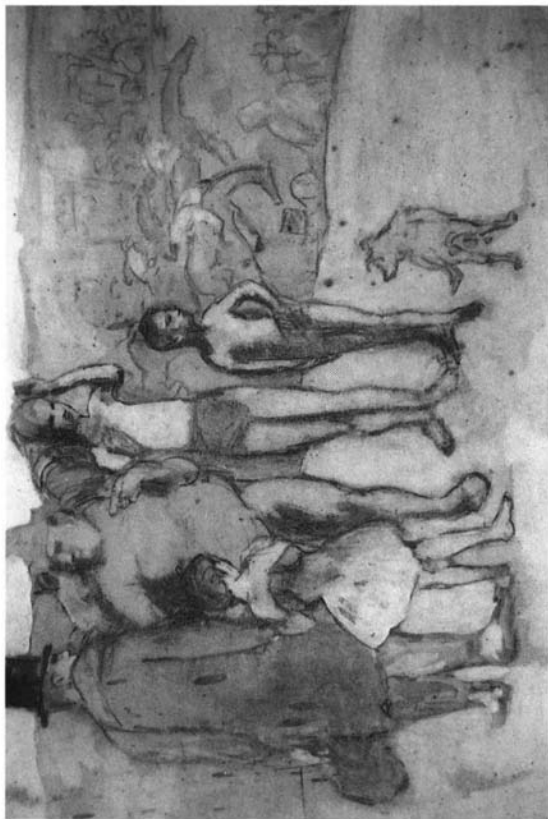
Picasso. Familia de saltimbanquis. París, 1905. Gouche sobre cartón. Museo Pushkin de Moscú.