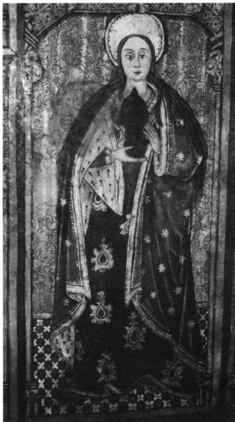
Fig. 4. María Magdalena con el vaso de perfume