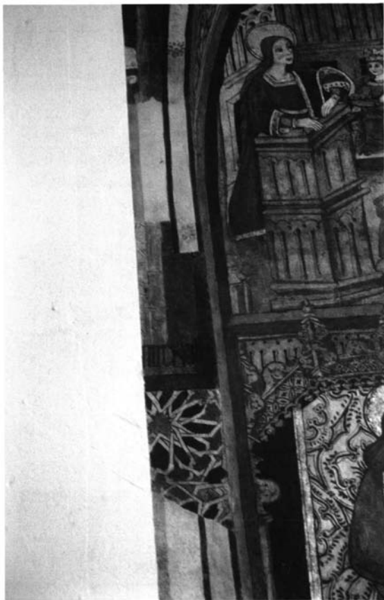
Fig. 2. Fragmento de retablo mural cubierto por capas de cal.