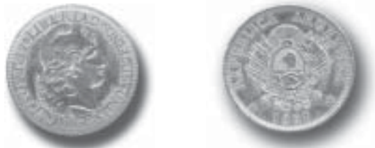
1 argentino de oro de 24 mm. de diámetro (1881).