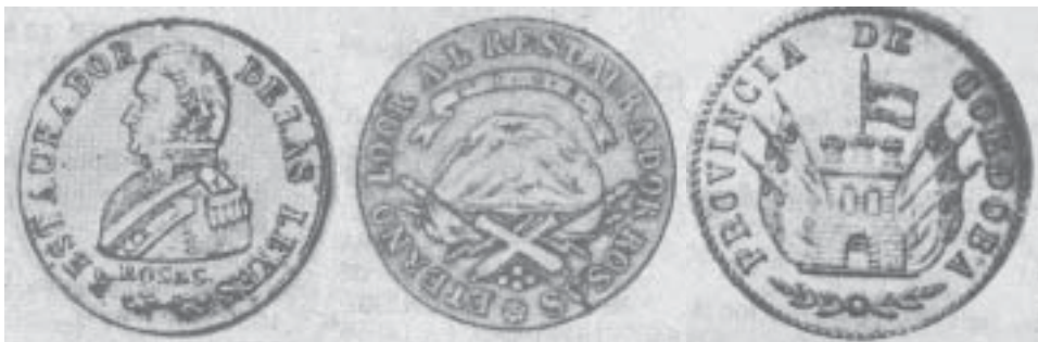
Anversos de monedas de plata de La Rioja 1842 y 1843, y de Córdoba 1844