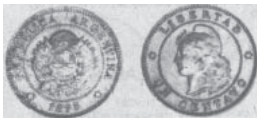
1 centavo de cobre de 30 mm. de diámetro (1895)