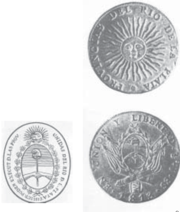
FIGURA 2: Escudo nacional y moneda de la Asamblea del año XIII