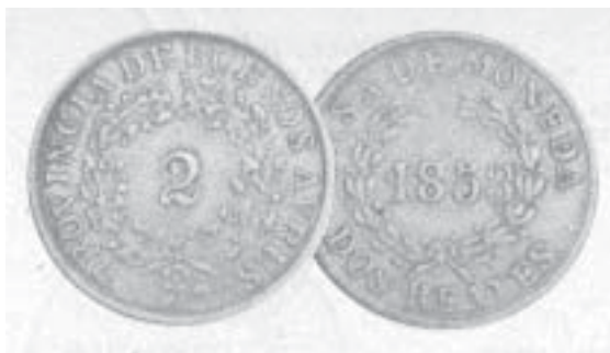
2 reales (Buenos Aires 1853)

el puerto de la Confederación. Los enfrentamientos armados fueron inevitables y las tropas de Urquiza vencieron a las bonaerenses dirigidas por el general Bartolomé Mitre el 23 de octubre de 1859 en Caseros. Acto seguido, Buenos Aires firmó un pacto de unión a la Confederación en San José de Flores y se reunió una Convención Nacional con diputados de las 14 provincias en Santa Fe que reformó la Constitución en septiembre de 1860. Esta reforma no modificó los artículos referidos a la prohibición de cecas provinciales ni los de exclusividad de emisión del gobierno confederal, pero reconoció la existencia de monedas provinciales en circulación al incluir en el Artículo 64 que los derechos de importación así como las demás contribuciones nacionales podrían ser satisfechas en la moneda que fuese corriente en las provincias respectivas, por su justo equivalente. Con este inciso de 1860 en la Constitución de 1853, Buenos Aires legalizó las monedas acuñadas por su Casa de Moneda, convertida ahora en Banco y Casa de Moneda de Buenos Aires que acuñó una nueva serie de monedas de cobre de 2 reales entre 1860 y 1861 semejantes a las anteriores de 1853-1856.