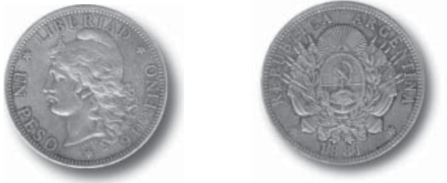
1 peso de plata de 37 mm. de diámetro (1881).

administrar y defender mejor sus posesiones coloniales en el Cono Sur. Aquel virreinato del Imperio Hispánico comprendía, además de los territorios argentinos, los de las actuales Repúblicas de Bolivia, Paraguay y Uruguay, los estados brasileños de Río Grande y Paraná y toda la Tierra de Fuego y las Islas Malvinas. La capital del virreinato se situó en Buenos Aires y su puerto adquirió un desarrollo notable del comercio durante el siglo XVIII. Por él salían las exportaciones de plata y oro de las minas del Alto Perú hacia la metrópoli.