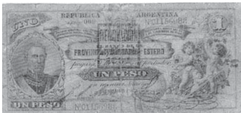
1 peso de papel (Provincia de S. del Estero 1888 y resello de 1894)

garantizados en 1887. La ley permitió la multiplicación de bancos en el interior y un aumento de la circulación de billetes, pero sin el respaldo total del gobierno. Se llegaron a emitir 150 millones de billetes de 1 peso, pero las reservas de oro sólo eran de 76 millones. Además, el gobierno acuñó las mayores cantidades de argentinos de oro jamás hechas en la historia de Argentina en 1887 y 1888 para pagar la deuda en efectivo, que aún mermó más las reservas de oro. La ley 3871 de 1889 levantó el curso forzoso de billetes no convertibles y les asignó un valor de 44 centavos de peso de oro por peso papel en lugar de los 100 centavos que tenían antes de 1885. Es decir, 1 peso de oro valía 2,27 pesos de papel moneda nacional. El resultado final fue la escasez de oro, una depreciación internacional del peso del 41% y la crisis bancaria argentina de 1891. El Banco Nacional fue liquidado temporalmente en abril de 1891, pero abrió de nuevo sus puertas el 1 de diciembre después de recibir un préstamo de 15 millones de libras esterlinas y, acto seguido, emitió otros 50 millones de pesos en papel. Por exigencia de los acreedores, no hubo otra emisión hasta finales de siglo y la moneda en circulación se redujo a partir de 1893. Aquel año había 306 millones y en 1899, 291,3 millones. Tras esta coyuntura de control monetario y unos cuantos años de balanza comercial positiva, se dispuso la vuelta