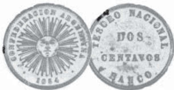
2 centavos de peso (1854)

CENTAVOS) estaba en el centro del reverso rodeado por la leyenda TESORO NACIONAL · BANCO.