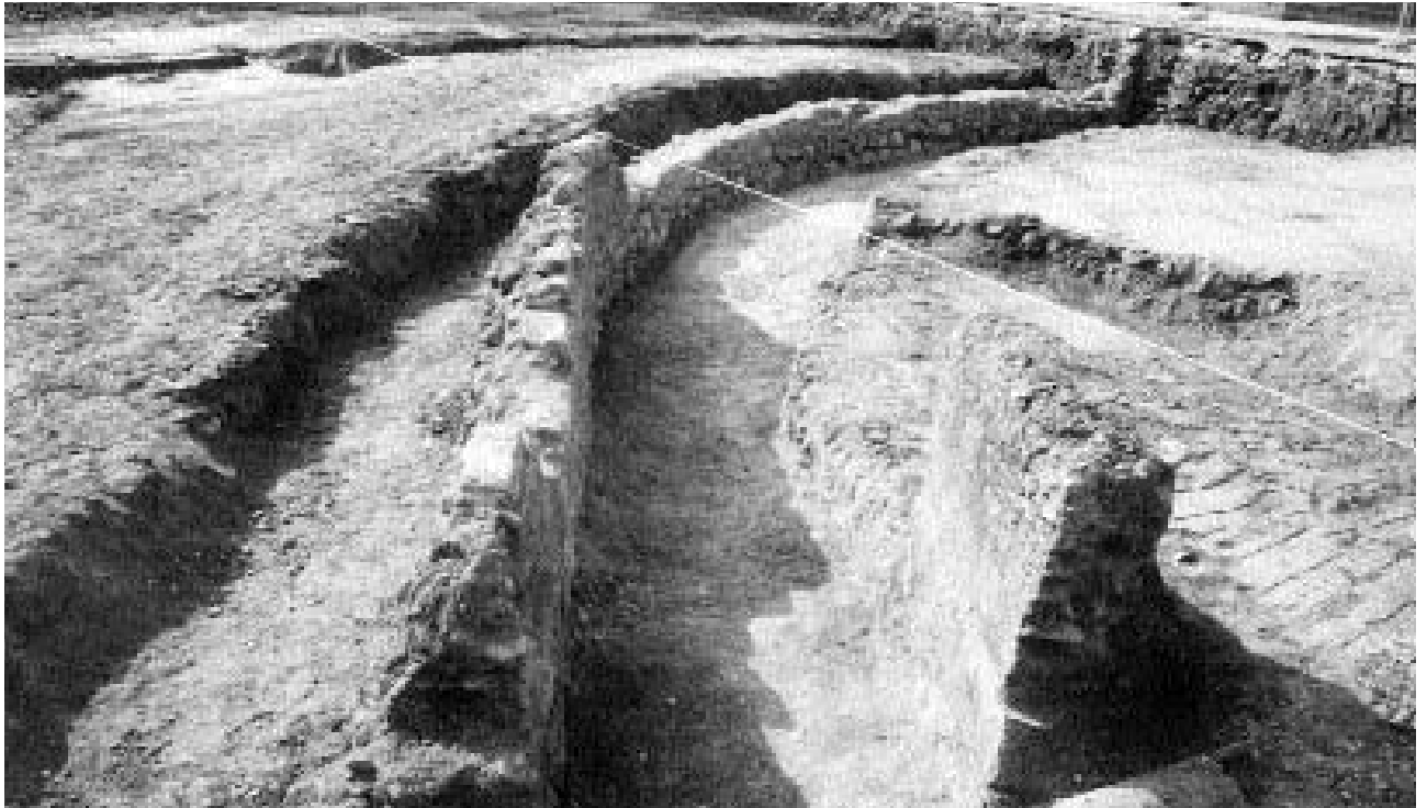
1. Primer plano de la acequia de Coscollosa con el foso de la muralla al fondo.