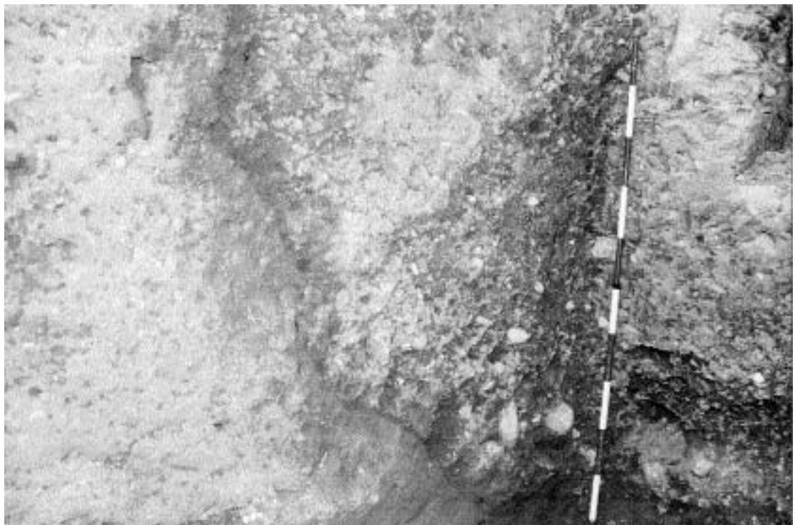
2. Foso de la muralla en la calle Prim.