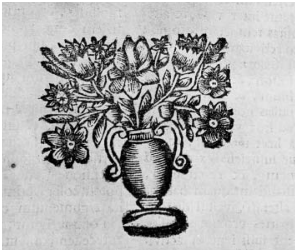
Lám 4. Motivos ornamentales del libro Tentativae Complutensis .