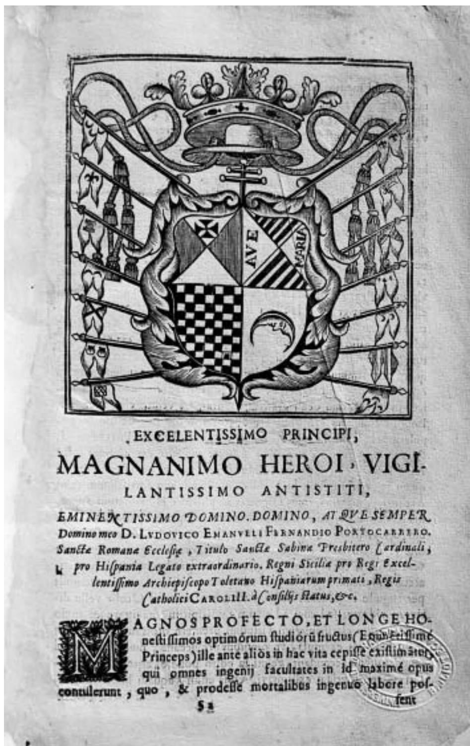
Lám 2. Dedicatoria del libro Tentativae Complutensis . (Obtenida del ejemplar de la BUN, Signatura FA 136.024)