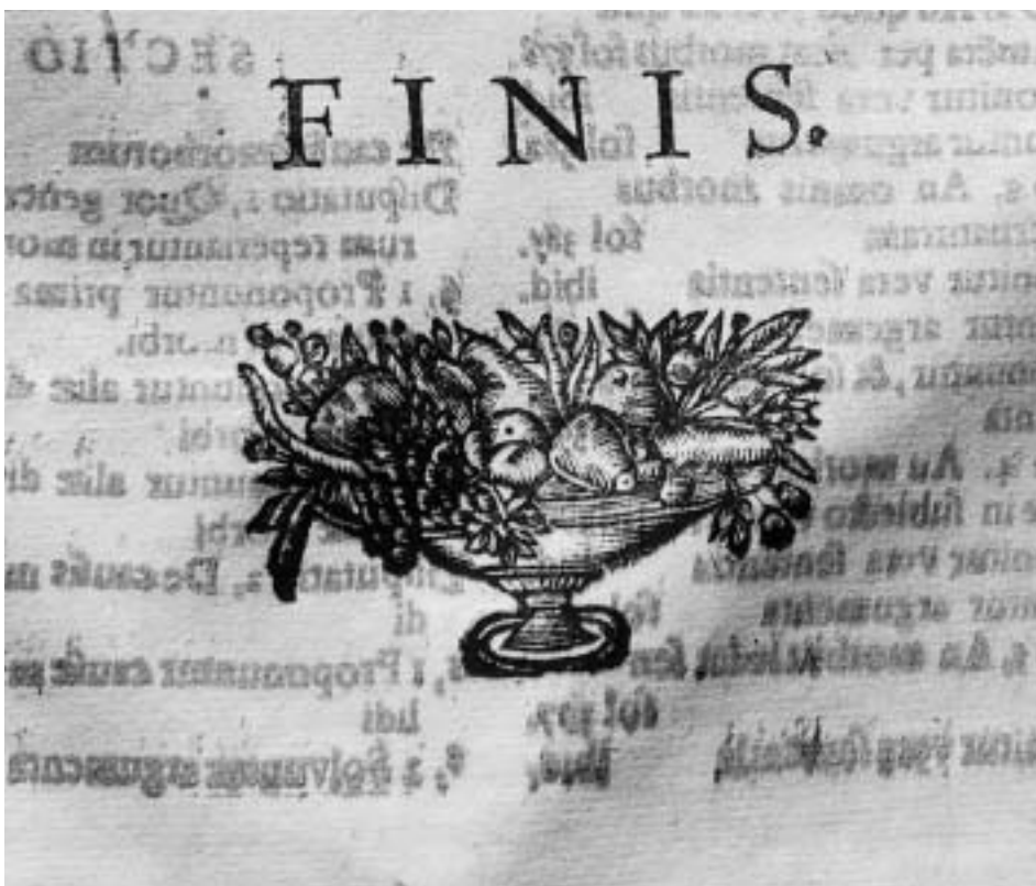
Lám 5. Motivos ornamentales del libro Tentativae Complutensis .