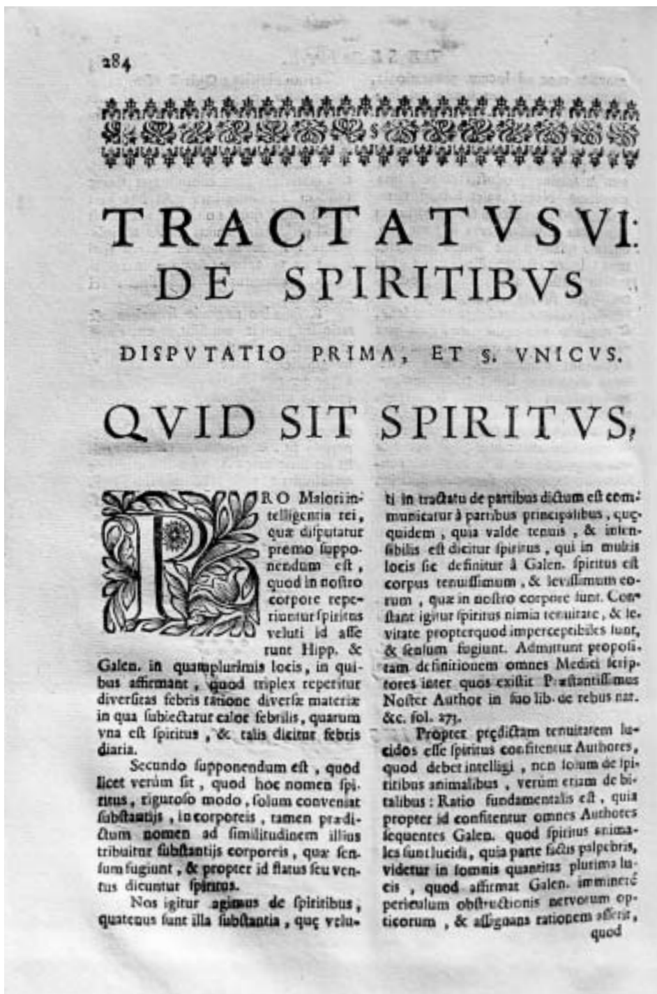
Lám 3. Tentativae Complutensis . Tractatus VI. De Spiritibus. (Obtenida del ejemplar de la BUN, Signatura FA 136.024)