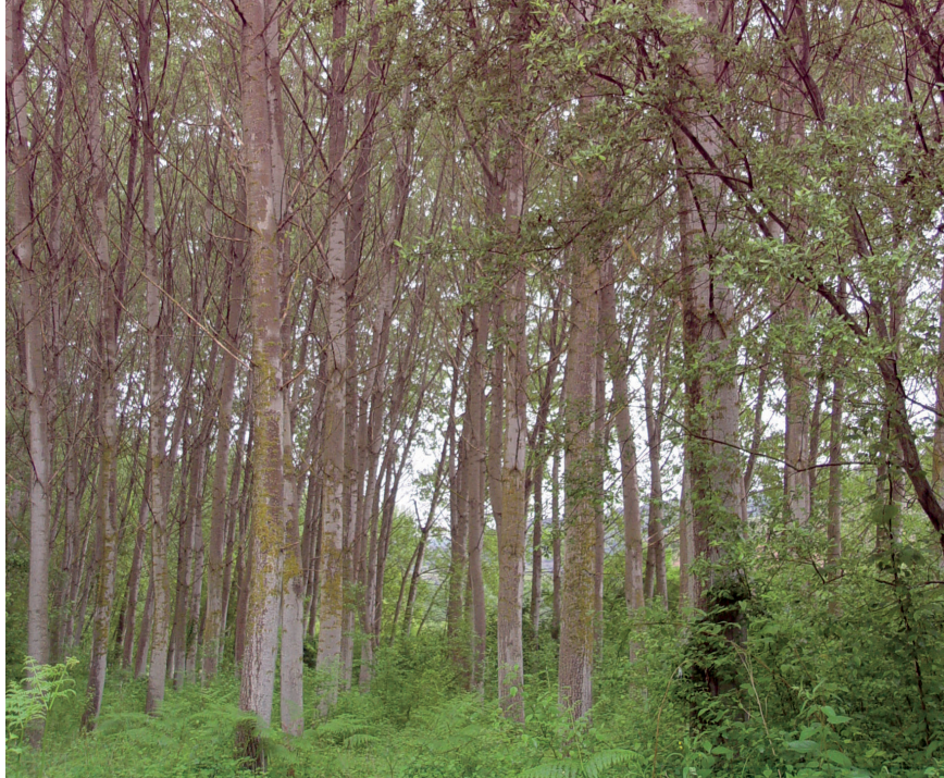
Fig. 8. Repoblaciones y tratamientos silvícolas no respetuosos con la población de vid salvaje.