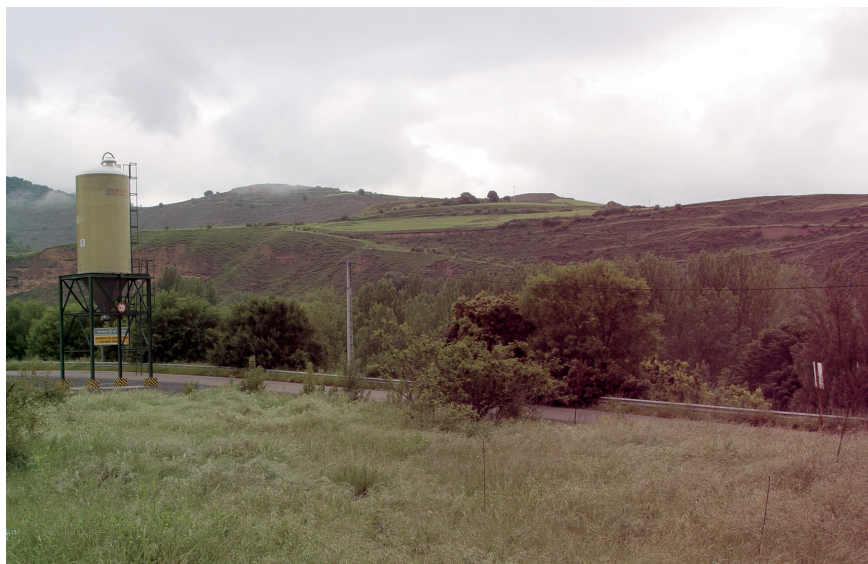
Fig. 4. Amenaza de salinización del suelo por accidente o manejo inadecuado del silo de sales fundentes situado en las proximidades del ejemplar 0F01.

EDUARDO PRADO VILLAR Y FERNANDO MARTÍNEZ DE TODA FERNÁNDEZ