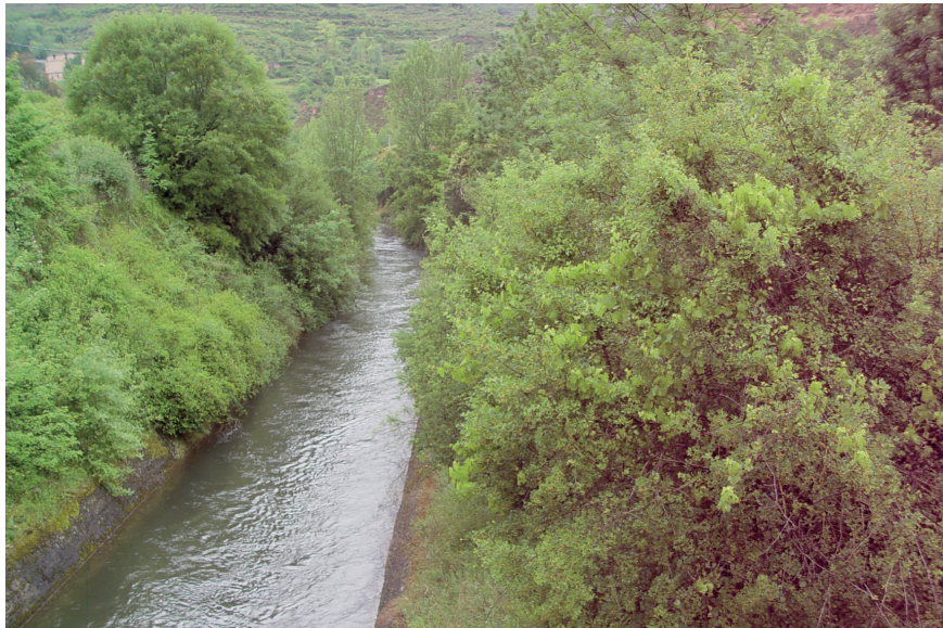
Fig. 6. El mantenimiento o mejora de las instalaciones hidráulicas del Najerilla pueden amenazar a ejemplares como el 1D05.