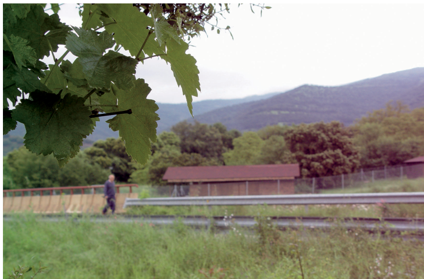
Fig. 5. Un mantenimiento o mejora poco cuidadosos de la carretera LR-113 pueden poner en peligro la supervivencia de ejemplares como este 3D01.