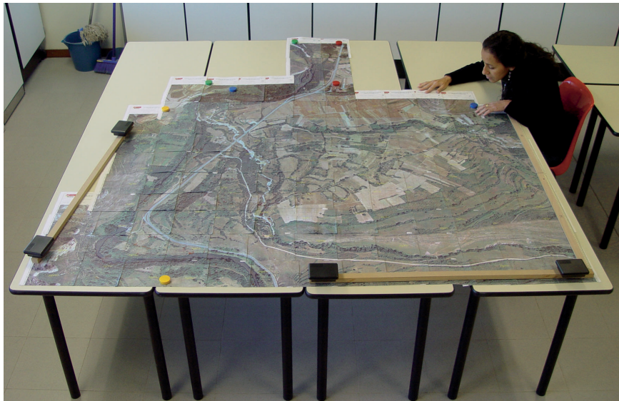
Fig. 2. Montaje de las cuadrículas con las ortofotografías a escala 1:1000 organizadas en filas y columnas.

Para realizar esta exploración se contó con el auxilio de ortofotografías actualizadas y georreferenciadas del terreno a escala 1:1000 obtenidas del visor SIGPAC del Gobierno de La Rioja-Ministerio de Agricultura, Pesca y Alimentación, y se reticuló la superficie de trabajo para facilitar el recorrido de la misma y la identificación de los objetos existentes en ella, obteniéndose 121 cuadrículas de unos 32.812'5 m 2 (0'03 Km 2 ) cada una (incluido el solape necesario entre ellas), haciendo corresponder a cada cuadrícula una ortofotografía (véase la figura 2).