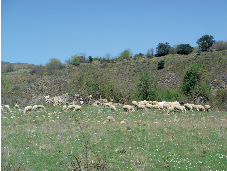
Fig. 10. El ramoneo indiscriminado puede provocar daños irreparables sobre los ejemplares de esta población de vid salvaje, como por ejemplo el 9D05 de esta fotografía.

Como ejemplo y prueba del proceso de deterioro de la población, se puede indicar que en el periodo de tiempo que medió entre la toma de datos de junio-julio y de septiembre se registró la desaparición de varios ejemplares de vid salvaje, y de sus respectivos tutores y cortejo floral, como consecuencia del proceso de urbanización incontrolada que se está dando en los terrenos próximos a la carretera.