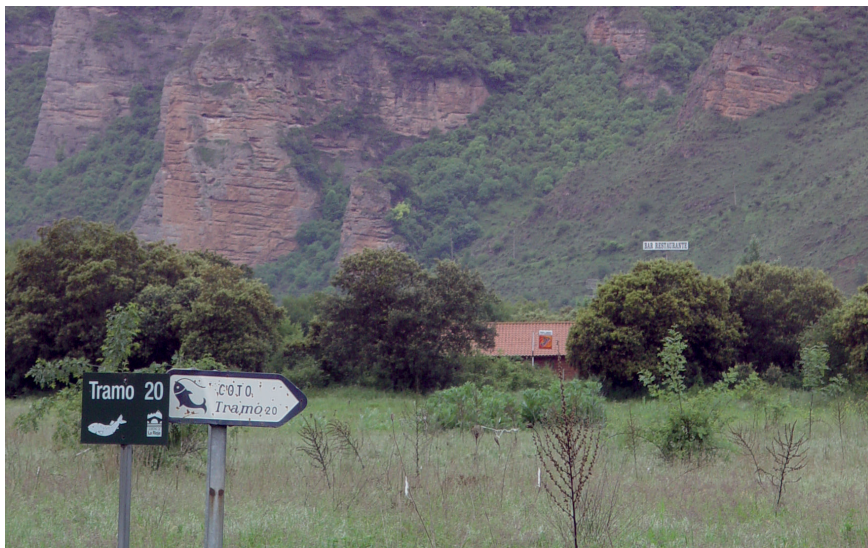
Fig. 9. Las labores de desbroce sin control para facilitar el acceso a los cotos de pesca pueden acabar con algunos ejemplares de la población de vid salvaje (0F01, 1D04, 1C01, etcétera). Acceso al coto de pesca en su tramo 20.