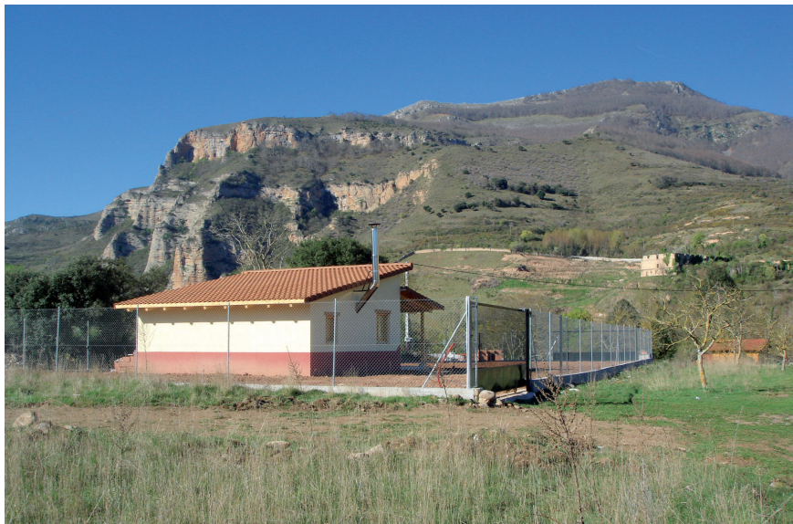
Fig. 3. Construcciones no planificadas paisajísticamente en las proximidades del ejemplar 1D05.

En las figuras siguientes se muestran gráficamente algunos ejemplos de los peligros y de las amenazas relacionados anteriormente.