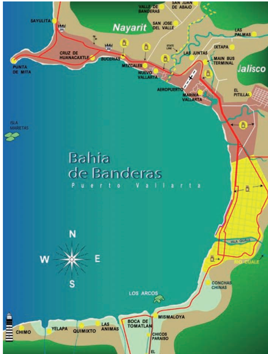
Figura 2.

condición de aislamiento y la falta de infraestructura básica le han impedido captar parte del importante flujo de visitantes que recibe la Bahía de Banderas.