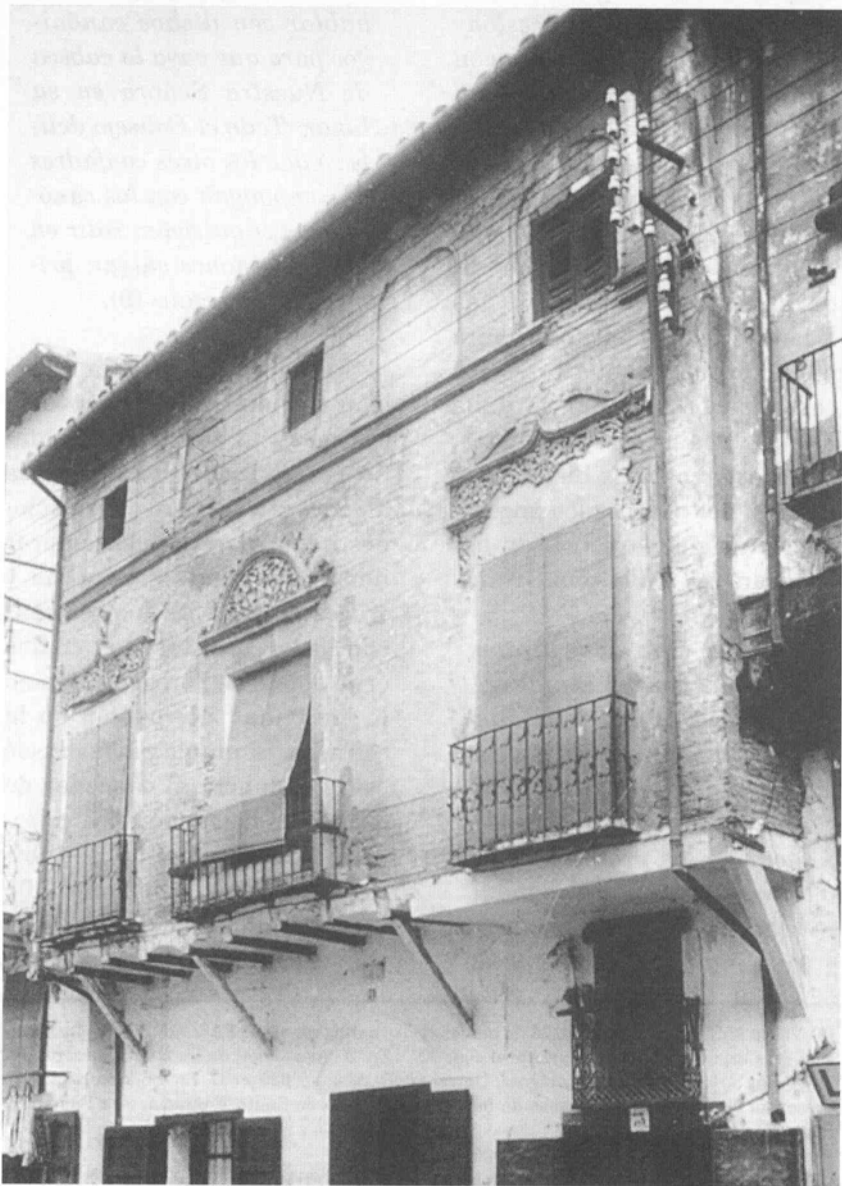
Daroca, 1947. Casa en el n.º 71 de la Calle Mayor.