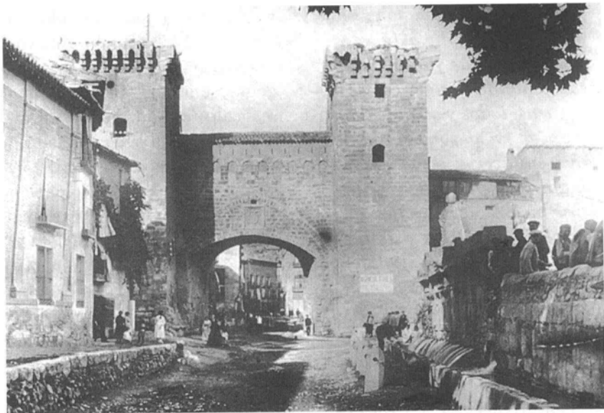
Daroca, 1918.

por el control y la prohibición —sin mucho afán, bien es verdad— de estas actividades lúdicas. Así, en 1557 el Concejo ordenaba «no poner mayo sin permiso del Justicia». En 1565 y 1568, de manera taxativa el municipio disponía «no hacer ni llevar mayo» bajo severas penas.