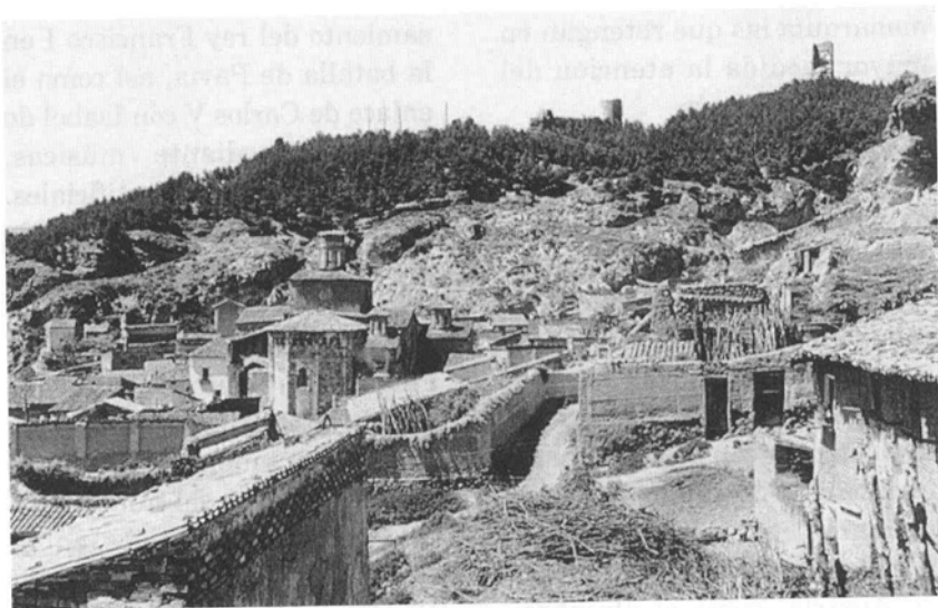
Daroca, vista desde la iglesia de San Juan de los cerros repoblados.

Concejo, de acuerdo con la tradición medieval, costes de relieve. De forma bien distinta ocurrirá con las diversas visitas —1563, 1578, 1585— realizadas por Felipe II a Daroca, que introducen una concepción del espectáculo festivo mucho menos austera, más rica, variada y acorde con la bonanza de los tiempos.