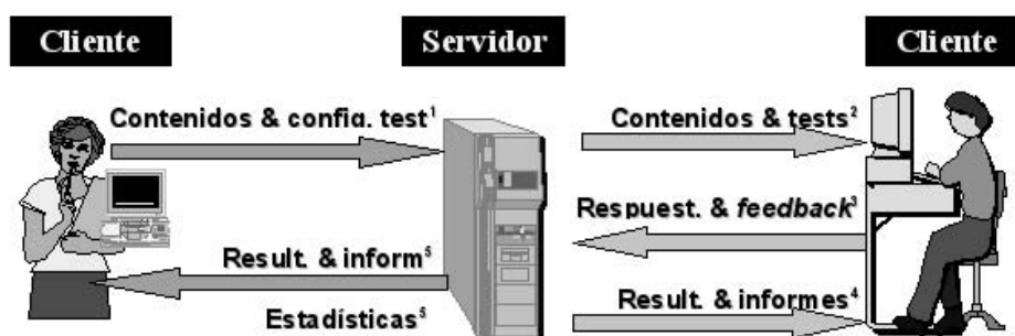
Figura 2. Estructura y funcionamiento de AulaWeb

Veamos las principales características de cliente y servidor en la siguiente tabla: