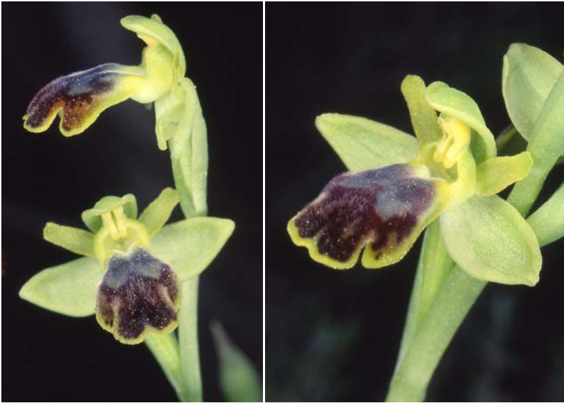
Fig. 4.- Ophrys × luentina Delforge: Racó de Palafox, La Nucia.

lafox, 28-III-2002 (ABH 45900). Estos híbridos muestran un claro carácter intermedio y se ajustan perfectamente a la descripción que dio DELFORGE (1999) para el holótipo de su especie, recolectado en los alrededores de Biar (Alicante).