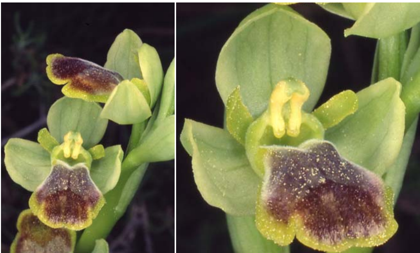
Fig. 1.- Ophrys × fraresiana M.R. Lowe, Piera & M.B. Crespo: detalles del holótipo.

Tomamos como epíteto específico “Els Frares”, nombre con el que se conoce localmente cierto enclave de la vertiente septentrional de La Serrella, próximo al casco urbano de Quatretondeta, en áreas