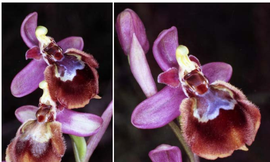
Fig. 2.- Ophrys × heraultii G. Keller ex W.J. Schrenk: l'Anetillar, Cases de Planisses, Xaló.

En lo que se refiere a la localidad de l'Anetillar (cases de Planisses, Xaló), se observaron dos ejemplares de Ophrys × heraultii (abundancia: I) en plena floración (FF), ambos con cuatro flores abiertas. Convivían con sus progenitores: O. speculum Link (II, FF) y O. tenthredinifera Willd. (II, FF), en unos bancales delimitados por lejas aplanadas y aclarados de vegetación autóctona por su actual propietario, quien además ha recuperado el topónimo L'Anetillar de un mapa antiguo del catastro de Llíber (Alicante).