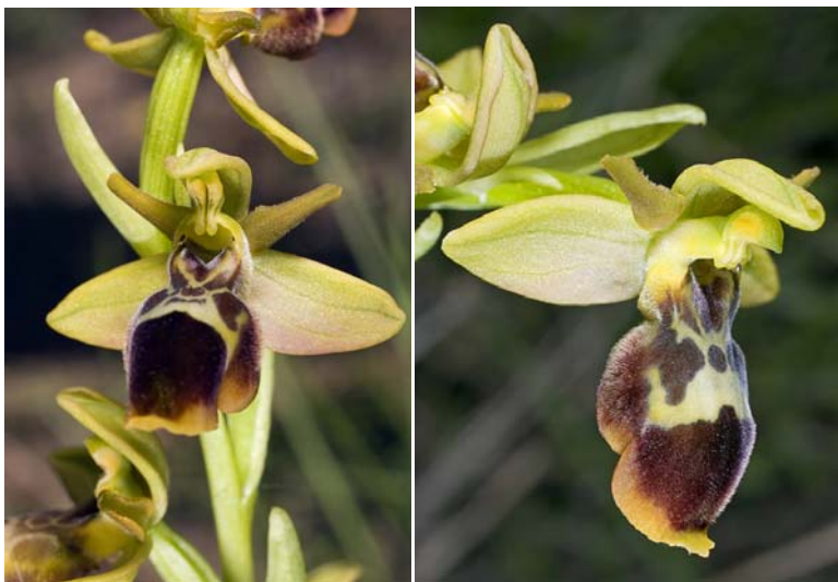
Fig. 5.- Ophrys x pseudospeculum DC.: Casetes Noves del Pi, Bocairent.

mientras no pueda estudiarse con detenimiento su tipo, depositado en el herbario G (Jardín Botánico de Ginebra), no vemos razón objetiva para descartar este nombre.