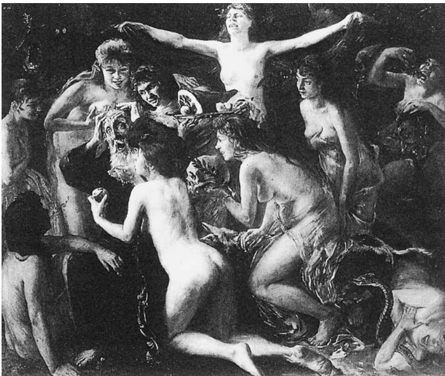
LÁM. 6. Tentación de San Antonio. 1897. Lovis Corinth.