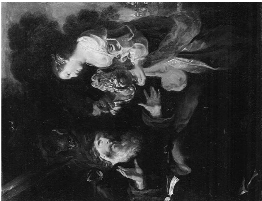
L.ÁM. 2. La Tentación de San Antonio, 1624-1625. Johann Liss.