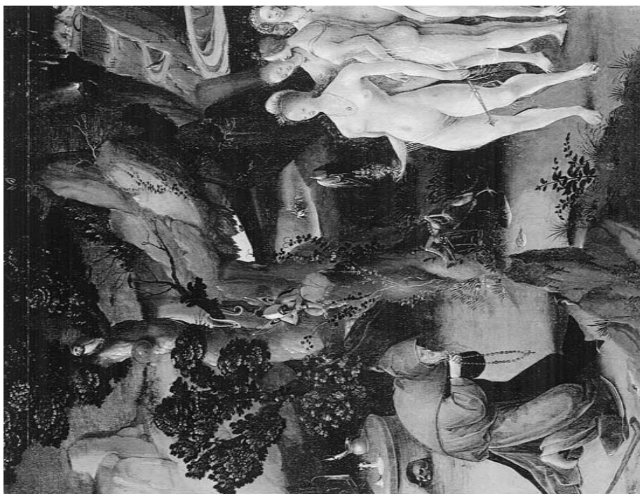
L.ÁM. 1. La Tentación de San Antonio, 1520. Jan Wellens Cock.