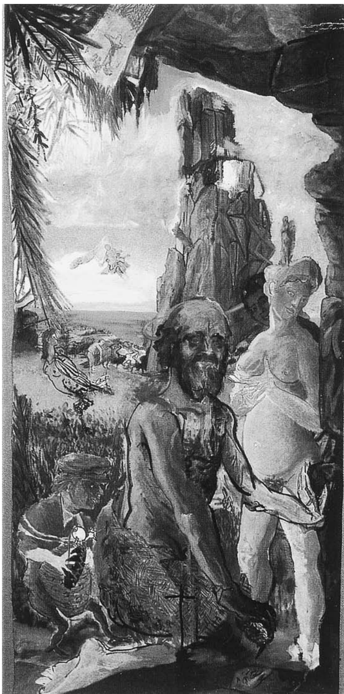
LÁM. 15. Tentaciones de San Antonio . 1992. C. Franco.