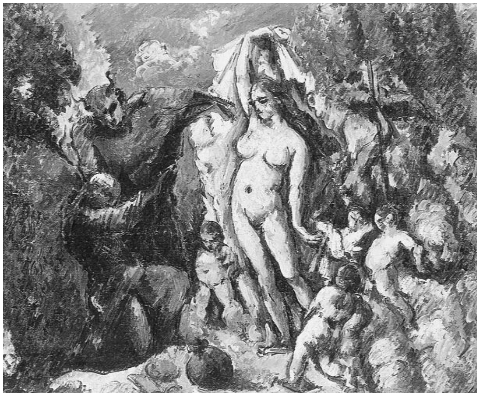
LÁM. 3. La Tentación de San Antonio . 1873-1877. Cézanne.

oscuro. Los arbustos, que indican que las tentaciones tienen lugar al aire libre, son verdosos. Los cuerpos desnudos son de color blanquecino. El fondo del lado derecho es azulado, al igual que el cielo. Se observa, pues, un fuerte contraste de colores.