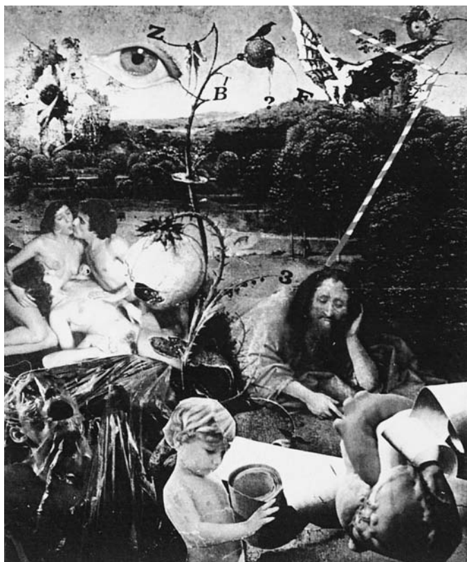
LÁM. 14. Las Tentaciones de San Antonio . Hacia 1990. V. Nello.