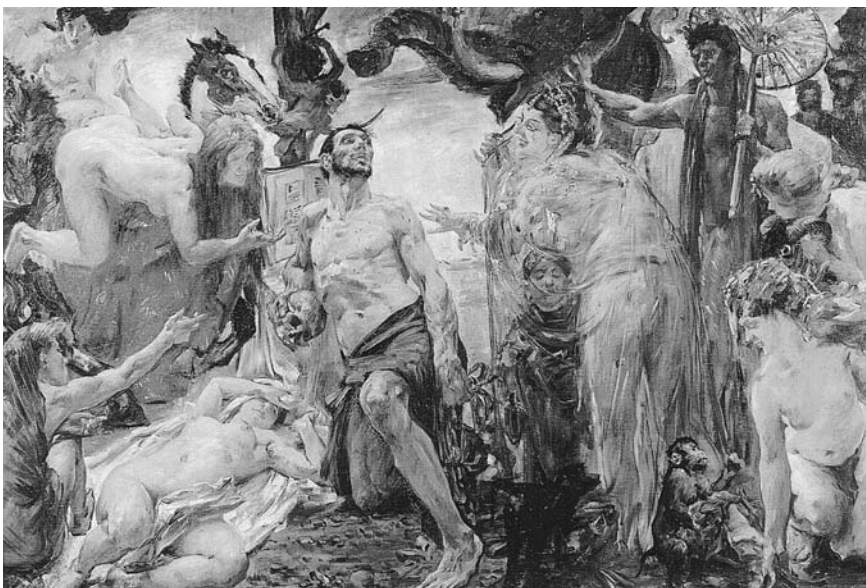
LÁM. 7. Tentación de San Antonio. 1908. Lovis Corinth.