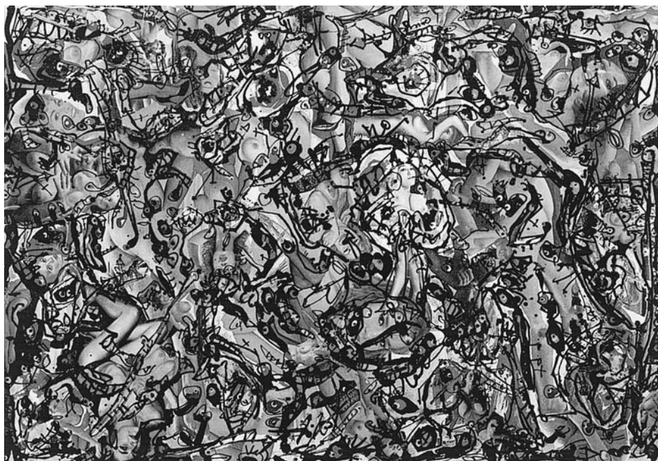
LÁM. 10. Tentaciones de San Antonio . 1964. A. Saura.