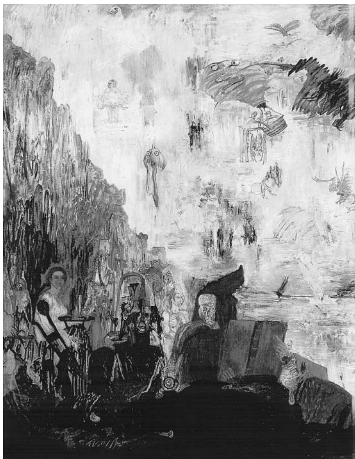
LÁM. 5. Las Tribulaciones de San Antonio. 1887. Ensor.

impresionismo. Su pintura es muy expresiva, fantasmagórica, agresiva y chillona. Su punto de vista sobre los acontecimientos y el mundo eran profundamente subjetivos. Su universo es fantástico, como queda bien patente en sus dos cuadros, La Tentación de San Antonio , uno de ellos conservado en el Museo de Arte Moderno de Nueva York, y el segundo guardado en una colección particular. Es, al mismo tiempo, irónico y sarcástico. Hace del mundo una crítica radical. Todas estas cualidades explican su interés por la figura de Don Quijote. Se acusa en su obra el influjo de El Bosco, de Bruegel, de Rembrandt y de Rops, entre otros. Los dos cuadros, que tienen como protagonista a San Antonio, son un excelente exponente de las corrientes artísticas del arte de Ensor. En ambos se observa una total libertad de imaginación. En Las Tribulaciones de San Antonio hay un fuerte contraste de colores. En La Tentación de San Antonio dominan los tonos amarillentos. La tentación se presta a una serie de visiones fantásticas y sin coherencia. El conjunto es al mismo tiempo caótico y ruidoso. En el ángulo inferior izquierdo marcha una procesión de burgueses bien identificados