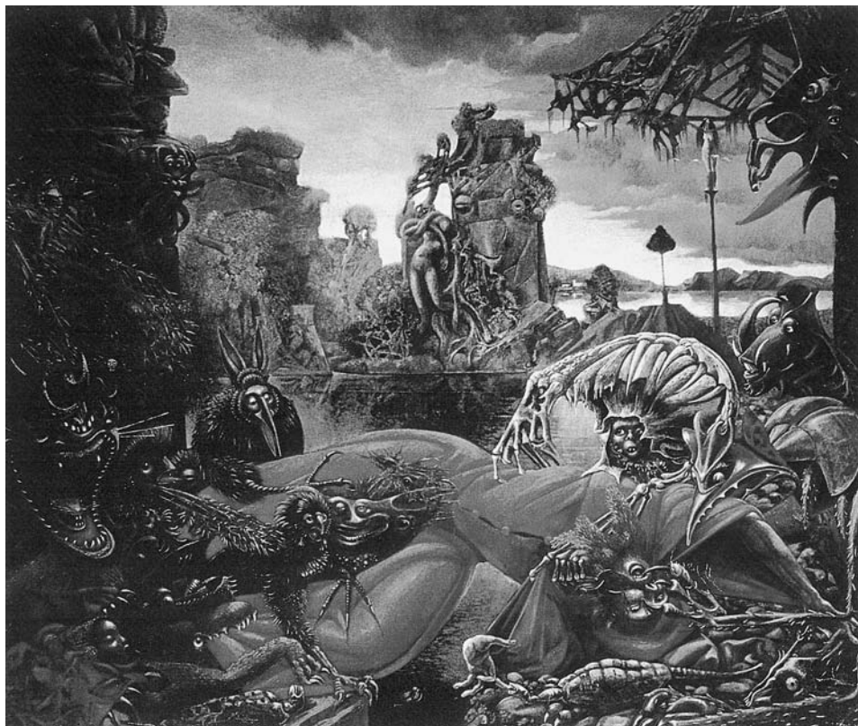
LÁM. 8. La Tentación de San Antonio . 1945. Max Ernst

dama desnuda, de pie, y de frente, es parecido al representado en su cuadro, datado entre los años 1940-1942, que lleva por título La Europa después del diluvio , en la actualidad en el Wadsworth Atheneum de Hartford, también con una dama desnuda, colocada de frente.