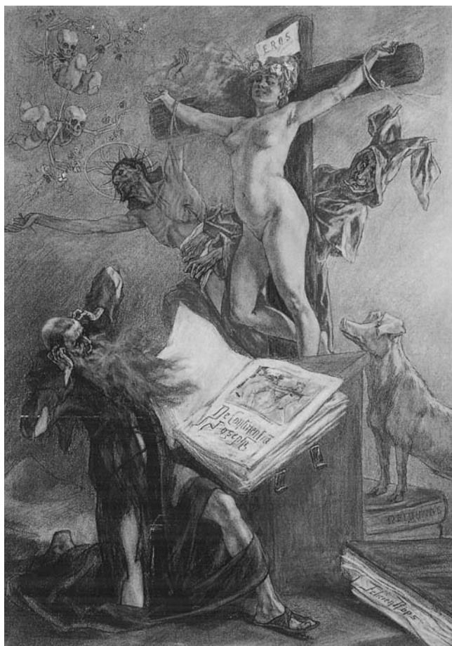
LÁM. 4. La Tentación de San Antonio . 1878. F. Rops.

libro. Detrás de la cruz, un cerdo apoya las patas delanteras en varios gruesos volúmenes, simboliza la lujuria. Detrás de la cruz, y envuelto en su manto rojo, que le tapa los cuernos, un diablo saca la lengua esperando el desenlace. Dos diablillos con una calavera por cabeza revolotean. Queda bien patente que el cuerpo de la mujer desnuda es el símbolo de lo inmundo. En la citada acuarela, Pornokrates , 1878, aquí una mujer desnuda conduce atado por una cuerda a un cerdo. En el cielo revolotean tres angelillos.