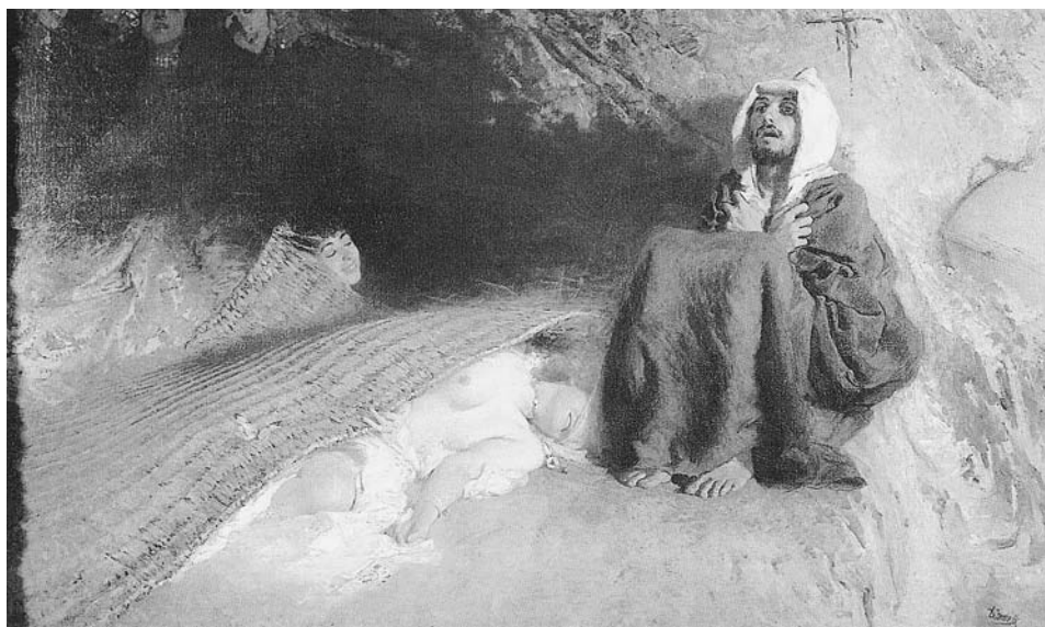
LÁM. 13. La Tentación de San Antonio . 1903. D. Morelli.