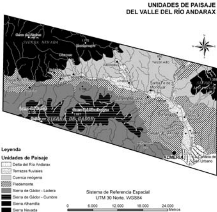
2. Unidades de paisaje del valle del río Andarax

En la cuenca del río Andarax se pueden distinguir las siguientes unidades de paisaje, basadas en las características de sus formas de relieve estructural, en sus formas de modelado y en las formaciones vegetales: el extremo oriental de Sierra Nevada, la sierra de Gádor, la sierra de Alhamilla, los piedemontes, el sistema de cárcavas de la cuenca sedimentaria neógena del Andarax, el sistema de terrazas aluviales del río Andarax y el delta del río Andarax (fig. 2).