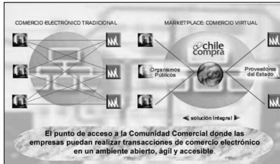
Figura 2 Comercio virtual Chilecompra