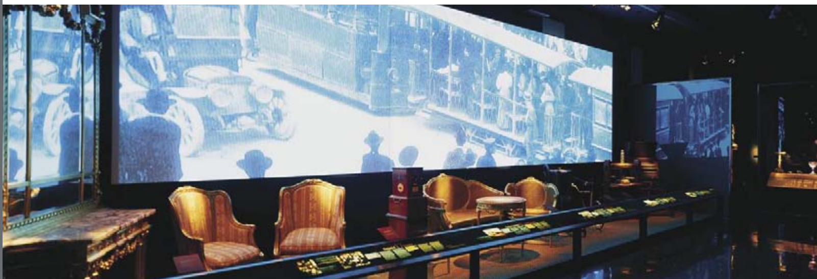
Figura 6. Audiovisual con documentación histórica y gráfica de la Sala de Edad Moderna y Contemporánea.

cada a la cultura romana y que constituye una excepcional producción, llevada a cabo por el especialista Jorge Molina, el cual ha realizado una extraordinaria restitución y reconstrucción virtual de nuestro parque arqueológico, el de la ciudad de Lucentum, en el Tossal de Manises de la Albufereta de Alicante. Esta monumental infografía virtual, -que se proyecta en dos pantallas de 14 metros, utilizándose 6 proyectores sincronizados-, se desarrolla en siete escenas en las que se han reconstruido minuciosamente panorámicas de los paisajes de la época y los espacios y edificios de la ciudad romana, integrando en ellas personajes y figuras en, así como la mayor parte de los objetos que se exhiben en la sala; de esta forma, se alcanza un buscado realismo didáctico que facilita la comprensión del yacimiento y de su vida cotidiana a los visitantes del Museo y del Parque Arqueológico; constituyéndose en una potente herramienta de valor educativo destinada al gran público y sobre todo a los grupos de estudiantes o de otros colectivos que concertan de forma conjunta y complementaria la visita al museo y al yacimiento.