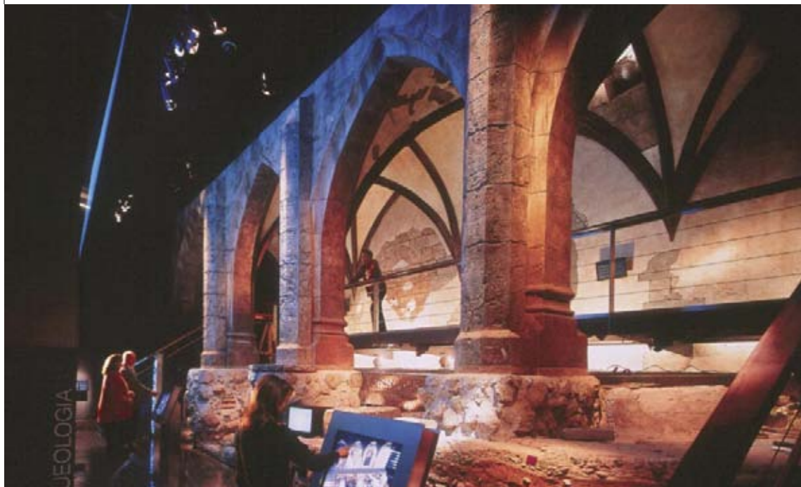
Figura 9. Escenografía de la Sala de Arqueología Urbana.

visión de una arqueología integral capaz de analizar no sólo los contextos arqueológicos enterrados, sino también los edificios en su conjunto, en lo que denominamos Arqueología de la Arquitectura, con el fin de acercarnos a una arqueología total de los complejos edificados con sus contextos objetuales.