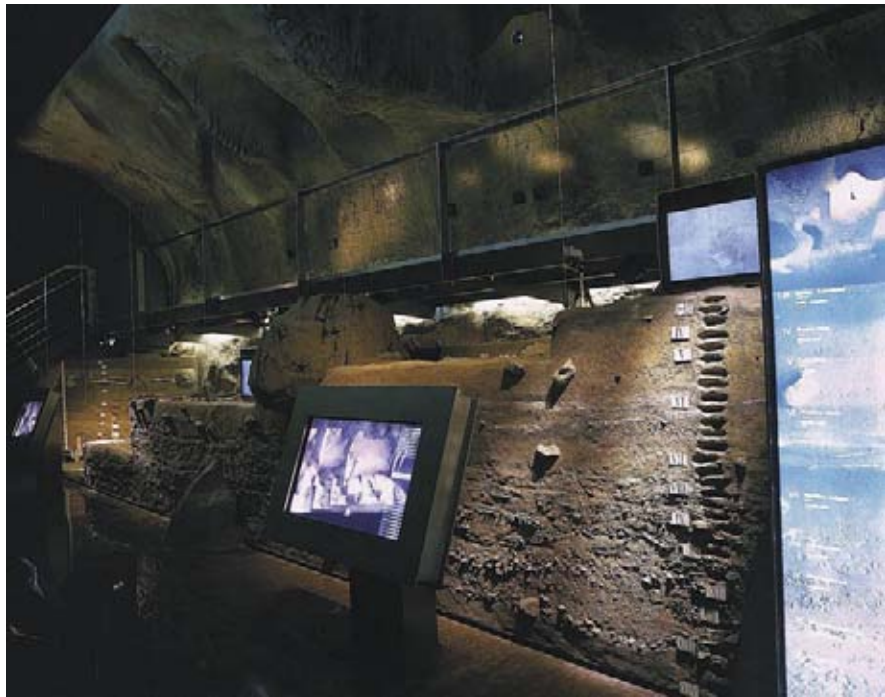
Figura 8. Escenografía de la Sala de Arqueología de Campo.

de profesionales de distintos campos de la ciencia-, de todos los registros documentales que maneja la arqueología, desde los meros objetos hasta los documentos ambientales, pasando por los epigráficos y geográficos, permite la reinterpretación y reconstrucción de la evolución y transformación de nuestro paisaje, de nuestras ciudades o de cómo se produjo la interculturalidad facilitada por nuestra condición de territorio mediterráneo.