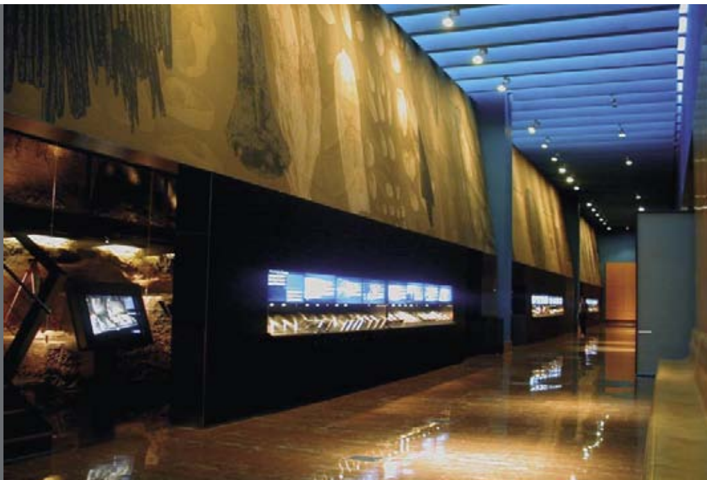
Figura 1. MARQ. Espacio comunicador y vertebrador de las Salas Permanentes.

de basar la museología emergente, acorde con los nuevos tiempos del nuevo siglo.