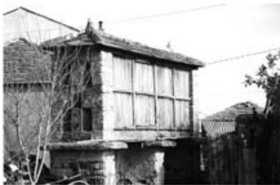
Fig. 9 Cabozo tipo mixto de Encrucelada-Folgueiro (Suegos)

Tipo mixto; segundo Leal Bóveda (1999) é unha mestura dos dous anteriores con paredes de vigas de pedra, doelas de madeira e fachadas pequenas, norte e sur, con seteiras de pedra. Susténtase con muretes e o peche da cámara faise con balaústres de madeira colocados verticalmente namentres que nos lados máis curtos fanse seteiras coma as do tipo Ribadeo. Segundo o devandito autor (1999:115) aparecen sobre todo nos concellos de Viveiro e O Vicedo. (Vid. Fig. 9 e 10)