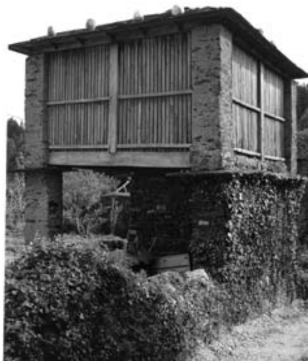
Fig. 16.- Cabozo de planta cadrada. Suegos.