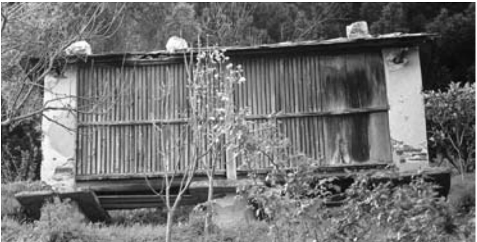
Fig. 21.- Cabozos de tipo mariñán en Suegos.