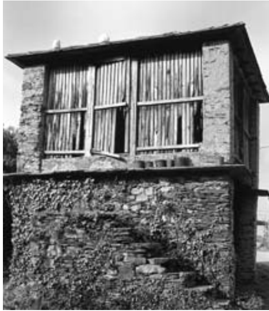
Fig. 17.- Acceso con escada. Cabozo de Suegos.