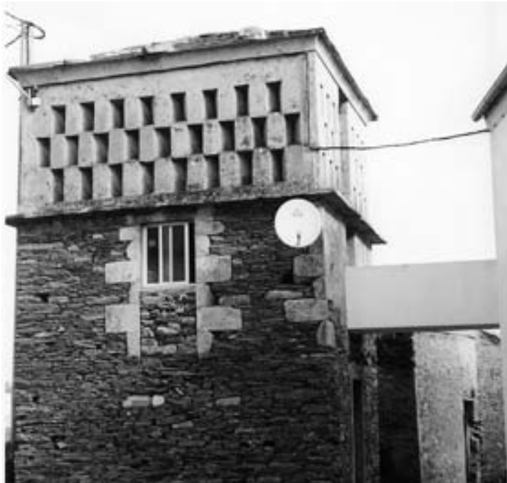
Fig. 18.- Cabozo de Encrucelada-Folgueiro