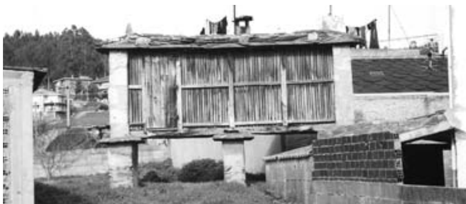
Fig. 22.- Cabozo de Encrucelada-Folgueiro.

Do tipo Mondoñedo ou mariñán tamén hai varios exemplares. Un deles sito en Suegos ten tres tramos no lado máis longo da cámara, ésta apoiase en catro mure-