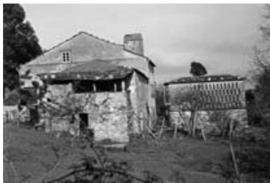
Fig.2 Cabozo preto da casa. Suegos (O Vicedo)

Con respecto á orientación do hórreo ademais de escoller un lugar elevado se se trata do tipo mixto rectangular a zona máis longa estará baixo a influencia dos ventos dominantes para favorecer a ventilación do millo e contribuír á súa maduración, que no caso da Mariña serían os de dirección norte-sur e viceversa.