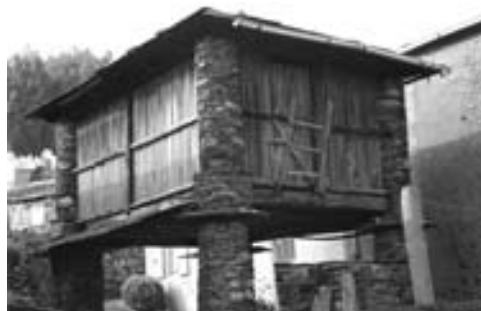
Fig. 20.- Tres cabozos de planta cadrada sobre piares e sobre cabana pechada en Suegos