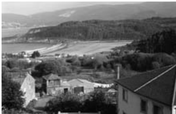
Fig. 1 Suegos (O Vicedo) con cabozo de planta cadrada e praia de Abrela ó lonxe.

Este traballo ten a intención fundamental de catalogar e dar a coñecer os cabozos de Suegos, parroquia do concello lucense do Vicedo, que posúe a orixinalidade de contar con exemplares das principais tipoloxías de hórreos, incluídos os de planta cadrada, ó tempo que aproveita para facer unhas pequenas reflexións introductorias sobre estas senlleiras construcións como principais expoñentes da arquitectura popular galega.