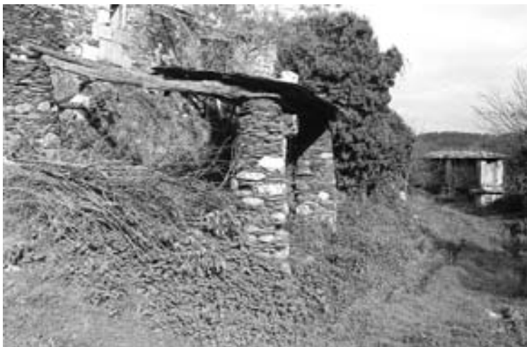
Fig. 15.- Soportes de sección circular coma os dos cabozos de planta cadrada. Suegos