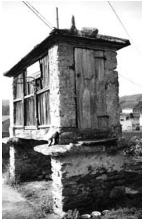
Fig. 6. Porta de acceso ó cabozo. O Viso-Folgueiro (Suegos)