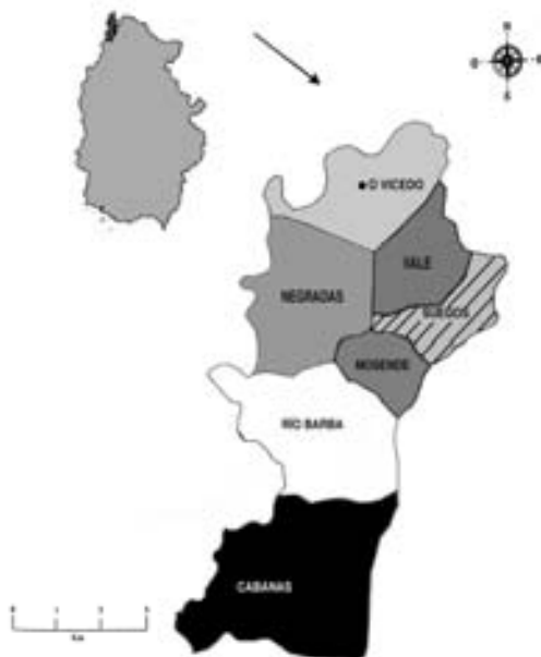
Fig. 13 Mapa da provincia de Lugo co concello de O Vicedo e as súas parroquias: Vicedo, Negradas, Vale, Suegos, Moserde, Río Barba e Cabanas.

Na Mariña lucense o hórreo chámase principalmente “cabozo” deixando a primeira denominación para o castelán. Ben é certo que a nomenclatura varía segundo as zonas ó igual que os elementos constructivos que aínda que sexan os mesmos teñen distintas denominacións, esta riqueza de sinónimos xa foi estudiaada por varios investigadores 13 . Polo tanto, usamos preferentemente este termo para referirnos ós cabozos mariñáns e ós de Suegos (O Vicedo) en particular.