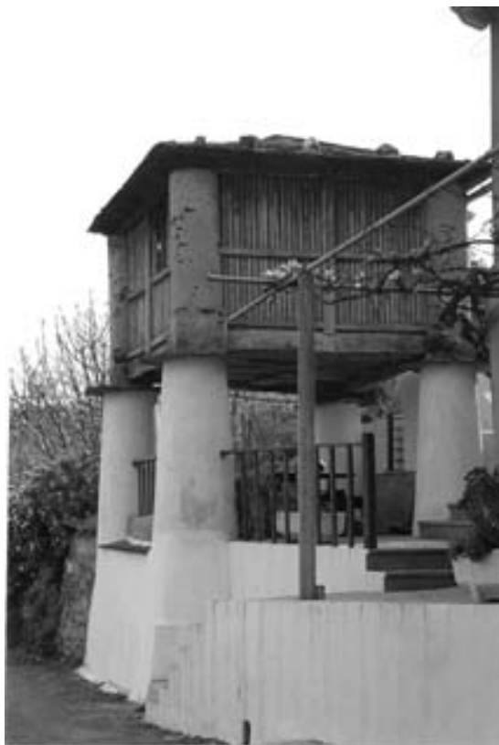
Fig. 14 Cabozo de planta cadrada de Fontao (Suegos).

Os cabozos de Suegos tamén comezan a súa construción pola base, estes de tipo asturiano susténtanse sobre piares troncopiramidais de sección circular construídos con cachotería basta unida con barro, en ocasións enfuscada exteriormente con argamasa ,tal como podemos ver nas ilustracións (fig. 12 e 14). Este tipo de soportes tamén os constatamos, pero só en Fontao e arredores, utilizado para outras construcións auxiliares coma alpendres e cabanas (vid. Fig. 15). Nun caso puntual a sección circular modifícase converténdose en cadrada (vid. Fig. 16) e ás veces cobran dimensións sobresaíntes en altura para salva-lo desnivel do terreo e darlle á propia cabana a estabilidade da liña recta (vid. Fig.