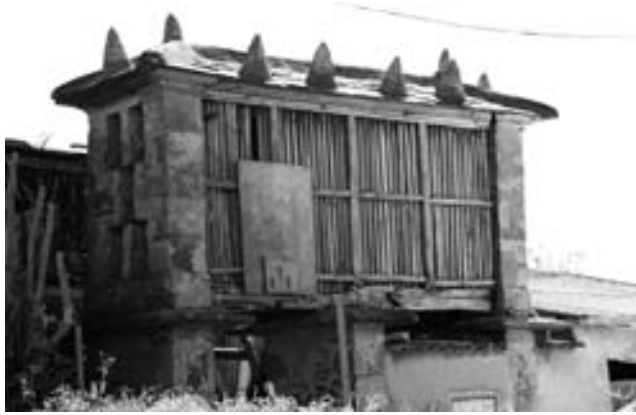
Fig. 10 Cabozo tipo mixto de Folgheiro (Suegos)

Tipo asturiano; planta cadrada cos catro lados practicamente iguais, teito cónico ou piramidal dependendo se é de colmo ou de lousa respectivamente. O beirado da cuberta é amplo para que debaixo se poidan pendurar ferramentas e apeiros (GONZÁLEZ PÉREZ, C. 2000:26). Cómpre salientar que os hórreos asturianos teñen moito traballo de ornamentación tanto nas portas talladas como en todo o exterior da construción, estes detalles aparecen tamén nos hórreos naviegos 12 (Vid. Fig. 11) con motivos tipo esvásticas, tetrasceles inscritos nun círculo, cruces, estrelas, etc. e en concellos limítrofes. Esta tipoloxía a nivel constructivo diferénciase do tipo mariñán en que as traves son de madeira e as columnas de cachotería de cachote ou lousa.