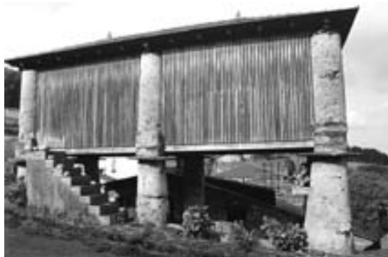
Figs 3 e 4 Rehabilitación de dous cabozos de Suegos.