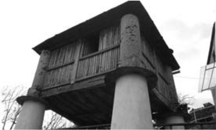
Fig. 12 cabozo de planta cuadrada de Fontao (Suegos).