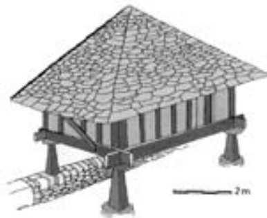
Fig.11 Hórreo lousado de planta cadrada en Coro, proximidades da serra de Ancares.

Unha derivación desta tipoloxía astur é a paneira que vén sendo un hórreo máis grande, de planta rectangular con máis de catro piares ou pegollus (pode chegar a 12) con cuberta a catro augas. Esta construción na zona nororiental de Lugo pódese mesturar cos hórreos galegos tipo ribadeo ou mariñán sendo estes espacios limítrofes zonas de confluencia de usos, costumes, lingua e construcións coma os hórreos. Nembargantes, O Vicedo sitúase na zona máis occidental da Mariña lucense lonxe da raia con Asturias e a pesar diso ostenta no seu termo municipal cabozos de planta cadrada de clara influencia asturiana.