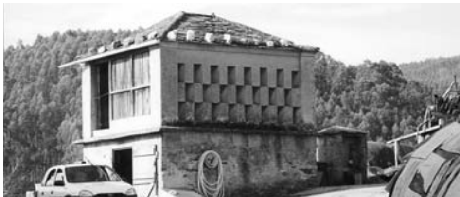
Fig. 19.- Cabo de Encrucelada-Folgueiro.