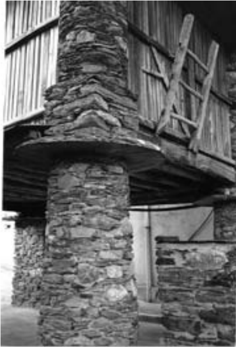
Fig. 5. Acceso ó cabozo con escada. Fontao (Suegos)