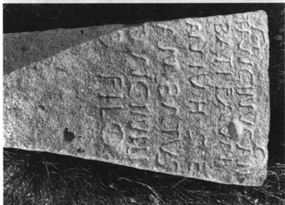
Inscripción de San Martín del Castañar