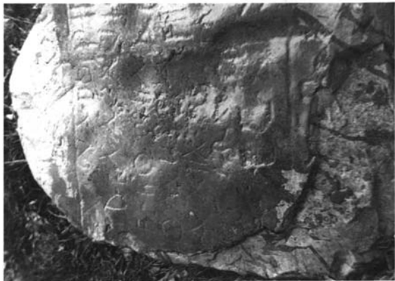
Inscripción de Vega de Rincos