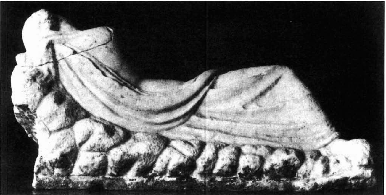
Figuras 3 y 4. Museo Nacional de Arqueología. Tarragona. Vista anterior y posterior de la ninfa adormecida procedente de la schola del collegium fabrum (Koppel, E. M a , 1985, lám. 31, 3-4).