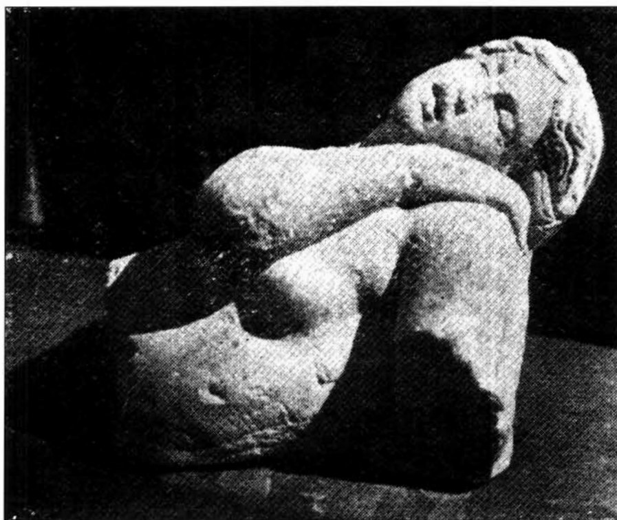
FIGURA 2. Cartagena. Estatua de ninfa adormecida (Jiménez, D., 1928, p. 267, fig. 10).

sus trabajos Balil 6 , Rodríguez 7 y Luzón 8 como simple paralelo de las esculturas por ellos estudiadas, pero nunca se le consagró un merecido examen en el que se consideraran sus particularidades primordiales y específicas. En fin, la labra no fue omitida en los estudios que Fabricotti dedicó a la sistematización del prototipo de las ninfas adormecidas y, en especial, a las reelaboraciones que se podían intuir en su seno 9 .