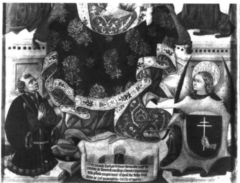
Figura 6- Detalle del donante del retablo de Tarazona (Zaragoza).