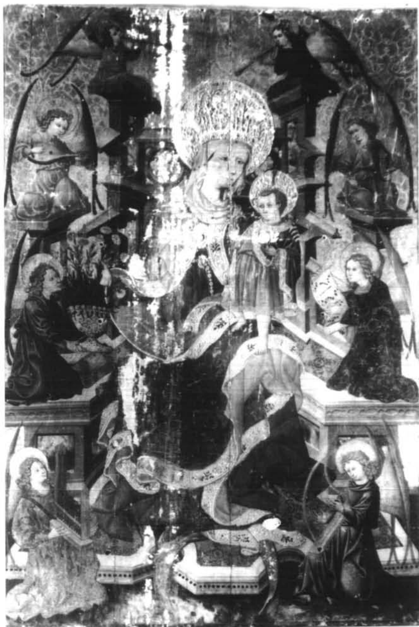
Figura 2- Virgen entronizada con ángeles músicos. Procede de Lanaja (Huesca)