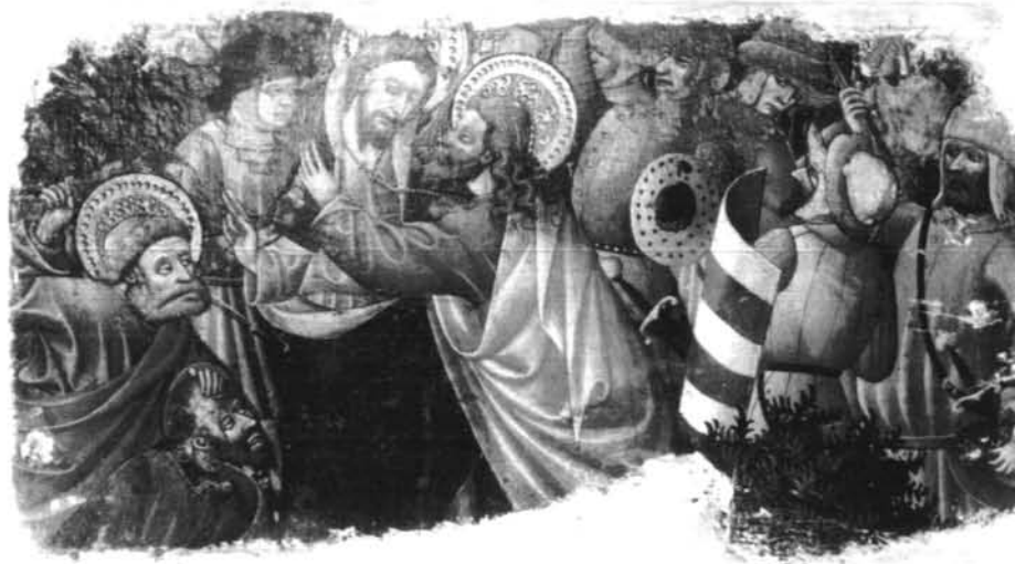
Figura 7- Prendimiento. Procede de Tarazona (Zaragoza)