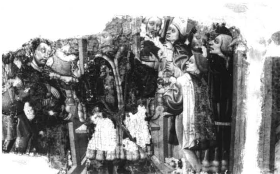
Figura 8- Lavatorio de Pilatos. Procede de Tarazona (Zaragoza).