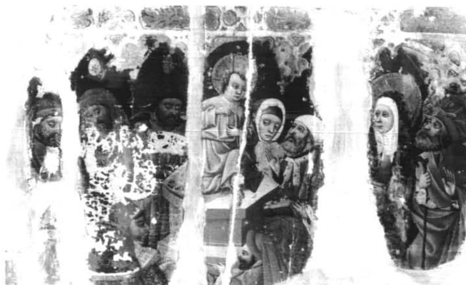
Figura 11- Jesús entre los Doctores de la ley. Procede de Tarazona (Zaragoza).