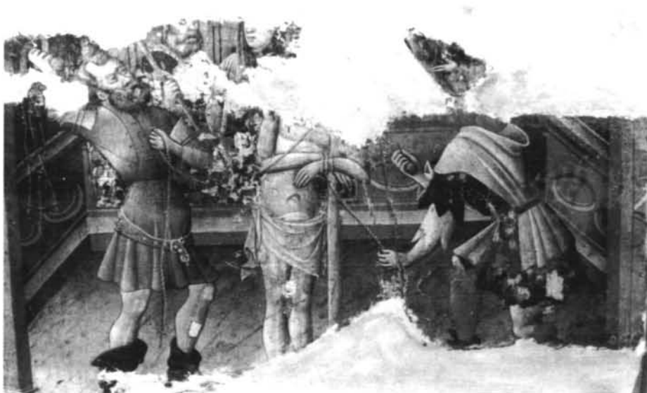
FIGURA 9- Flagelación. Procede de Tarazona (Zaragoza).