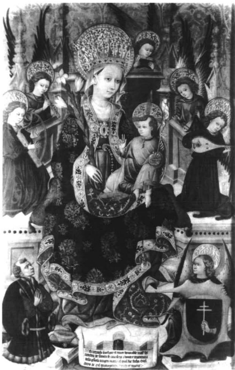
Figura 5- Virgen entronizada con ángeles músicos. Procede de Tarazona (Zaragoza).