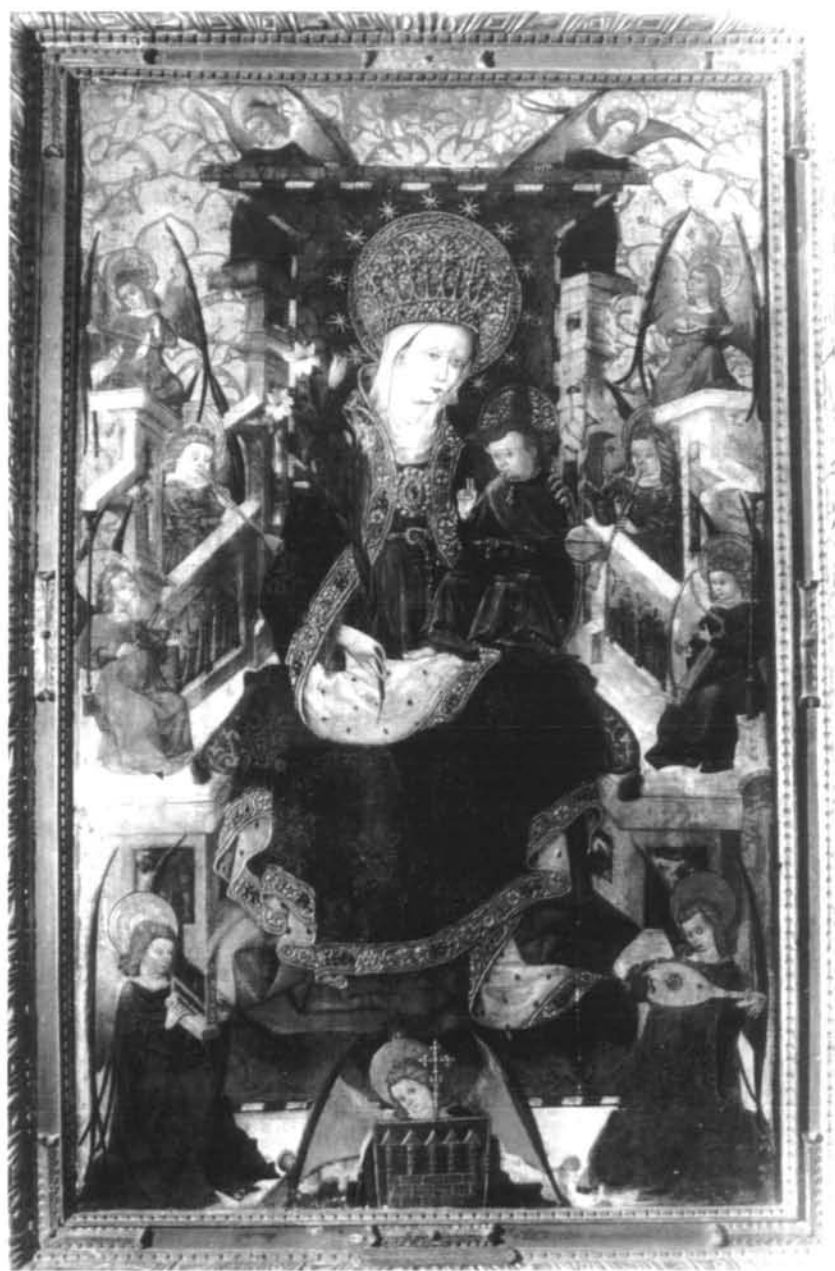
Figura 1- Virgen entronizada con ángeles músicos. Procede de Albalate (Tuel).