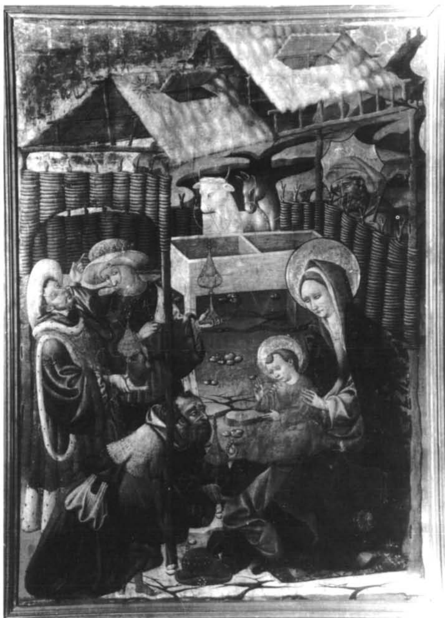
Figura 3- Epifanía. Procede de Lanaja (Huesca)