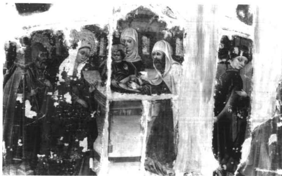
Figura 10- Circuncisión. Procede de Tarazona (Zaragoza).