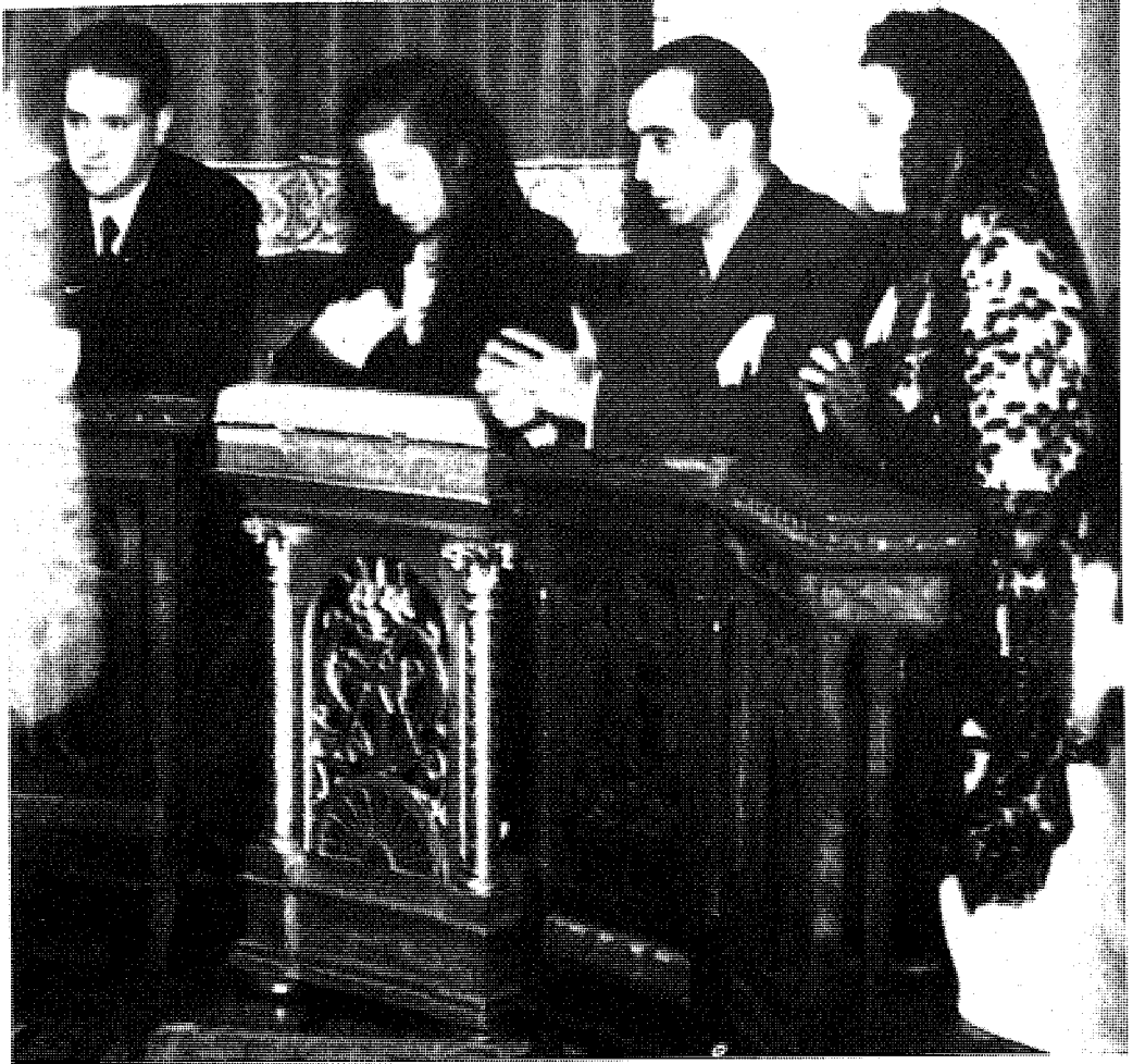
Irujo ministroa Barcelonan euskal eztei batean ezkon lagun bezala, Negrinen gobernuak errepublikano lurraldean sistema autoritarioa jarri zuenean.