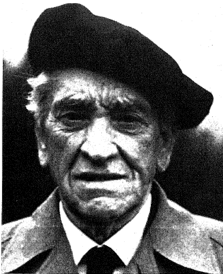
On Manuel 1981 ean, Eusko Ikaskuntzak eskaini zion omenaldian.