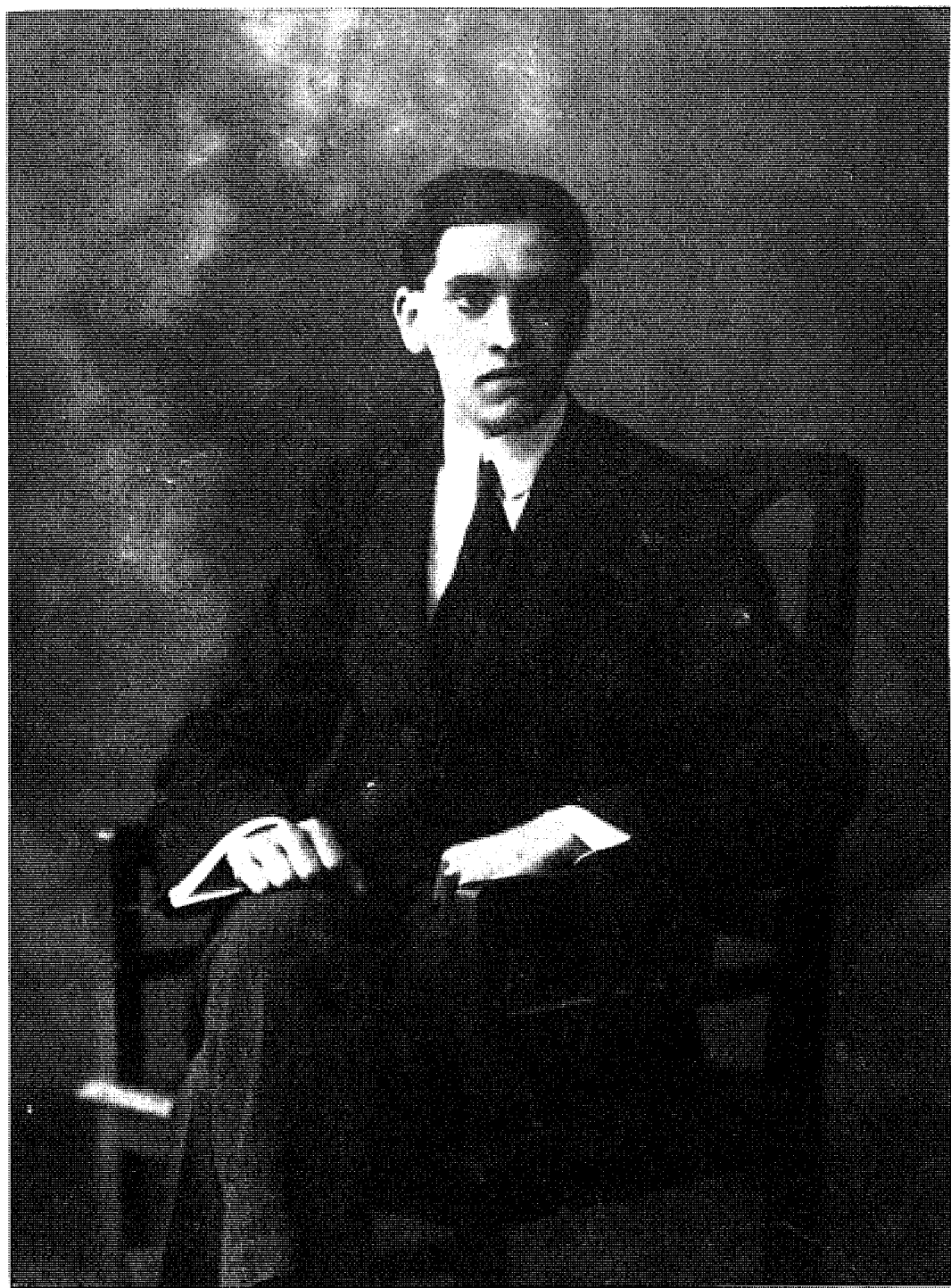
Manuel de Irujo 1920.urtean.