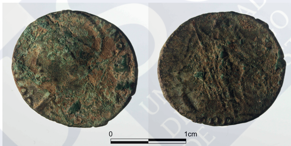
Figura 2. Follis conmemorativo de la fundación de Constantinopla acuñado en Tréveris.

Referencia bibliográfica: RIC VIII , pp.34 y 142-43.