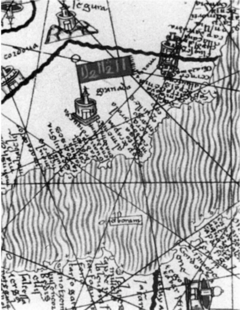
Carta Catalana de 1375