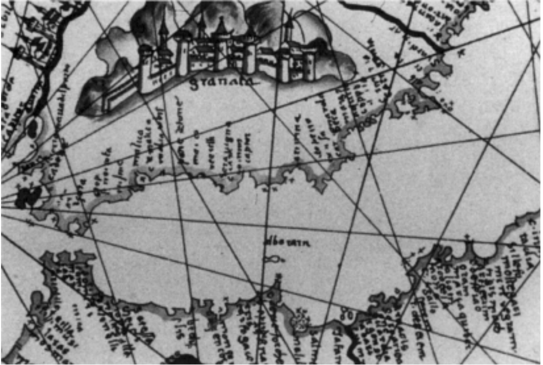
Carta Freducci d' Ancorae (1497)