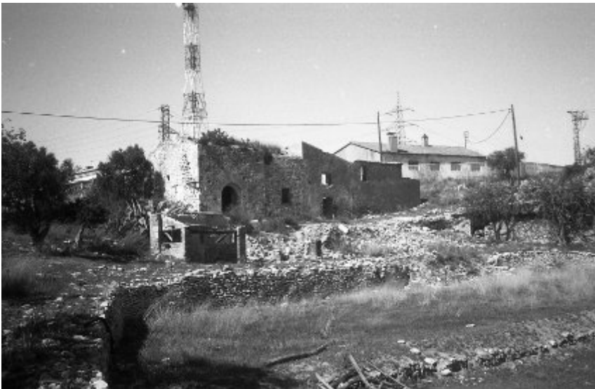
Imatges de l'església del Mangons als anys 1990, abans de l'expoli dels carreus de la portadlada. (Fotos: Jordi López).