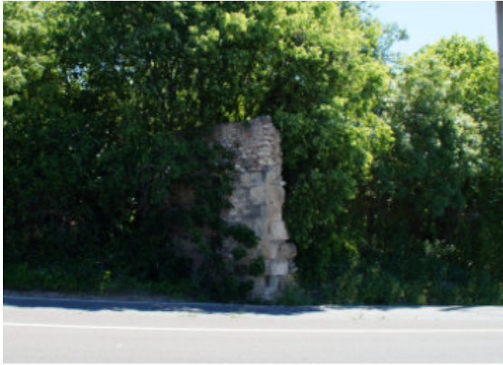
Unes poques restes del Molí de l'Horta, al Polígon de riu Clar (2016) (Foto: Josep Estivill. Arxiu Municipal de Constantí).

—Un d'aquests termes ròncs que has investigat és el dels Mangons, situat en un extrem del Polígon de Riu Clar. Com era aquest poble, quins límits tenia i quines restes hi són encara visibles?