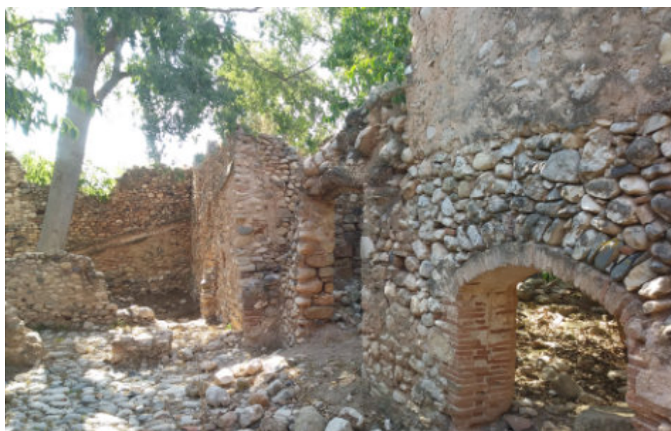
Dues vistes de les restes de la Granja dels Frares, al Morell, l'any 2018.