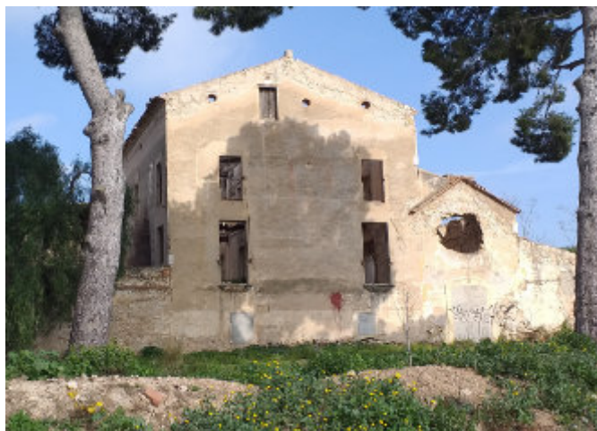
Façana del mas de Mascaró i, a la seva dreta, la capella dedicada a Sant Ignasi (2020) (Foto: Josep Estivill. Arxiu Municipal de Constantí).