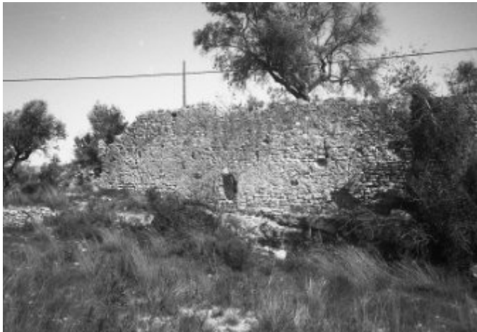
Restes del castell del Mangons als anys 1990.

el mas de Mascaró i, a partir del segle XVIII hi apareix també el mas de Castellarnau, format per l'adquisició de diversos trossos de terra. Pel que fa al moli dit de l'Horta o dels Mangons, malgrat l'atribució, estant situat al sud del rec de la Roca, es trobava ja dins del terme de Tarragona.