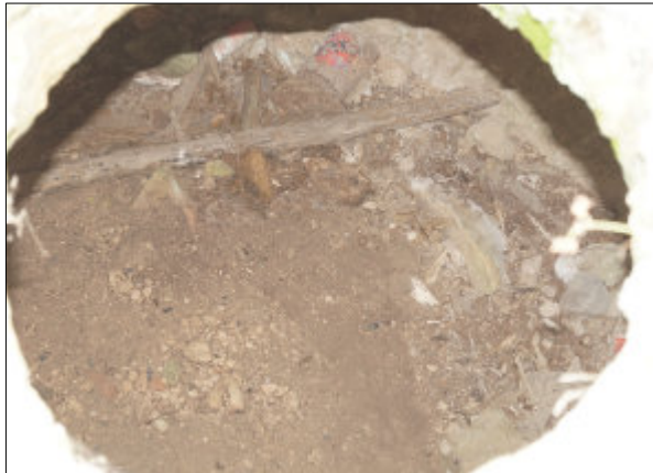
Dalt, una paret i alguns contraforts de l'ermita de Sant Llorenç. A sota, una de les sitges properes a l'ermita.

Els primers repobladors del segle XII per tal de poder establir els límits entre dos termes, a falta d'altres referents, tractant-se d'un territori "verge", sovint utilitzaren com a referència elements naturals de certa entitat, com un riu o una riera, la carena d'un monticle... fins i tot, en algun cas, antigues vies i restes romanes. Si acceptem com a bona la hipòtesi de Sant Llorenç com a enclavament del Constantí vell, l'únic element natural una mica important entre aquest i Llentisclell és el Riu Clar.. Hauria estat aquest la partió entre ambdós termes? Amb les dades que disposem a data d'avui ens és, malauradament, impossible de saber. El que sí sabem, però, és que el terme de la Selva, la Silva Constantina dels