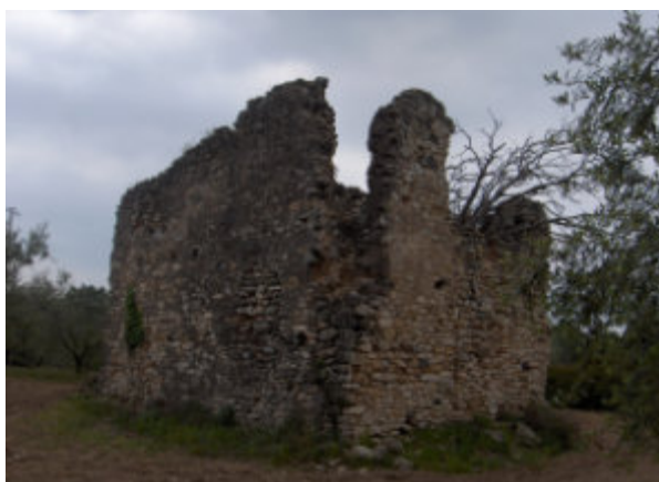
Dues imatges de les restes de l’“abadia” del Codony (2009).