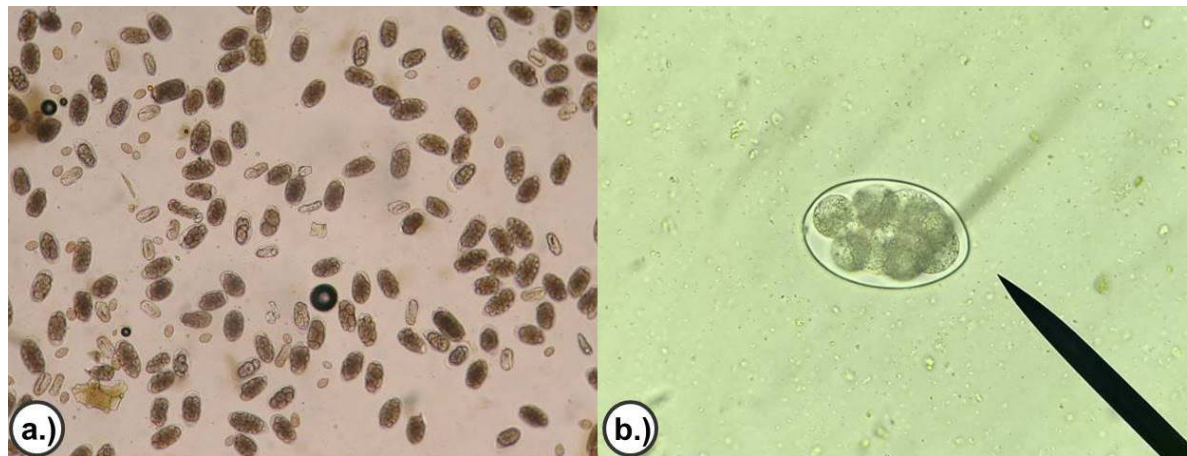
Figura 4. Huevos de Haemonchus contortus observados en el microscopio. a.) a 10x y b.) a 20x.