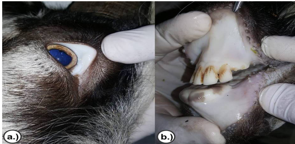
Figura 1. Marcada anemia grado 5 en escala FAMACHA. Observe el color pálido en las mucosas a.) ocular y b.) bucal.