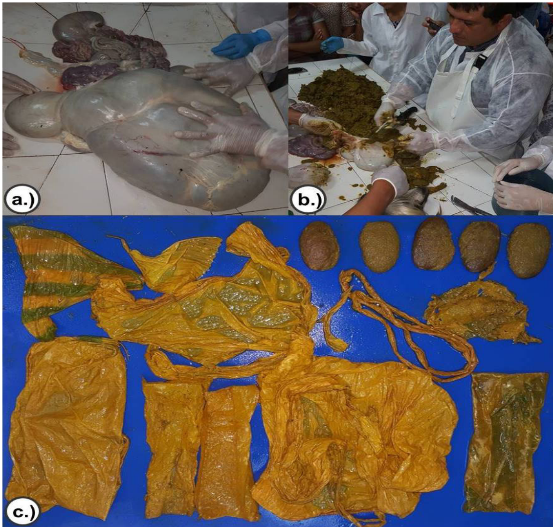
Figura 2. Procedimiento de necropsia. a.) Pre-estómagos con aumento considerable de tamaño. b.) Proceso de disección de rumen. c.) Grandes cantidades de bolsas de plástico y semillas de mango ( Mangifera spp).