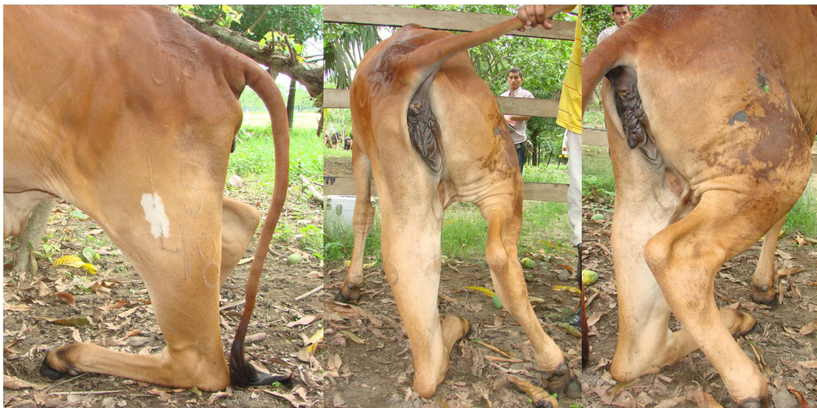
Figura 1. Apoyo plantar con el metatarso, obsérvese aumento de volumen en la región tibial en su cara lateral y posterior.

Una novilla de la Raza Gyr pura, de 1.5 años de edad y un peso aproximado de 180 Kg. Fue atendida por el servicio clínico ambulatorio del área de clínica de Médico-Quirúrgica de Grandes Animales de la Facultad de Medicina Veterinaria y Zootecnia de la Universidad de Córdoba.