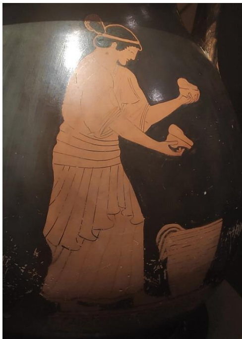
Figura 4. Pélice ático de figuras rojas atribuido al Pintor de Pan datada del 490-480 a. C. Museo Arqueológico de Atenas.

El trabajo de las mujeres, como vendedoras de alimentos, lo tenemos por tanto suficientemente documentado. En el caso de otros productos, como la sal, la miel, el sésamo o la fruta, su aparición está más que constatada en las fuentes escritas, incluso dentro de las obras de teatro. Estas mujeres que vendían alimentos en la calle tenían un trabajo que no estaba exento de peligros, pero que pone de manifiesto esa apropiación del espacio público por parte de las mujeres de la polis: