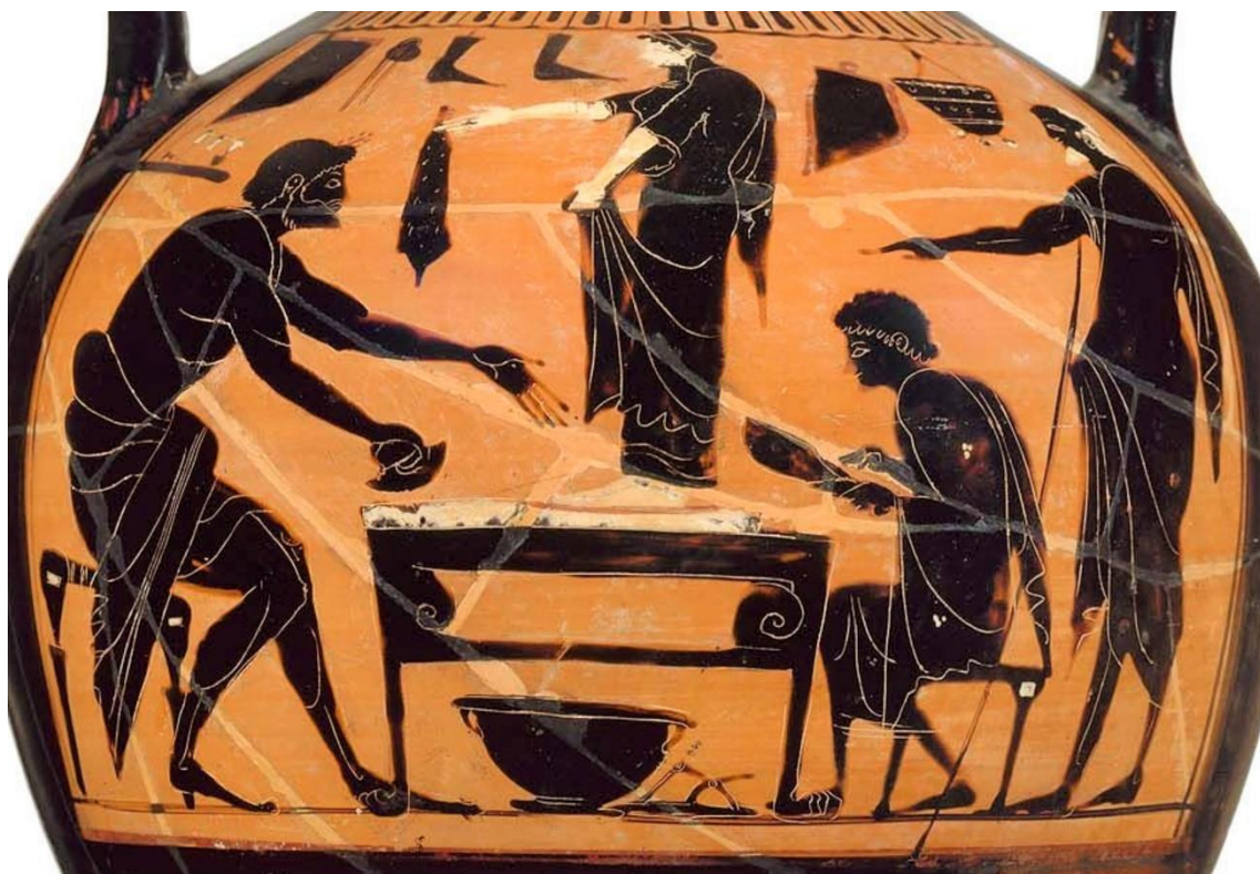
Figura 7. Ánfora ática de figuras negras del ca 550-500 a. C. Museum of Fine Arts de Boston.

Sobre esta diferenciación entre zapatos masculinos o femeninos tenemos constancia en algunas imágenes en la cerámica de figuras negras de procedencia ática. En un ánfora ática de figuras negras del ca 550-500 a. C. encontrada en Orvieto y que hoy se encuentra en el Museum of Fine Arts de Boston (Fig. 7) la escena nos ubica en una zapatería, con los elementos propios de la fábrica: pinzas, una sandalia en el suelo, trozos de cuero en la pared, una esponja y un estante. Es una mujer la que ha ido a hacerse unos zapatos. Está encima de la mesa para tomarse medidas (Kondoleon, Grossmann y Heuser, 2008).