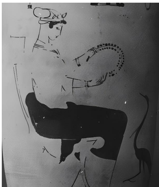
Figura 5. Lécito ático de fondo blanco datado del 475-425 a. C. Pintor de Bowdoin. Museo Archeologico Nazionale de Taranto.

En el caso de los perfumes, conservamos una escena en la que explícitamente se reproduce la venta de este producto realizada por mujeres. Se trata de un pélice ático de figuras rojas datado del 475-425 a. C. atribuido a la Manera del Pintor de Altamura por Beazley (1963) del Historisches Museum de Berne (Fig. 6). En la cara A, una mujer sentada entrega un alabastrón a una muchacha. En la cara B, una mujer recibe el alabastrón de la muchacha (Jucker, 1970; Fantham, 1994; Rotroff y Lambertson, 2006; Osborne, 2011). Es decir, tenemos testimonio manifiesto en la cerámica ática de las mujeres vendiendo perfumes.