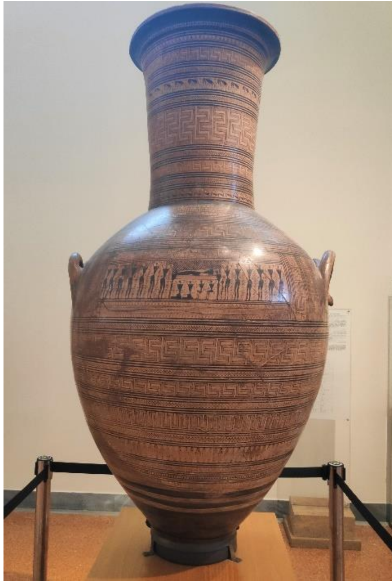
Figura 8. Ánfora del Maestro del Dípilos. Museo Arqueológico Nacional de Atenas.

tumba de una adinerada mujer ateniense, por lo que marcaría a modo de lápida el lugar de reposo de esta poderosa dama. Además, serviría para poder hacerle ofrendas una vez muerta, ya que este vaso no tenía base, así que por arriba se verterían las libaciones u ofrendas (vino, aceites...) que humedecerían la tierra que cubría sus restos.