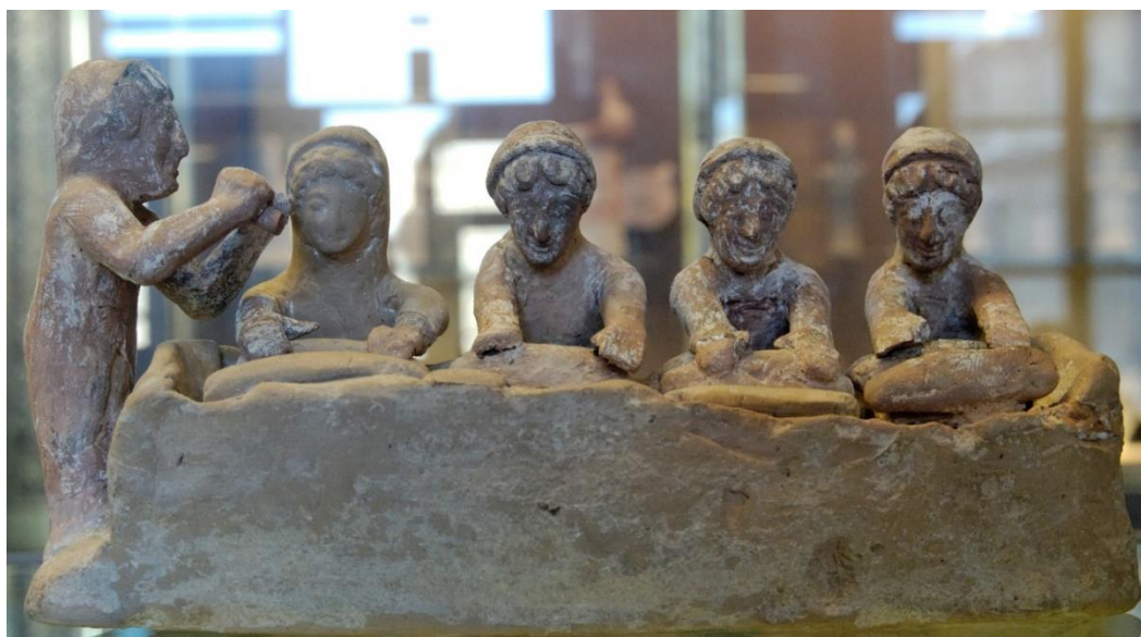
Figura 3. Figura de Tanagra datada del 525-475 a. C. Museo del Louvre.

-Que el trabajo de amasado y horneado era una tarea femenina, a veces grupal, se ve reflejado en otra imagen en la que cuatro mujeres con diferentes peinados amasan en una mesa mientras una quinta toca el aulós (n.º de inventario CA 804). Procede de Tanagra (Beocia), está datada hacia el 500 a. C. y custodiada en el Museo del Louvre (Fig. 3). Aunque estas imágenes no especifican si se trata de fabricación de pan para consumo propio o para la venta, la proliferación de este tipo de imágenes, así como de las inscripciones que se refieren a vendedoras de pan de manera concreta como la mencionada, nos permite afirmar que era un trabajo remunerado realizado en múltiples ocasiones por mujeres y vinculado a la esfera pública como una actividad comercial más. Es decir, si cotejamos las fuentes visuales y las escritas donde se nos habla de las vendedoras de pan con la gran proliferación de mujeres que fabricaban pan, podemos afirmar que este era un trabajo habitual remunerado realizado por mujeres.