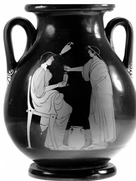
Figura 6. Pélice ático de figuras rojas datado del 475-425 a. C. Manera del Pintor de Altamura. Historisches Museum de Berne.

La actividad comercial de las mujeres de época clásica ligada a la compraventa de productos olorosos está corroborada también en los textos. Tenemos constancia de inscripciones que mencionan a vendedoras de incienso o libanotopólis (IG II5 776 B 4) y de perfumes o muropólis de las cuales se nos dice «ya se está haciendo la mezcla en las crateras y las perfumistas están de pie y en fila» (Aristófanes, Las Asambleístas , 841). Es decir, se habla de perfumistas especificando que son mujeres.