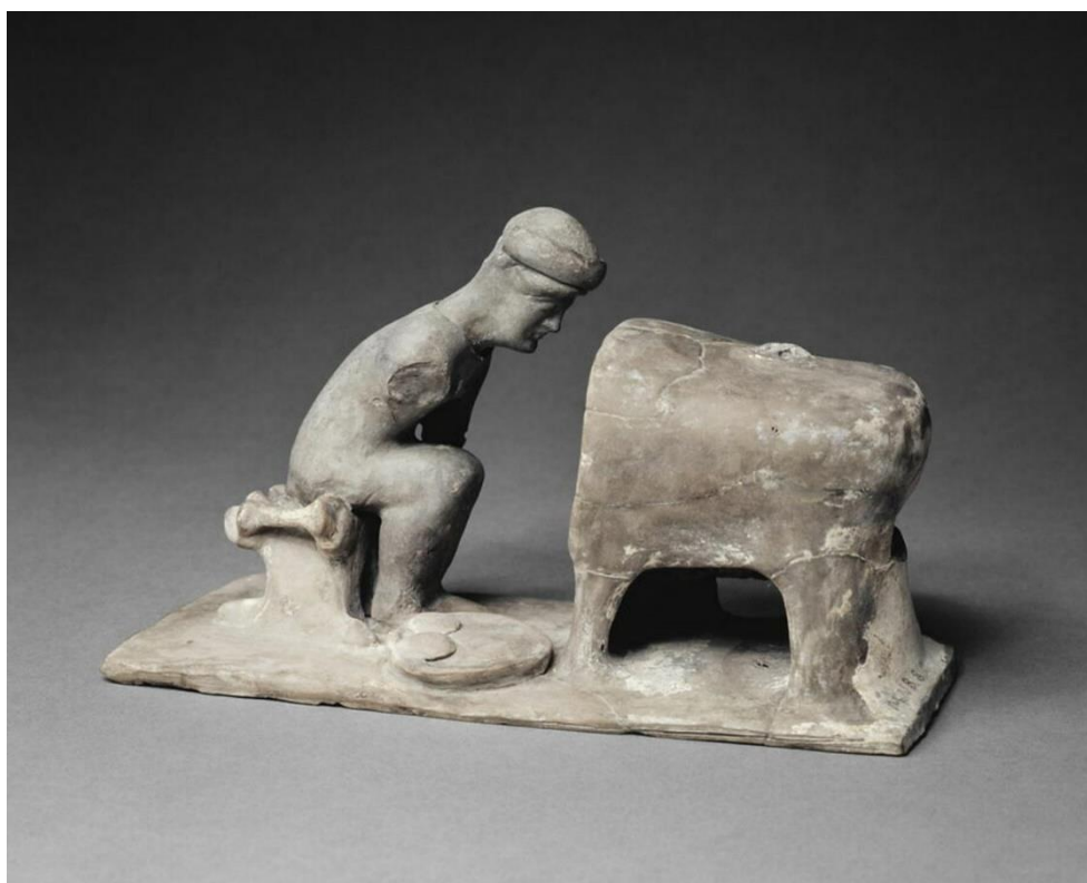
Figura 2. Figura de Tanagra datada del 525-475 a. C. Museo del Louvre © Musée du Louvre.