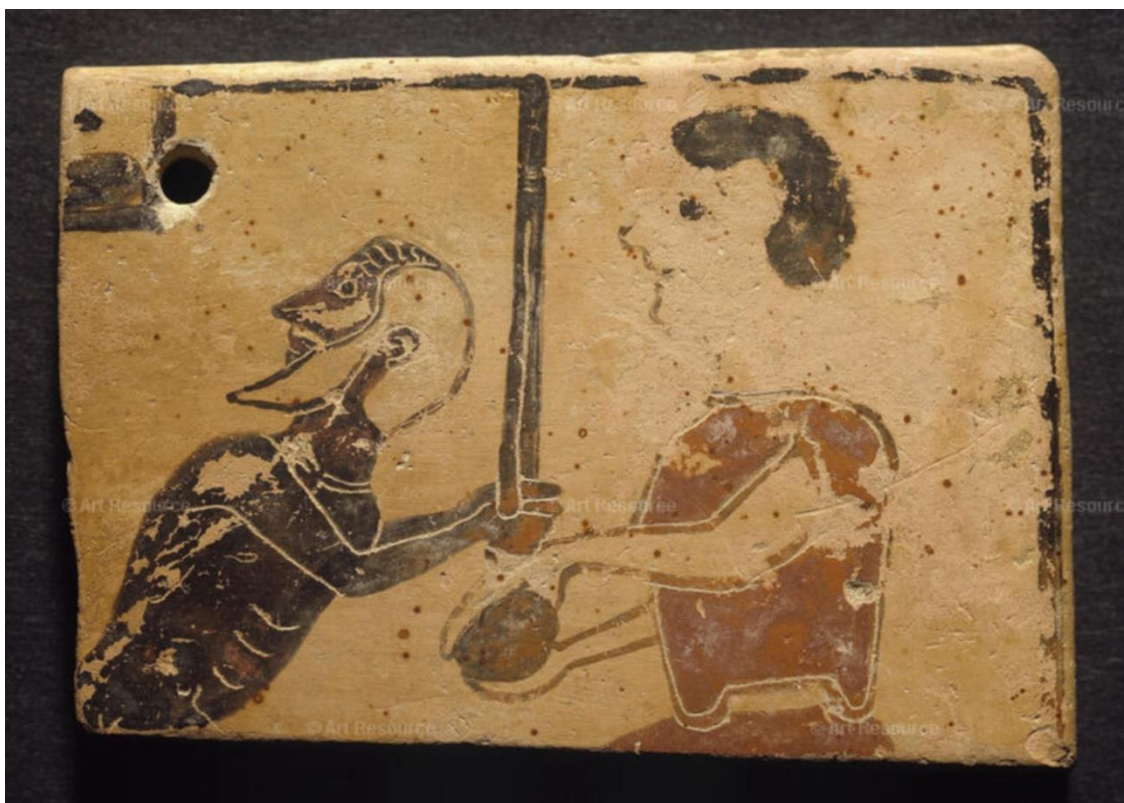
Figura 9. Tabla votiva corintia del siglo VI a. C. Antikensammlung - Staatliche Museen de Berlín.

En la antigua Grecia, además de las artistas mencionadas en el apartado anterior, tenemos constancia de las trabajadoras de este sector. En una tabla votiva corintia del siglo VI a. C. de la Antikensammlung de los Staatliche Museen de Berlín (Zimmer, 1982), por ejemplo, se representa a una anciana alfarera amasando la arcilla (Fig. 9).