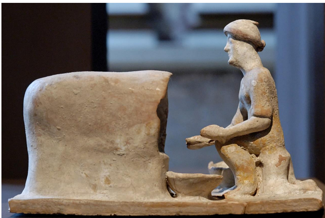
Figura 1. Figura de Tanagra datada del 525-475 a. C. Museo del Louvre