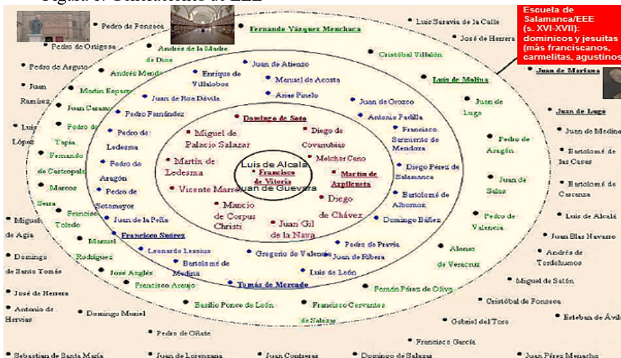
Figura 1: Generaciones de EEE