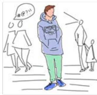
Miedo por posibles agresiones e incomodidad por miradas