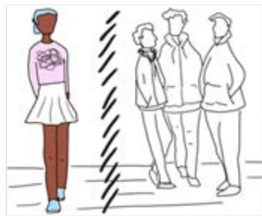
Limitación de la expresión y rechazo por parte de usuarias(os)