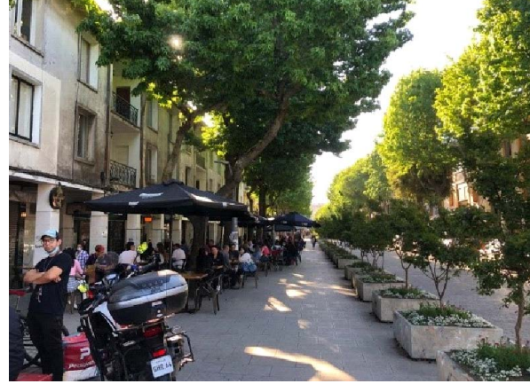
Figura 6 y Figura 7. Plaza Perú, Concepción / Diagonal Pedro Aguirre Cerda, Concepción.