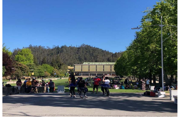
Figura 3. Eje central campus Universidad de Concepción.

Las formas de habitar el espacio están vinculadas a la capacidad de apropiarse de los espacios y a los significados de estos, en el caso específico de las disidencias, esto tiene una estrecha relación con la percepción de seguridad. Otro factor asociado a la forma de habitar son las actividades que se realizan en los espacios, determinados por diversas variables o condiciones como el tiempo de permanencia, la cantidad de participantes, el nivel de relación con los elementos del espacio, entre otras. En los espacios analizados se identificó que la forma de habitar por parte de las disidencias sexuales y de género participantes de la investigación es en un constante estado de alerta y se asocia en gran parte a la percepción de seguridad que se tiene de un lugar, además a determinados espacios, actividades y características positivas y negativas del espacio. (Tabla 2)