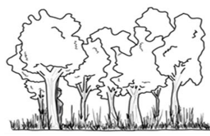
Figura 9. Priorización del automóvil y falta de iluminación. Fuente: Elaboración propia de las autoras. Figura 10: Puntos ciegos en los recorridos y Vegetación descuidada. Fuente: Elaboración propia de las autoras.