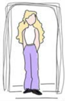
Limitar el horario de uso y sentirse acorralada