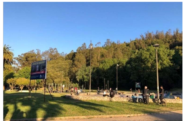
Figura 4 y Figura 5. Plaza de la Independencia, Concepción / Sector de calistenia, parque Ecuador, Concepción.