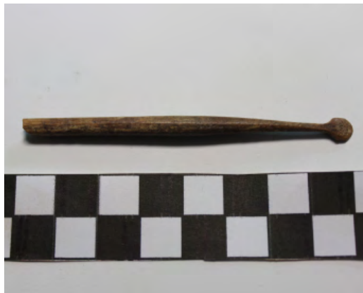
10. Espátula de hueso.