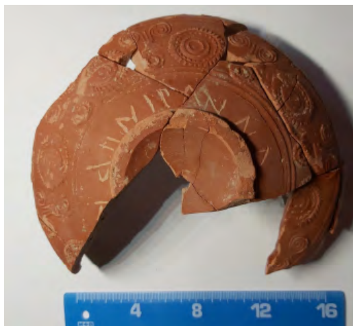
8. Cerámica con graffiti.