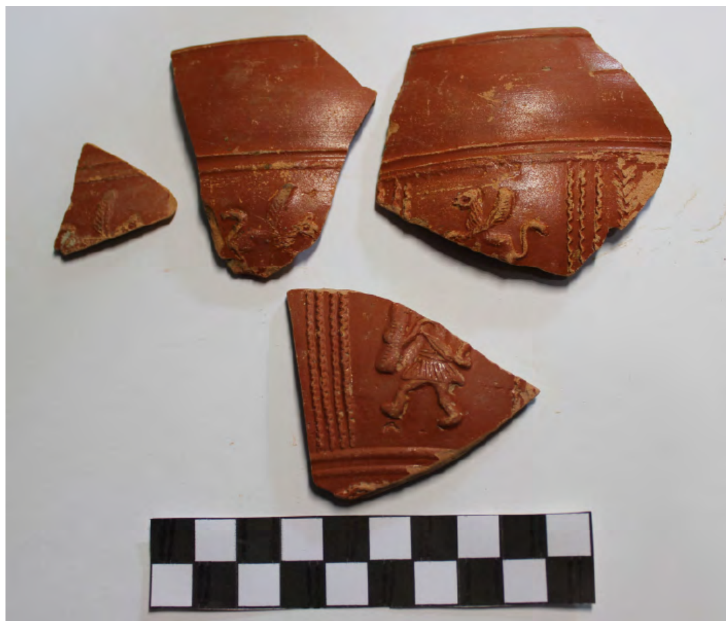
3. TSH con grifos y figura humana.

fragmento de lucerna con engobe gris. Los números de inventario del 1453 al 1479 corresponden con fragmentos de TSH, la mayoría de formas reconocibles son Drag. 37a, Drag. 35, y Drag. 15/17. Entre las decoraciones reseñables se encuentra un cuenco de forma Drag. 37 –número 1459– con dibujo de ave en el interior de un círculo, y el número 1465 con una escena de animales salvajes. Los números 1480 al 1527 pertenecen a fragmentos de piezas de paredes finas y engobadas, siendo la única forma reconocible un fragmento de vaso de forma Aguarod III/Unzu 8. Las piezas engobadas son en su mayoría procedentes del alfar de Turiaso [fig. 4].