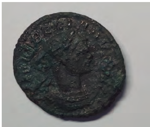
6. Antoniniano del emperador Aureliano.