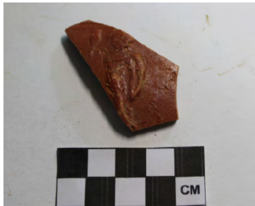
11. Personaje con posible antorcha.

domésticos se mantuvieron hasta finales del siglo II d. C. momento en el que se elevó el nivel de suelo del espacio desde el muro UE 8 hacia el sur, y en el que se compartimentó más el espacio, con la construcción del muro UE 7, paralelo al anterior. Entre estos dos muros, se dispone el espacio «e», que presenta sobre el terreno natural dos estratos UE 21 y 22 con materiales altoimperiales, y un relleno de amortización en el último cuarto del siglo III y nivelación del espacio UE 6 similar a los depósitos de nivelación UE 15 que rellenan el resto de espacios habitacionales.