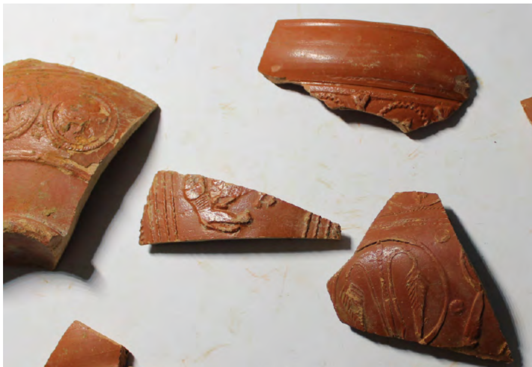
4. Escena con animales salvajes y otras piezas decoradas.

Por último, los niveles arqueológicos que nos informan de la amortización de las estructuras de vivienda para la construcción de un nuevo edificio público en ese espacio están formados por los depósitos UE 6 y UE 15 («a», «b», «c» y «d»).