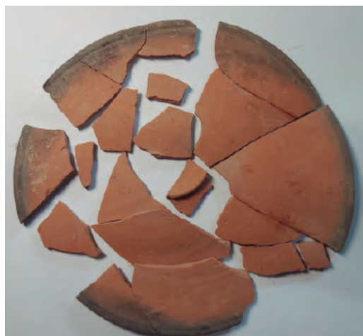
9. Tapadera de cerámica de cocina africana.

número de inventario 1095 se corresponde con una espátula realizada en hueso, con vástago cilíndrico y punta circular plana. Estas espátulas suelen ser usadas para aplicar cosméticos o ungüentos [fig. 10]. 9 El número 1096 pertenece a un pondus o pesa de telar. Es la única pieza que indica una actividad de este tipo localizada en toda la excavación.