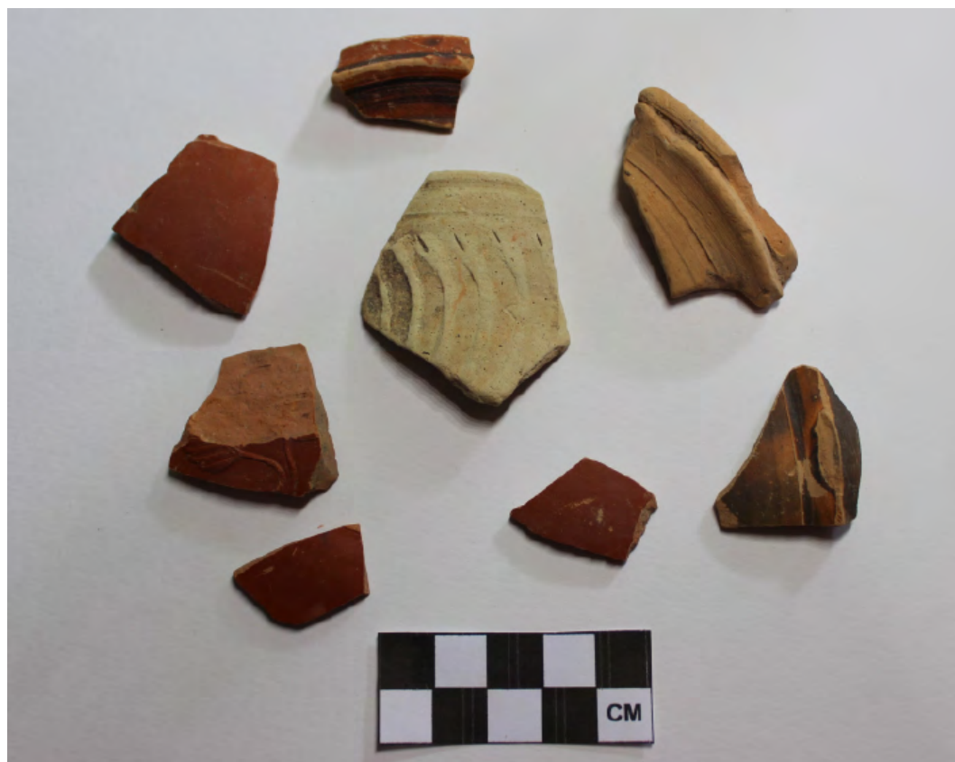
2. Materiales de la UE 24.

El depósito de nivelación de suelos en el espacio «e», está formado por los estratos UE 21 y UE 22.