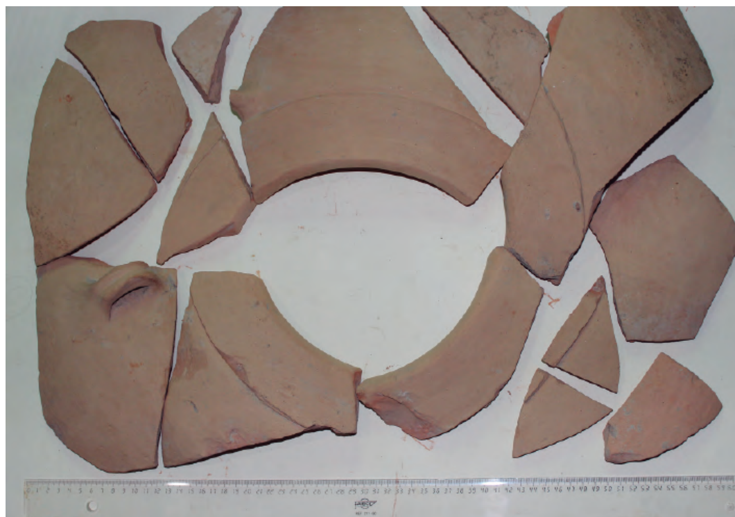
5. Tinaja de UE 15 a.

Aguarod III/Unzu 8 o vasos de forma Aguarod I/Unzu 3. El resto de las piezas son fragmentos de cerámica común de mesa –números 372 al 607–, el borde y un trozo de la pared de una tinaja de almacenaje con pasta fina, restos de ánforas de formas Dres. 2/4 y Dres. 7/11, partes de dolia, cerámica de cocina, elementos constructivos, fragmentos de hierro y de huesos de animales [fig. 5].