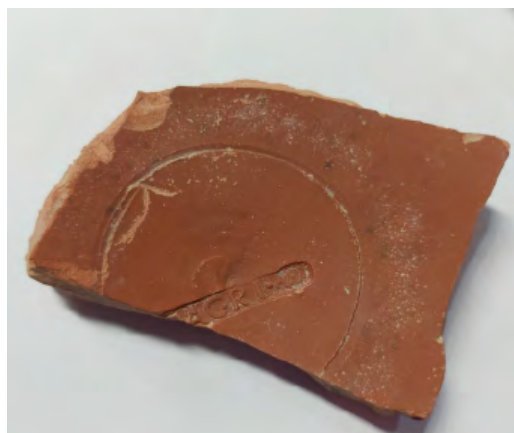
7. Sello de alfarero.

La pieza inventariada con el número 579 se corresponde con dieciocho fragmentos de un cuenco de posible forma Drag. 37 con decoración de frisos, el superior con leonas separadas por banda vertical de circulitos, y el inferior con círculos concéntricos. La peculiaridad de esta pieza es que tiene un grafiti junto a su pie anular, con letras como sigue: V N NVJIN II P I [fig. 8].