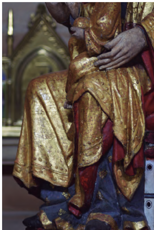
18. Antigua titular de la catedral de N a S a de la Huerta, posteriormente N a S a del Rosario. Detalles del dorado y la policromía. Catedral de Tarazona.

Su datación se debe situar en las primeras décadas del siglo XIV. Las obras de la cabecera de la catedral ya estarían completadas y queda constancia de la actuación de los prelados de aquel periodo como bienhechores de la seo. Aunque no es un indicio definitivo, la conservación del magnífico sepulcro de