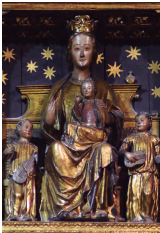
8. N a S a de los Ángeles. Parroquia de San Pedro de Zuera.