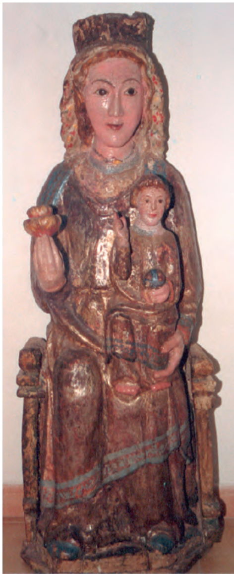
32. N o S a del Arco. Parroquia de Mianos.

de un arco que la cobija, pero actualmente se custodia para su mayor seguridad y conservación en el ayuntamiento de la población 147 [fig. 32].