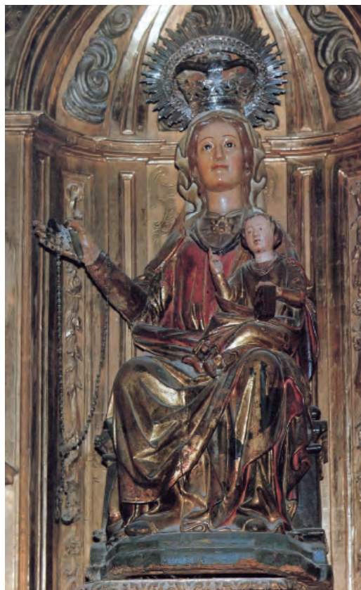
5. Virgen con el Niño. Parroquia de Santiago de Puente la Reina.

por la mayor angulosidad de los pliegues que se forman en las vestiduras, siendo este rasgo más evidente en las prendas de María, en el velo mostrando un ritmo zigzagueante, y en el manto adoptando formas en V al caer sobre sus piernas; y, finalmente, por el tipo de atributos que muestran, la Madre, una flor, y el Hijo, un libro cerrado. En este grupo Fernández-Ladreda incluye las tallas de Los Arcos, Miranda de Arga, Arizaleta, Fitero, Berbinzana, Mendigorriá, Artaza y Ubago. 44