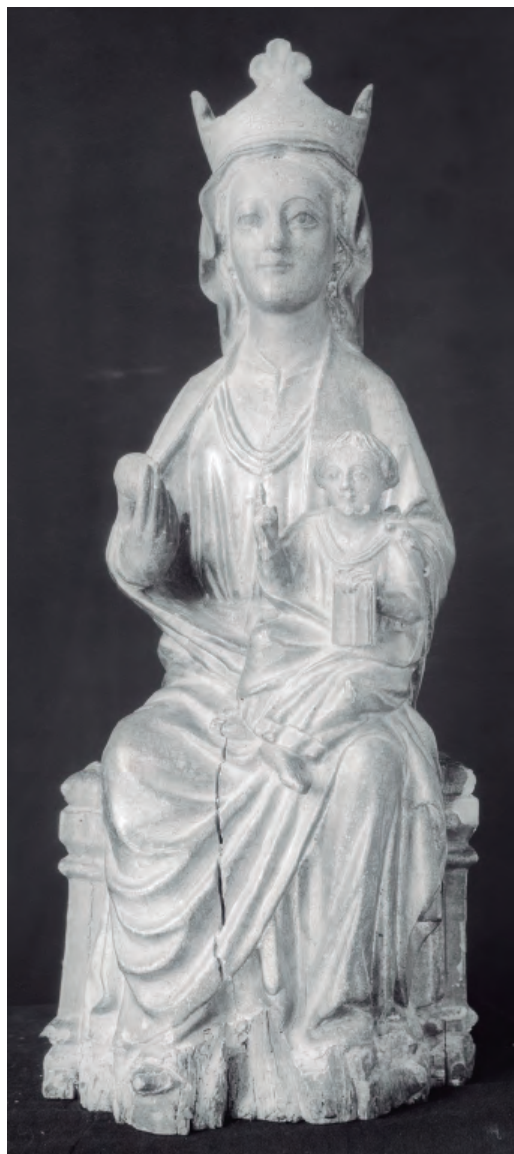
26. Virgen con el Niño, desaparecida. Villarroya de la Sierra.