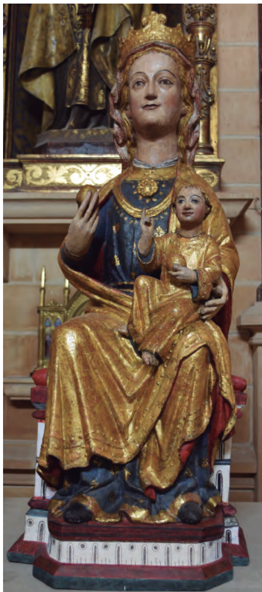
1. Antigua titular de la catedral de N a S a de la Huerta, posteriormente Nuestra Señora del Rosario. Catedral de Tarazona.

Península que abarca Cantabria, Castilla-León, La Rioja, País Vasco, Navarra, Aragón, Cataluña y Madrid, a lo largo de un periodo que se extiende desde el último tercio del siglo XIII hasta mediados del XIV. Su origen se localiza en el foco burgalés desde el que se propagó