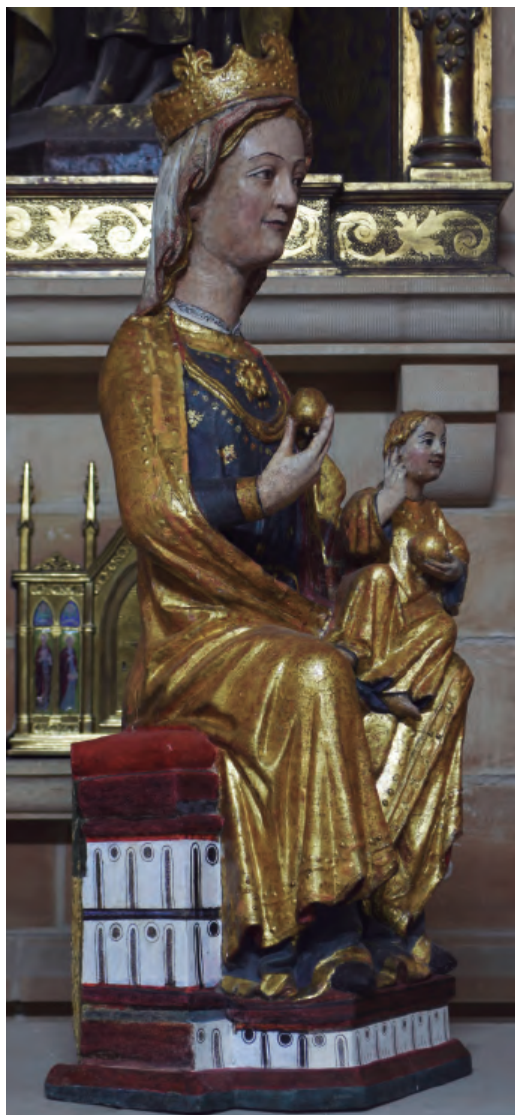
14. Antigua titular de la catedral de N a S a de la Huerta, posteriormente N a S a del Rosario. Vista lateral. Catedral de Tarazona.