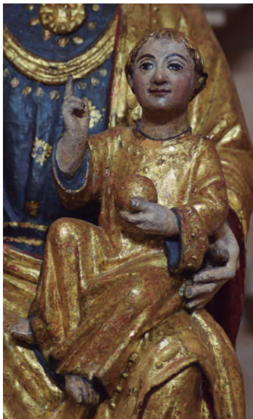
17. Antigua titular de la catedral de N ra S a de la Huerta, posteriormente N ra S a del Rosario. Detalle del Niño. Catedral de Tarazona.

ciones hay que añadir el plegado suave que muestra la túnica de Jesús se aleja las formas angulosas de las piezas más antiguas del tipo.