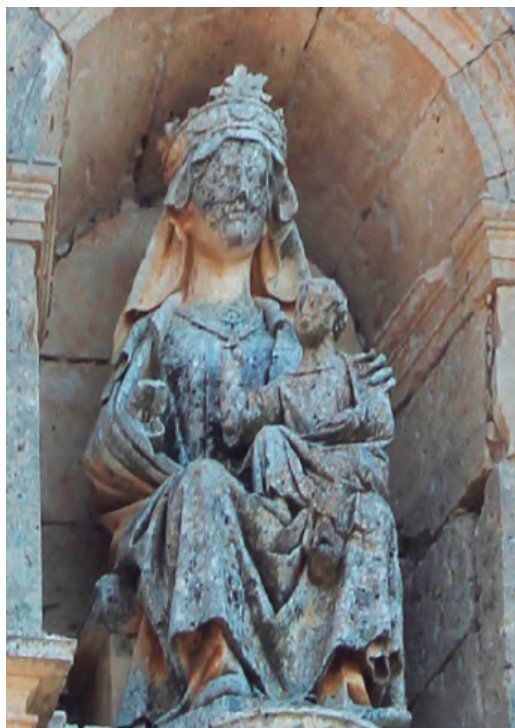
3. Virgen con el Niño de la fachada meridional. Iglesia de N ra S a del Manzano de Castrojeriz.

llaría entre la estatuaria de las desaparecidas portadas de la fachada occidental, que estarían terminadas en 1257. El programa iconográfico de éstas estaba dedicado a la Virgen y, por lo tanto, allí pudo encontrarse la imagen mariana prototipo, si bien apunta que es una hipótesis que nunca se podrá demostrar por su desaparición. 27 Por lo tanto, reconoce que la Virgen de la Alegría es la más antigua de las conservadas, fechada en los años finales de la década de 1360. En un artículo posterior, Martínez Martínez no descarta que se pudiera hallar en la escultura monumental burgalesa, si bien acepta como más probable que el tipo se originara a partir de una imagen