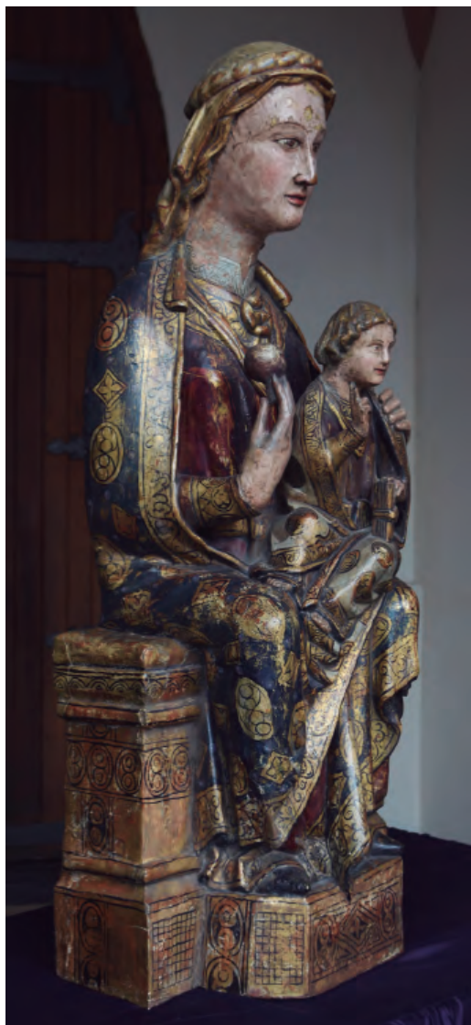
12. Virgen con el Niño, conocida como N a S a de las Nieves. Vista lateral. Parroquia de Santa María de Tauste.