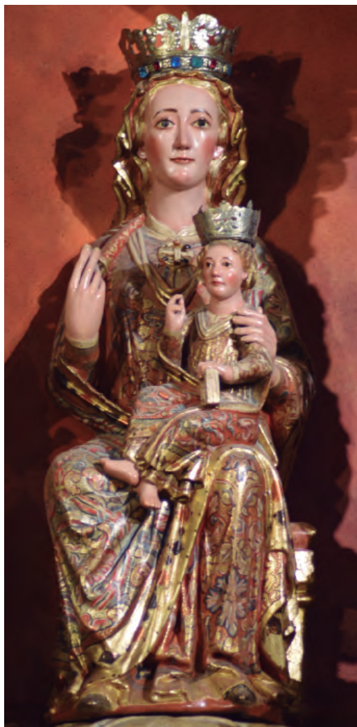
21. Santa María de la Corona. Parroquia de Santa María de la Corona de Ejea de los Caballeros.

Ejea de los Caballeros , Pamplona, Imprenta de Benito Cosculluela, 1790 (edición facsímil Ejea de los Caballeros, Centro de Estudios de las Cinco Villas, 1985), p. 104; Francisco ABBAD RÍOS, Catálogo monumental... , ob. cit., pp. 550-551; Domingo J. BUESA CONDE, La Virgen en el Reino de Aragón... , ob. cit., pp. 111 y 125-130; y Domingo J. BUESA CONDE, «Nuestra Señora de la Corona», en Speculum... , pp. 148-149; y José Antonio ALMERÍA, «Ejea de los Caballeros», en Carmen Rábanos Faci (dir.), El patrimonio artístico de la Comarca... , pp. 117 y 118.