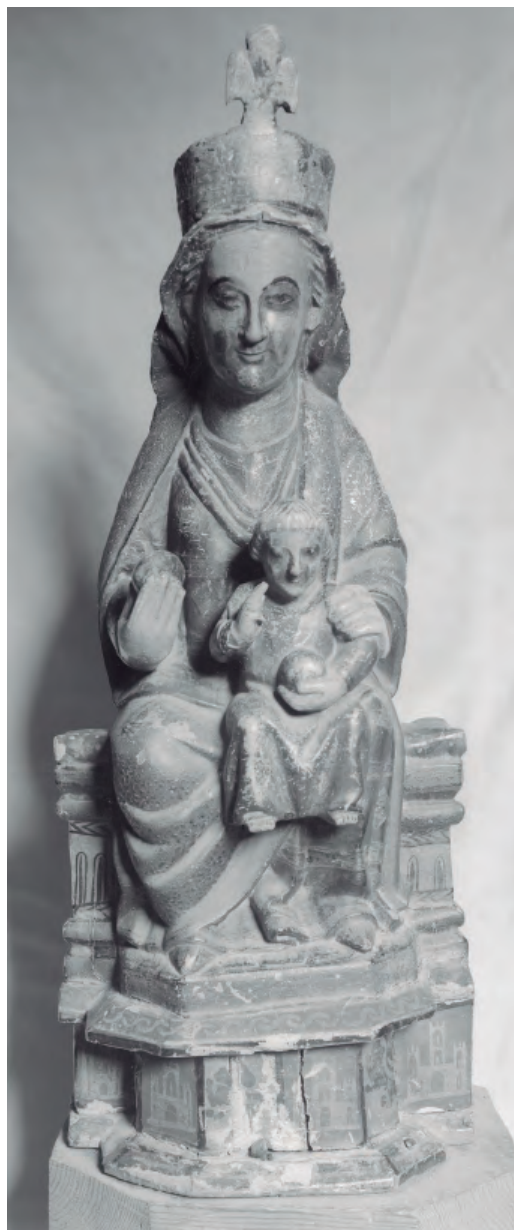
30. N o S a del Capítulo, antes de ser robada en 1975. Parroquia de la Asunción de Trasobares. Foto © 2019 Institut Amatller d'Art Hispànic, Mas C-97369.

En este caso, podemos retomar una hipótesis planteada por Fernández-Ladreda que ilustra de forma ejemplar cómo pudo ser una de las vías a través de las cuales se produjo la difusión de este tipo. Según esta profesora, la primitiva titular del monasterio de La Oliva pudo servir de modelo para otras piezas conservadas en lugares vinculados en cierta medida con la institución, si bien esta teoría es imposible de demostrar ya que aquella imagen desapareció, no es inverosímil. Las tallas que según ella pudieron estar inspiradas en aquella obra son la Virgen con el Niño conservada en la parroquia de Mélida, localidad situada en las inmediaciones de la abadía, 136 y la titular del monasterio de Tulebras que, como aquel, estaba consagrado a la Orden Cisterciense. 137