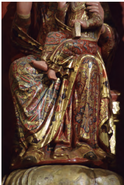
24. Santa María de la Corona. Detalle de la policromía. Parroquia de Santa María de la Corona de Ejea de los Caballeros.

Destaca el cuidado de ciertos detalles, como el broche redondo adornado con detalles geométricos con el que se abrocha el cuello de la túnica de la Virgen, y la presencia de las tres cuerdas del fiador del manto por encima del hombro. Respecto al estilo, la figura tiene un canon esbelto, los rostros ovalados y alargados muestran una gran belleza, y los pliegues, que en las imágenes más antiguas del tipo son angulosos, muestran la tendencia hacia la representación de formas suavizadas, propias ya de su estilo plenamente gótico.