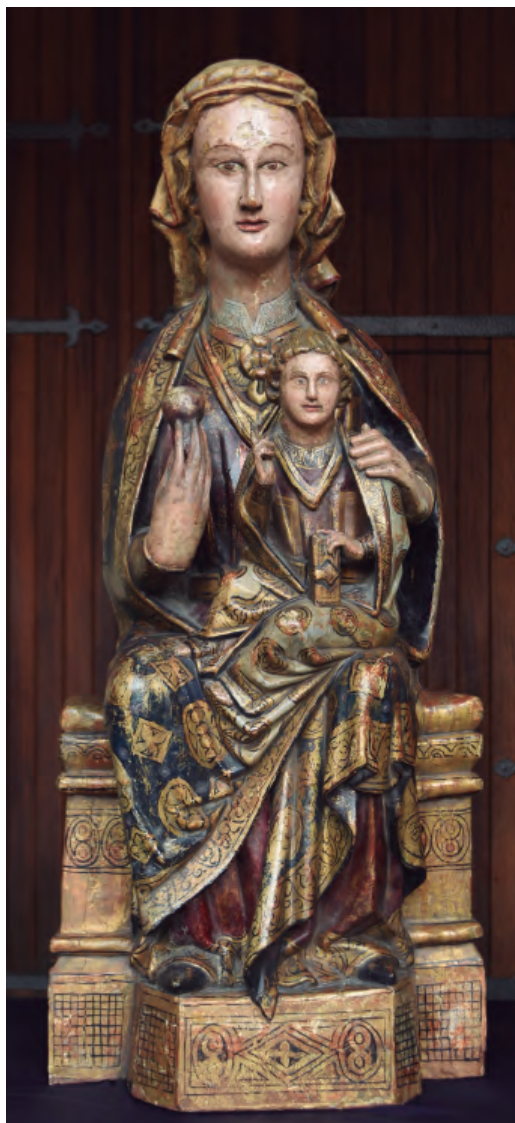
11. Virgen con el Niño, conocida como N a S a de las Nieves. Parroquia de Santa María de Tauste.

Nuestra Señora de las Nieves. 74 Sin embargo, no hemos encontrado noticias que relacionen el culto a la Virgen bajo