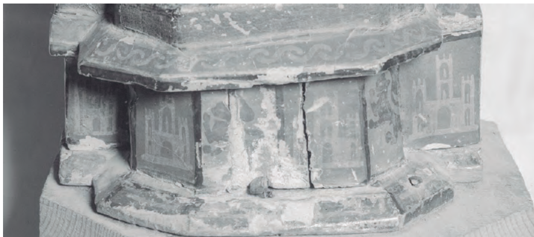
31. Nº Sª del Capítulo, antes de ser robada en 1975. Detalles heráldicos con castillos y leones en su primitivo pedestal. Parroquia de la Asunción de Trasobares.

de los modelos artísticos tendría como línea conductora la relación de las obras con una orden religiosa, en este caso el Císter. A pesar de su estilo más popular y que cada una de estas piezas tiene sus propias particularidades, es innegable que las tres obedecen a una misma corriente estética y sus autores copiaron unos modelos semejantes. En cualquier caso, representan la pervivencia del tipo en fechas avanzadas del siglo XIV, y en estos ejemplos las vías de propagación no pueden ser más ilustrativas.