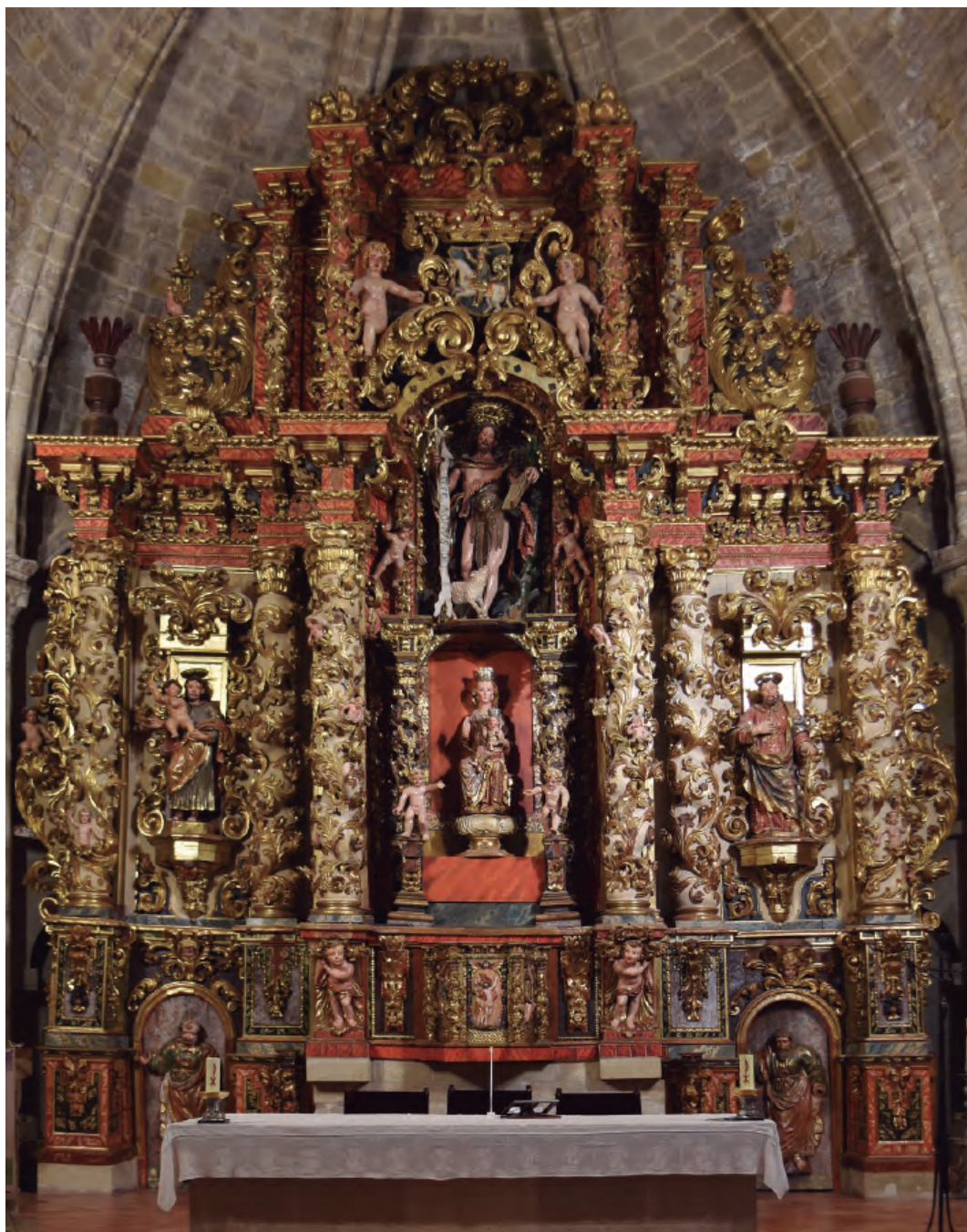
20. Retablo mayor. Parroquia de Santa María de la Corona de Ejea de los Caballeros.