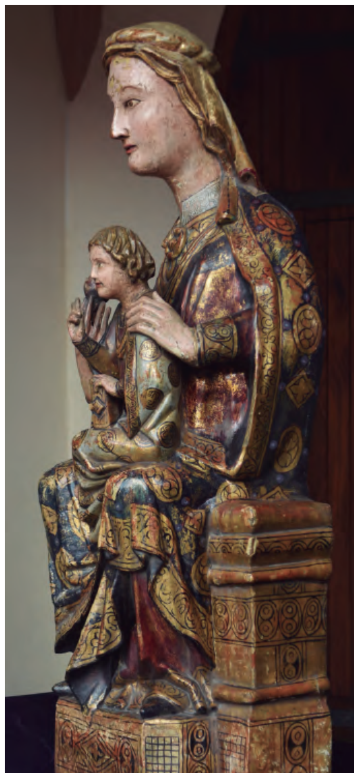
13. Virgen con el Niño, conocida como N a S a de las Nieves. Vista lateral. Parroquia de Santa María de Tauste.

mantos están ornamentados con motivos geométricos circulares y romboidales dorados, que se repiten en las orlas que decoran los extremos de las túnicas y en el trono de María. Llama la atención el dibujo del cuello de la camisa inferior de la Virgen, a base de entrelazados con reminiscencias mudéjares. La incorrección en la disposición del brazo