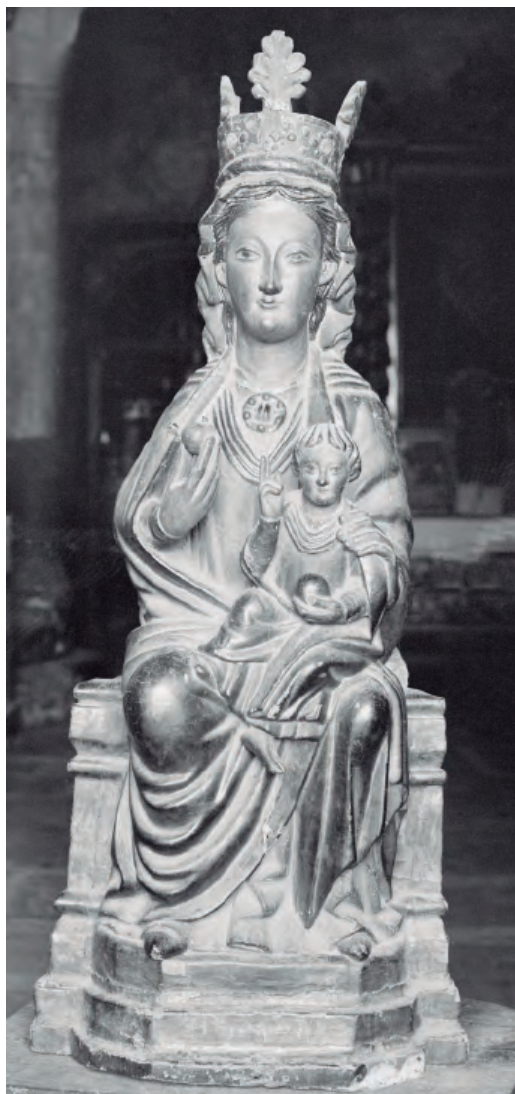
27. Nuestra Señora la Blanca, desaparecida. Berbegal.