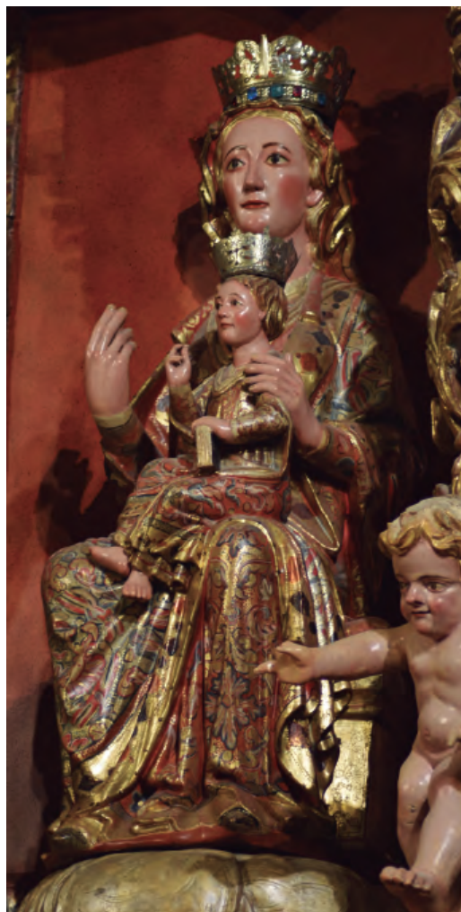
23. Santa María de la Corona. Vista lateral. Parroquia de Santa María de la Corona de Ejea de los Caballeros.

nalmente no lucía este atributo, el Niño también fue coronado. Es probable que el encargado de aplicar su nueva policromía fuese el citado Juan de Rospión y que realizara dicho trabajo entre 1730 y 1733. Entonces se renovaron sus carnaciones y se decoró la superficie de sus vestiduras con pan de oro, esgrafiados y estofados que imitan los motivos florales y vegetales de los estampados de los tejidos de la época [fig. 24]. Estos motivos cubren también el dorso de la imagen,