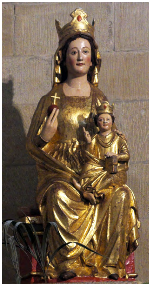
25. Virgen con el Niño. Parroquia de Santa María de Uncastillo.

La imagen presidió el altar mayor desde el siglo XIV hasta el siglo XVII, cuando se instaló en este espacio el retablo dedicado a Nuestra Señora de la Asunción. Los lienzos que componen este mueble fueron encargados al pintor Jusepe Martínez y la mazonería fue realizada por Juan Fernández. El conjunto estaba terminado y montado en 1649. 110 El dorado la máquina no se aplicó hasta 1667 y 1668, haciéndose cargo de esta labor Francisco Navarro, natural de Borja. 111 Una década después, en 1679 él mismo doró la imagen gótica. 112 Desconocemos cuál sería la ubicación de ésta durante el siglo XVII y buena parte del XVIII, probablemente a un lado del retablo. La Virgen se colocó sobre el sagrario dieciochesco que sustituyó al realizado por Jusepe Martínez y Juan Fernández. En 1998 el retablo fue desmontado para llevar a cabo su restauración, trasladándose posteriormente a la iglesia de San Juan, en la misma localidad de Uncastillo, donde se encuentra