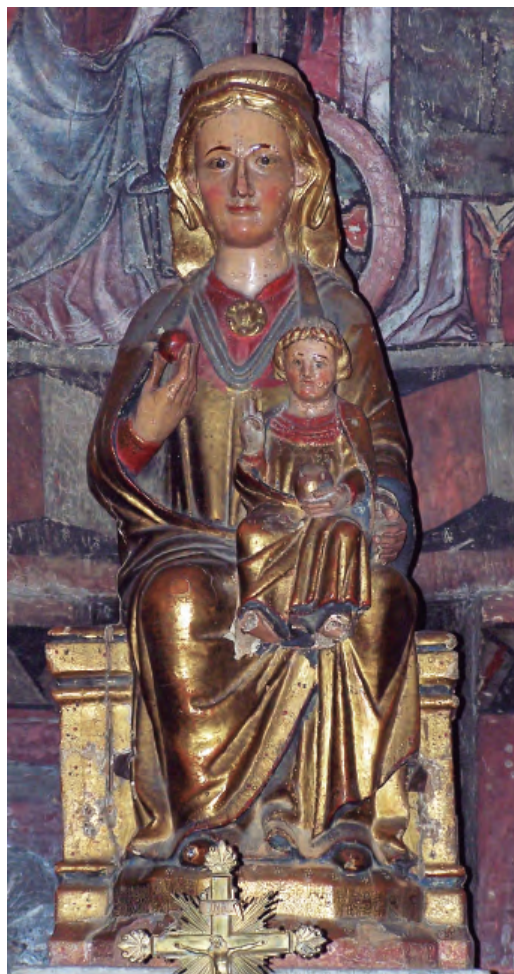
28. Virgen del Perdón . Parroquia de San Esteban de Sos del Rey Católico.

Un tratamiento similar del plegado y la misma disposición de las figuras lo encontramos en la imagen navarra de Nuestra Señora del Puy de Estella, incluida dentro del grupo tercero del tipo, caracterizado además de por la disposición del Niño, totalmente frontal, con los pies colgando, así como por la sencillez de los pliegues y la suavidad de las formas. Otro aspecto que pone en contacto ambas piezas es el hecho de que la escultura estellesa esté recubierta por placas de plata y que la de Sos del