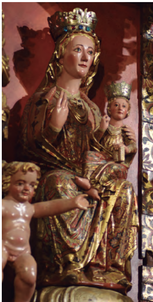
22. Santa María de la Corona. Vista lateral. Parroquia de Santa María de la Corona de Ejea de los Caballeros.