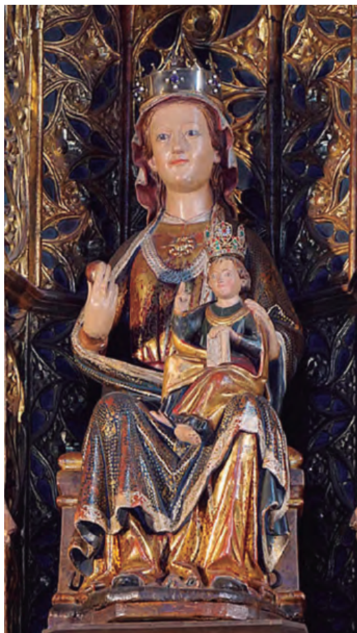
6. Virgen con el Niño. Parroquia de Santa María de Olite.

El tercer grupo se diferencia principalmente en que la Madre no apoya la mano sobre el hombro del Niño sino que lo sujeta por su parte inferior. A él pertenecen las vírgenes del Puy de Estella, de Santa María de Jus del castillo de Estella, Bargota, Orísoain, Eriete y Mérida. 46