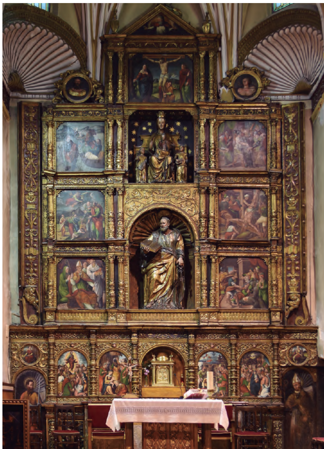
7. Retablo mayor. Parroquia de San Pedro de Zuera.