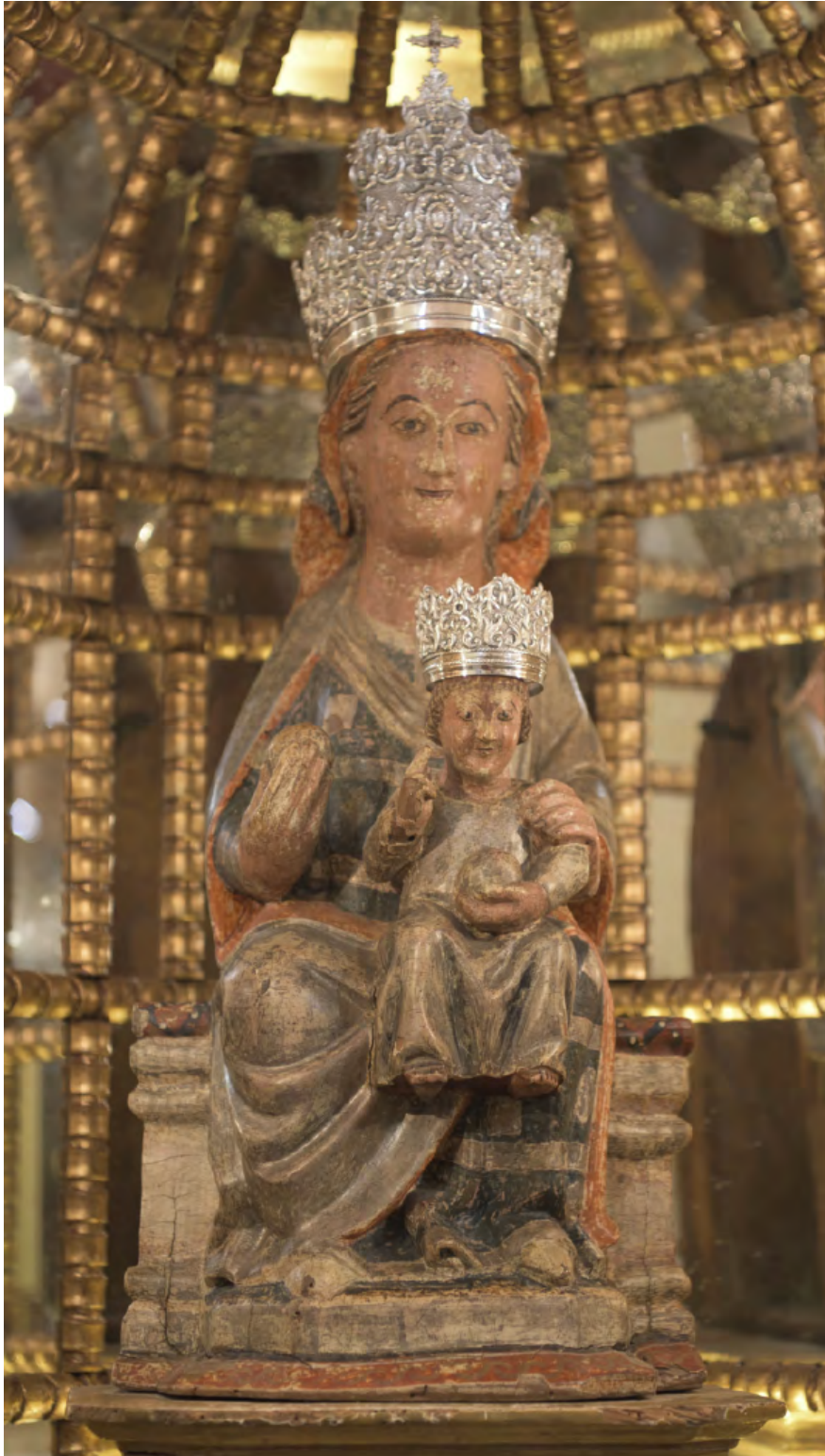
29. N o S a del Capítulo. Parroquia de la Asunción de Trasobares.