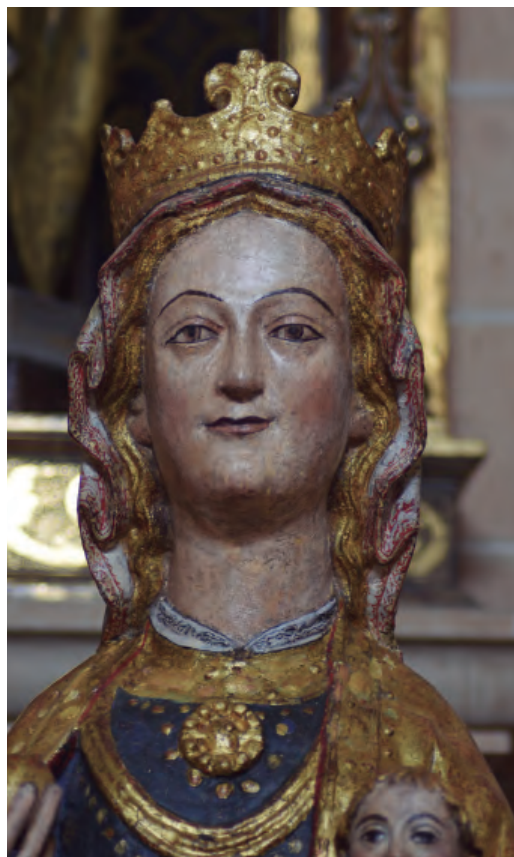
16. Antigua titular de la catedral de N ª S ª de la Huerta, posteriormente N ª S ª del Rosario. Detalle del rostro de la Virgen. Catedral de Tarazona.

Dos aspectos que muestra la figura de Jesús son indicios de una cronología avanzada. En primer lugar, su indumentaria se reduce a una holgada túnica,