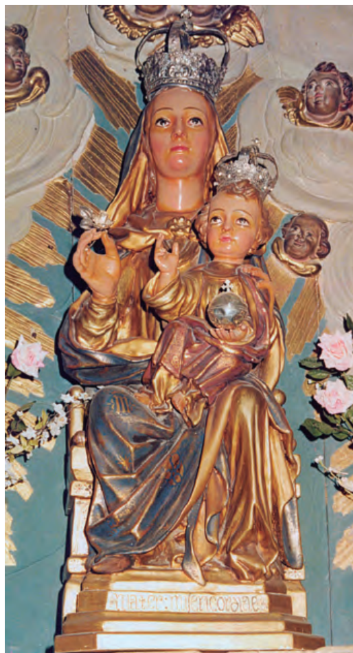
33. N a S a de Misericordia. Santuario de Misericordia de Borja.

Probablemente fue la titular de Santa María, si bien se desconoce cuándo se retiró del culto, pero es posible que esto sucediera en una fecha no muy lejana a su realización, en el primer cuarto del