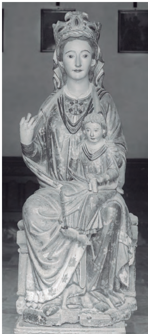
19. Virgen con el Niño, desaparecida durante la Guerra Civil. Yéqueda

A pesar de que el autor no cita el origen de la fuente de la que ha tomado este relato, lo más interesante es la alusión al origen foráneo de la escultura. A pesar de que la idea de la procedencia del país vecino de esta tipología ha sido rechazada al demostrarse que surgió en territorio español, su evidente relación