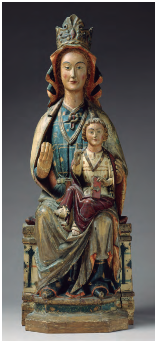
2. Virgen con el Niño , Metropolitan Museum of Art, Nueva York.

y cita a la Virgen de la Sede de Sevilla como representativa de la enorme importancia del tipo. 5 Randall en un estudio monográfico sobre una Virgen con