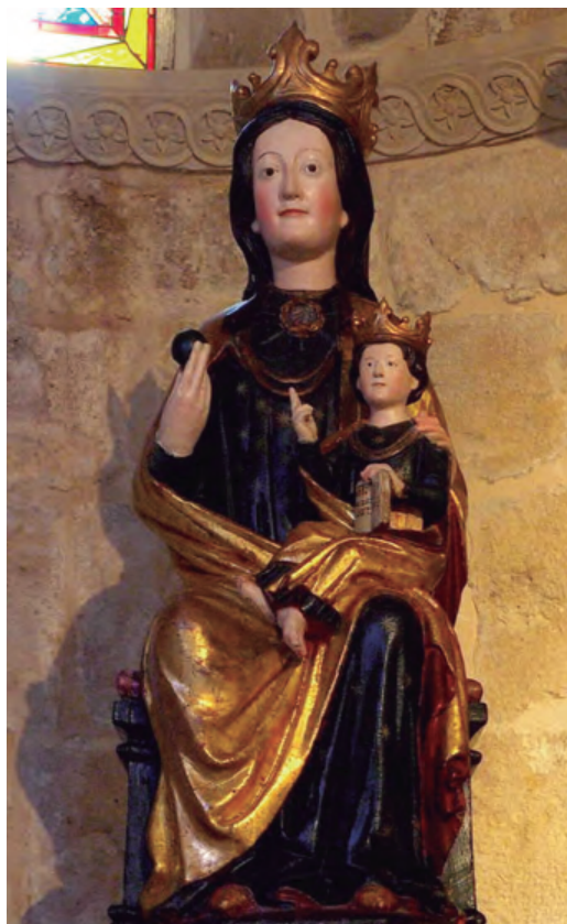
4. Virgen de la O. Parroquia de San Pedro de la Rúa de Estella.