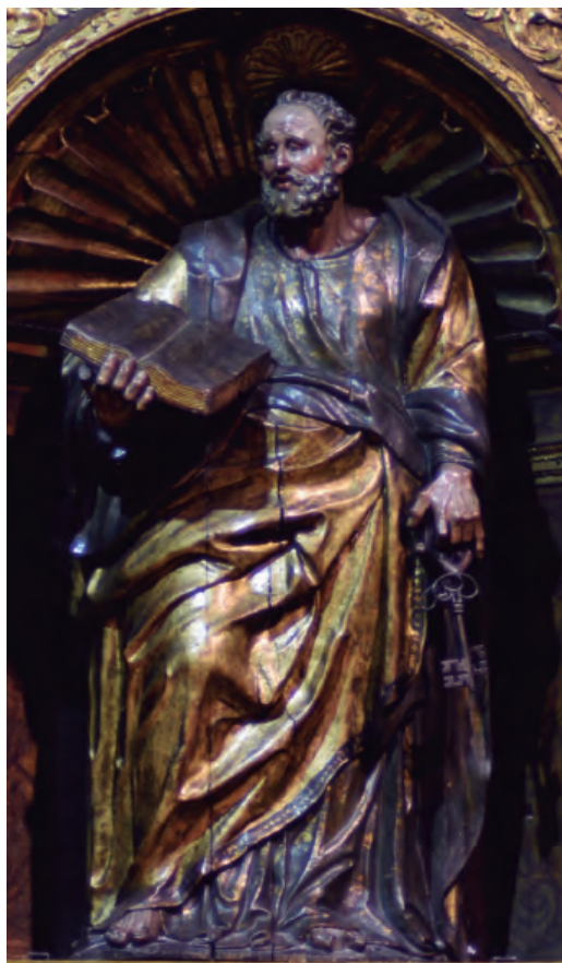
10. San Pedro apóstol, imagen titular del retablo mayor. Parroquia de San Pedro de Zuera.

La talla gótica de la Virgen con el Niño fue remodelada en torno a aquellas fechas para reubicarla en el retablo. Se alteraron algunas zonas y su policromía fue completamente renovada. En esta intervención participaría alguno de los pintores o doradores citados, tal vez Sancho de Villanueva, el mismo que se hizo cargo del dorado y esgrafiado de la talla de San Pedro que preside el conjunto [fig. 10], ya que se pueden comprobar las semejanzas en el estilo de los motivos ornamentales [fig. 9].