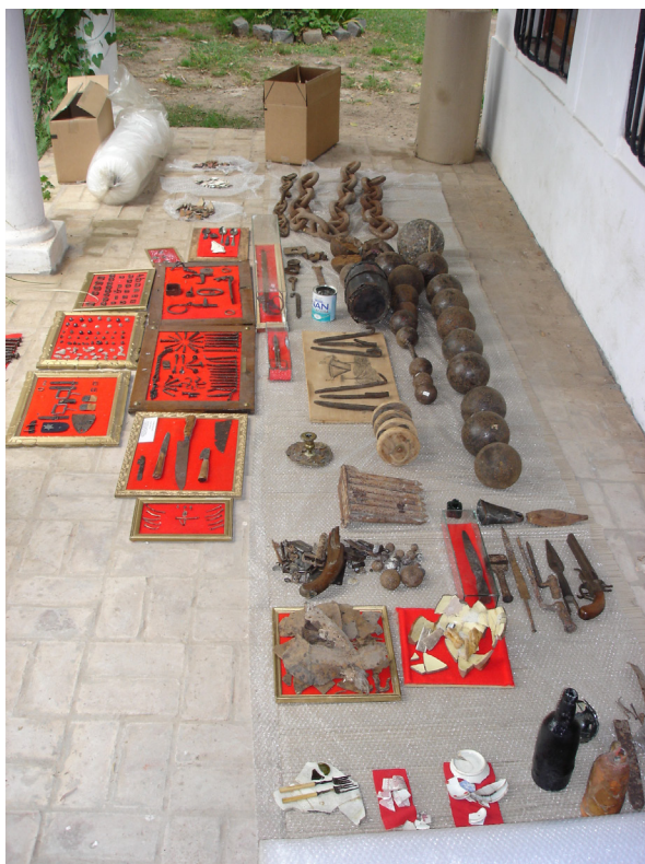
Figura 3. Muestra de materiales incautados a un coleccionista en Baradero. Una gran parte de ellos corresponde a la batalla de la Vuelta de Obligado. 2011