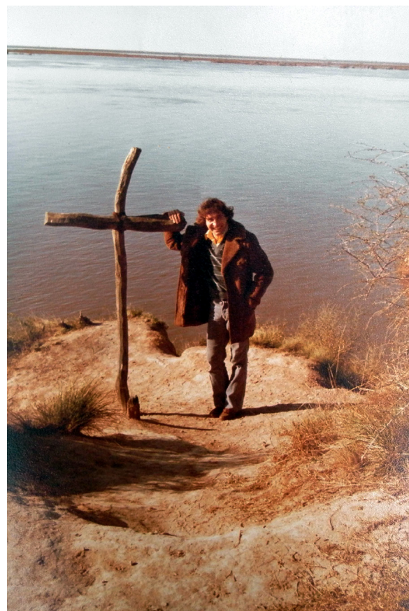
Figura 1. Cruz de ñandubay en una barranca de Vuelta de Obligado, circa 1975.