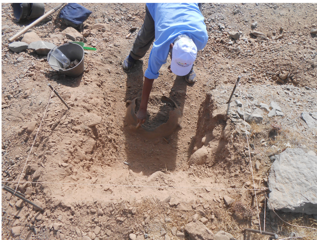
Figura 2. Tareas de rescate arqueológico en el sitio.

Por el contrario, en los últimos tiempos este hilo de acciones centrado en “excavar + rescatar + conservar = valorar”, fue ampliamente criticada por los otros interlocutores que conformaron ese espacio de diálogo. Las reivindicaciones de organizaciones de pueblos