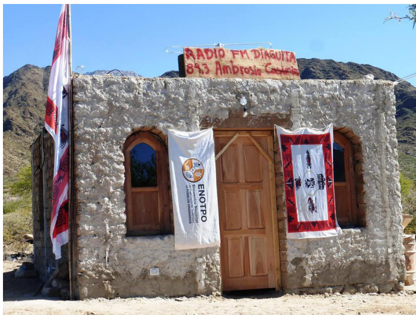
Figura 3. Radio Comunitaria “Ambrosio Casimiro” de la Comunidad de La Aguada (Cachi).

originarios, como es el caso de la Comunidad Diaguita de La Aguada, cuestionan las maneras en que el Museo Arqueológico de Cachi procedió al crear sus colecciones trasladando muchas de las piezas provenientes de sus antiguales al poblado de Cachi. Desde un contexto de enunciación distinto, atravesado por las luchas orientadas a conseguir la tierra, los integrantes de la comunidad no tenían la necesidad de excavar dicha vasija puesto que la misma ya había sido identificada un año antes y luego del plenario en asamblea, se resolvió no extraerla tal como se comentara previamente. Sin embargo, la implementación de la obra de agua presentó un nuevo desafío haciendo evidente esas distintas concepciones respecto a la materialidad. La decisión tomada fue excavar y recuperar la vasija con el compromiso de que la misma se exhibiera en un lugar de significativa importancia como lo es la radio comunitaria “Ambrosio Casimiro”. A partir de esta situación entonces, podría pensarse que la ecuación fundante consagrada en el espíritu del Museo Arqueológico de Cachi tomó un significado distinto. Esas acciones de “excavar + rescatar+ conservar=valorar” fueron re-significadas desde un ámbito diferente en el marco de un diálogo cultural,