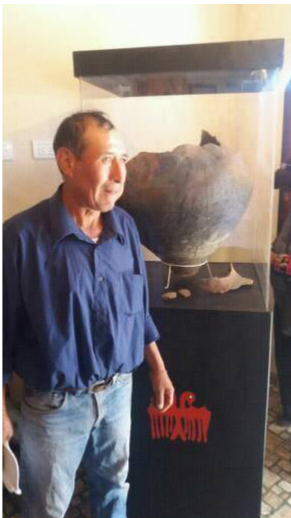
Figura 5. Delegado de la Comunidad Diaguita Calchaquí junto a la vasija exhibida en la radio.

distinta de exhibir lo material. En este caso la vitrina donada por el Museo Arqueológico de Cachi transformó su significado sirviendo como excusa para contar una o varias historias afianzando un sentido de comunicación distinto. En este marco cobran sentido las palabras de las locutoras del programa emitido el día en que se recuperó la vasija: