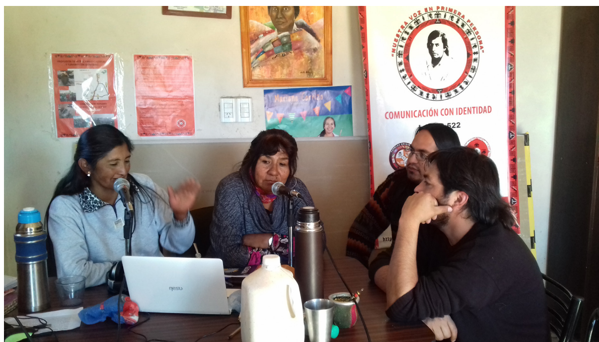
Figura 4. Diálogo con las conductoras del programa radial “El Toste”.

Durante la excavación, los integrantes más