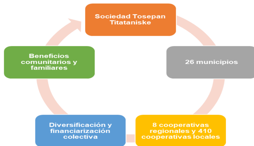
Imagen 3. Conformación de la Sociedad Tosepan Titataniske (STT).

De esta forma la STT ha impulsado la integración de 26 municipios organizados en ocho cooperativas regionales, 410 cooperativas locales dentro de la Sierra Norte de Puebla, las cuales agrupan 395 comunidades indígenas del lugar. Destaca el hecho de que no se trata de un grupo que se limita a las actividades agrícolas, también se compone de artesanos y otros oficios tradicionales, así como de madres de familia, sumando en la actualidad a poco más de 34 mil familias afiliadas a esta agrupación (véase imagen 3).