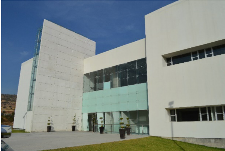
Figura 2. Primer edificio multiempresa del Guanajuato Tecno Parque.

Los principales servicio que ofrece son: