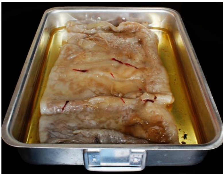
Fig. 3. Arte y ciencia en el laboratorio. Imagen de elaboración de Gabriela Punín, Laboratorio de la Universidad Técnica Particular de Loja, 2016.

Uno de los prejuicios que ha mantenido distanciados a la ciencia y el arte es la idea de que la primera es un proceder sujeto a métodos, mientras que el segundo es un quehacer libre que no admite condicionamientos metodológicos. Si en el campo de la ciencia no hay métodos, si en materia de métodos “todo vale”, el proceder del científico es un proceder libre, semejante al del artista. Paralelamente, si el arte es una forma de conocimiento, no es de extrañar que actualmente los artistas y los teóricos del arte estén ocupados en establecer el significado y el sentido de la investigación artística. Feyerabend, considerado el epistemólogo más definidamente posmoderno , propone repensar la ciencia y verla como arte . Esto debe ser entendido únicamente en el sentido de ver en la ciencia una situación análoga a la del arte.