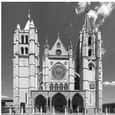
Catedral de León.

Mis plácemes también al Cabildo leonés al que me honro en pertenecer como Canónigo honorario por que al lado del templo ha sabido conservar y ordenar uno de los archivos más importantes de España dando así ejemplo digno de ser imitado.