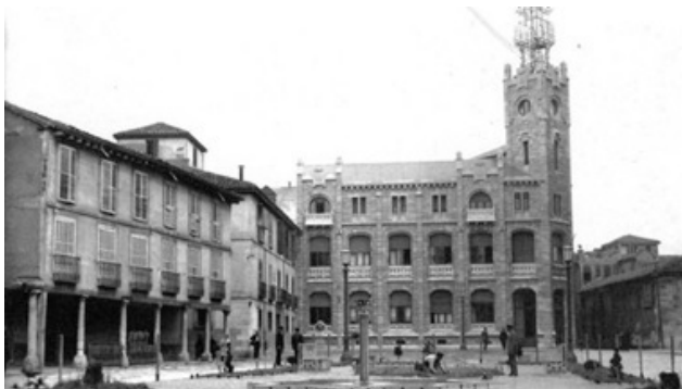
Antiguas casas frente a la Catedral.