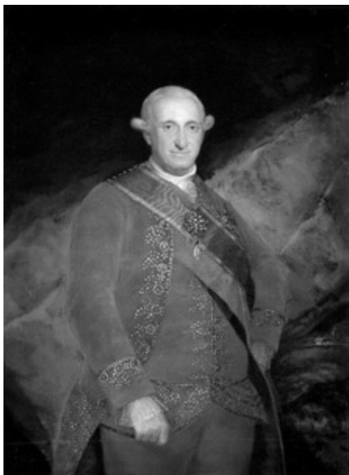
Carlos IV pintado por Goya.

Real Orden de 18 enero 1909: el presidente del Congreso Histórico Internacional de la Guerra de la Independencia, celebrado en Zaragoza, solicita, según lo acordado en el Congreso por el ministro de Gracia y Justicia, que se ruegue a los Cabildos que tengan los archivos abiertos al público por lo menos tres horas diarias y permitan hacer fotografías o copias de documentos, y, por supuesto, favorecer la publicación de índices o inventarios. Por ello espera que el Cabildo se sirva a realizar dichas aspiraciones (Madrid, 9 febrero 1909).