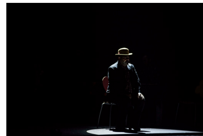
Canales

La Bienal 2020 ha incluido en su programación a grandes baluartes de la danza actual como el Ballet Flamenco de Andalucía en un espectáculo que celebraba su 25º aniversario; Rocío Molina en su especial homenaje de la guitarra en dos espectáculos concentrados en la misma jornada; Fernando Romero y sus “Diálogos con el tiempo”; Farruquito con la obra “Desde mi ventana”, dirigida por Ángel Rojas; Antonio Canales celebrando su reencuentro con su ciudad natal con su gran hito “Torero” y su nuevo espectáculo “Sevilla a Compás”; Olga Pericet y su eterna investigación escénica en “Un Cuerpo Infinito”; Israel Galván junto a Le Cirque Romanès en “Gatomaquia”..., entre otros.