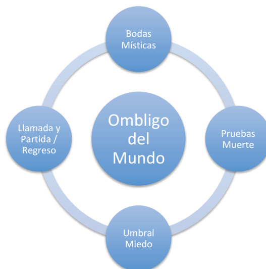
Viaje del Héroe según Campbell

Cuando finalmente sea redimido, regresará del Tártaro como inmortal, vencedor de la muerte, una vez admitido por los dioses del Olimpo.