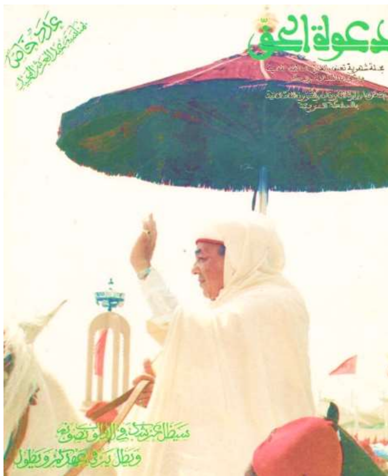
Imagen 5. Ḥasan II. Portada del número especial (1993) de Muḥammad VI (julio 2009).

ya se ha mencionado, inauguró la Mezquita Ḥasan II de Casablanca, que se ha convertido en el legado arquitectónico más emblemático de su reinado para la posteridad. La construcción de la mezquita no sólo le permitió imprimir su huella a nivel urbanístico, sino que también reforzó su condición de amīr al-mu'minīn y líder político del pueblo marroquí. Por lo tanto, se observa que aludir a la simbología encarnada en la bay'a y al papel del soberano como amīr al-mu'minīn en fecha claves es un recurso muy habitual a la par que natural, mantenido hasta nuestros días, en una dinastía que fundamenta su autoridad en el jerifismo.