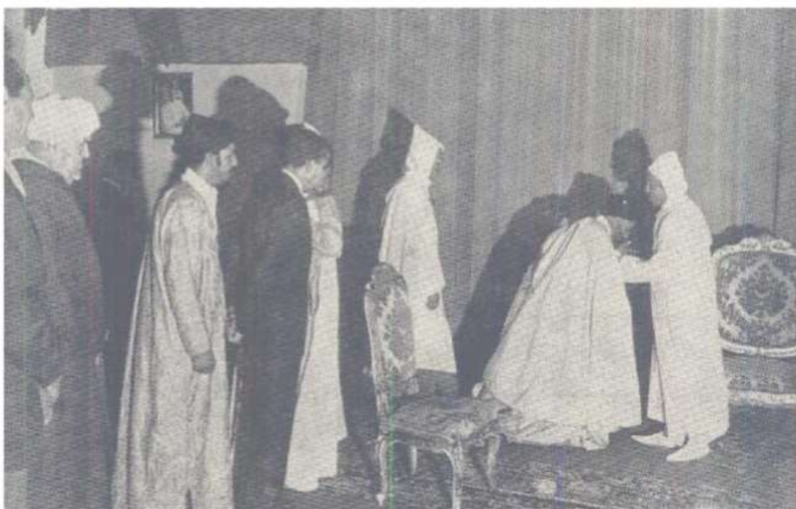
Imagen 3. Año 17 (1976), nº 4, 65.

Según Laroui (283-285), la costumbre del besamanos no es una práctica árabe ni islámica, pues se puede interpretar como una forma de širk –pecado que consiste en asociar a Dios otros entes–, pues en el Corán se hace referencia a la bay'a , pero no se especifica cómo se debe desarrollar. Parece, pues que se trata de una práctica persa, introducida durante el periodo abasí (Mez, 178-189) y justificado por la teología imāmī . En consecuencia, en la figura del califa se venera al imán y no al jefe político. Pero en el mundo sunní, esta explicación no es bien acogida, y se considera que esta costumbre se ha conservado por la remanencia semi-chií del jerifismo. Esta ideología semi-chií facilitó que el islam marroquí se convirtiese en morabítico, dando gran importancia al concepto de baraka y dejando, como consecuencia natural, la práctica del besamanos.