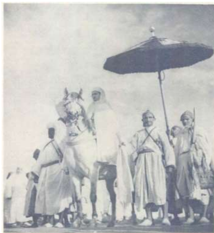
Imagen 2. Muḥammad V. Año 14 (1971) nº 3, 80 y Año 17 (1975) nº 6, 210.

específicas de Marruecos –y en el caso de la celebración del nacimiento del Profeta, considerada una innovación para muchos musulmanes–, que celebran la gloria y honor del Profeta y de sus descendientes.