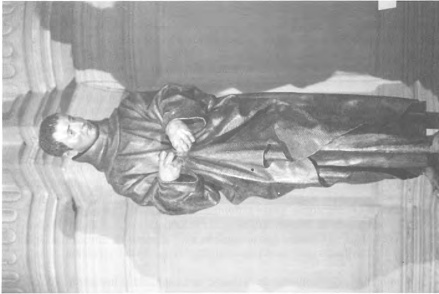
2. Alonso Cano y Pedro de Mena S. Diego de Alcalá. Museo de Bellas Artes de Granada.