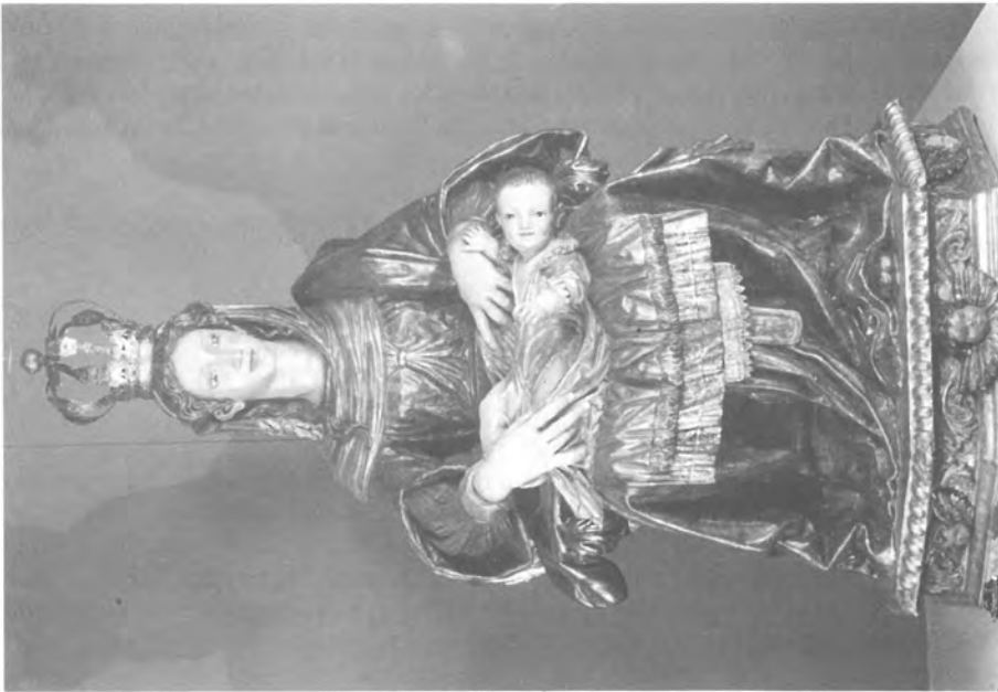
1. Alonso de Mena Virgen de Belén Iglesia de S. Cecilio.