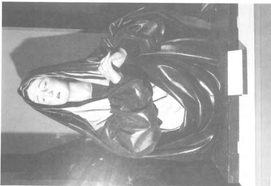
3. Pedro de Mena. Dolorosa. Catedral de Málaga.