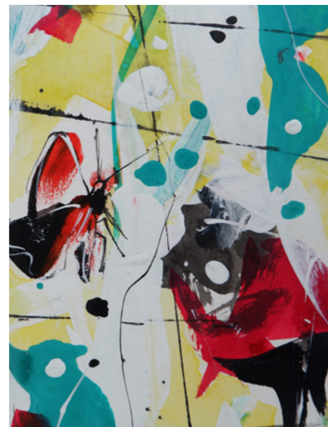
Mariposas/ JORGE RANDO

Se precisa una formación permanente y continua de los profesionales encargados de implementar la educación en los centros de enseñanza. Los propios expertos así lo confirman, aconsejando la formación en competencias, y no solo educativas, sino también en habilidades como flexibilidad o enfrentamiento positivo frente a las dificultades (Guichard, 2009). Hoy día podemos hablar no solo de formación en habilidades sociales (capacidad de empatía, por ejemplo), sino también en bienestar emocional (importancia de la salud mental de todos los agentes de la comunidad educativa), tal y como nos lo vaticina la psicología positiva (Seligman, 2011); incidiendo otros investigadores en la necesidad de que la persona (tanto orientador como orientado) sea formada en las