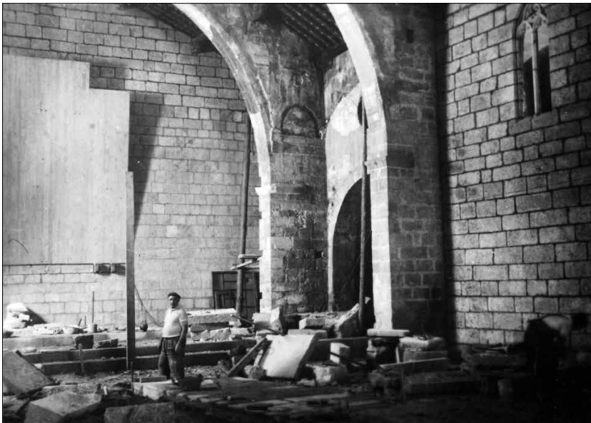
Fig. 2. Interior de l'església de Sant Miquel de Montblanc durant les tasques de restauració. c.1949, CAT-ACCB310-88-N-216,22.

D'aquest moment inicial de l'encàrrec, en conservem tres fotografies procedents del Fons Vicenç Baldrich dipositat a l'Arxiu Comarcal de la Conca de Barberà [Fig.2] [Fig.3] [Fig.4], que plasmen les obres de restauració de Sant Miquel i també la voluntat d'instal·lar-hi allí un retaule de grans dimensions. 39 Les imatges, datades entre 1947 i 1950 però que nosaltres considerem que caldria situar-les cap a 1949, ens mostren als operaris treballant a l'interior del temple i al fons