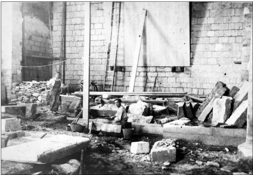
Fig. 4. Interior de l'església de Sant Miquel de Montblanc durant les tasques de restauració. c.1949, CAT-ACCB310-88-N-216,24.