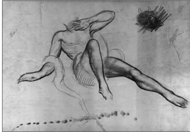
Fig.7. Esbós pel retaule de Sant Miquel (1949). Arxiu Comarcal de la Conca de Barberà, Ajuntament de Montblanc, CAT-ACCB- 310-51-T-86 full 3.

El segon preparatiu, realitzat amb carbonet, és un estudi exclusiu del cos de Sant Miquel on no hi apareix representat el seu rostre [Fig.8]. 49 El dibuix ens mostra una figura molt estilitzada de l'arcàngel, al qual li col·loca una creu a l'alçada del pit, mentre que amb la mà dreta aguanta una fina espasa amb què ataca al dimoni. Juntament amb aquests elements, podem veure que l'interès principal de Commeleran es concentra en estudiar la manera de plasmar la