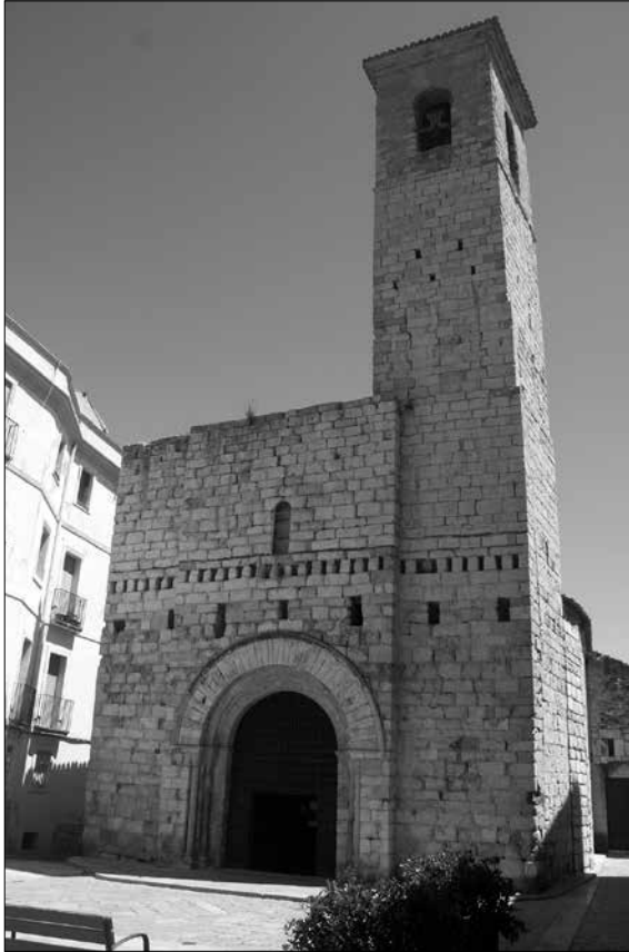
Fig. 1. Església de Sant Miquel de Montblanc (segle XIII).

històriques, entre els seus murs s'hi van celebrar les Corts catalano-aragoneses de 1307 i 1333, 30 amb el pas del temps es va alterar la seva fisonomia amagant el teginat sota unes voltes de guix i ja al segle XX va ser víctima de la fúria anticlerical que esclatà durant la Guerra Civil. 31