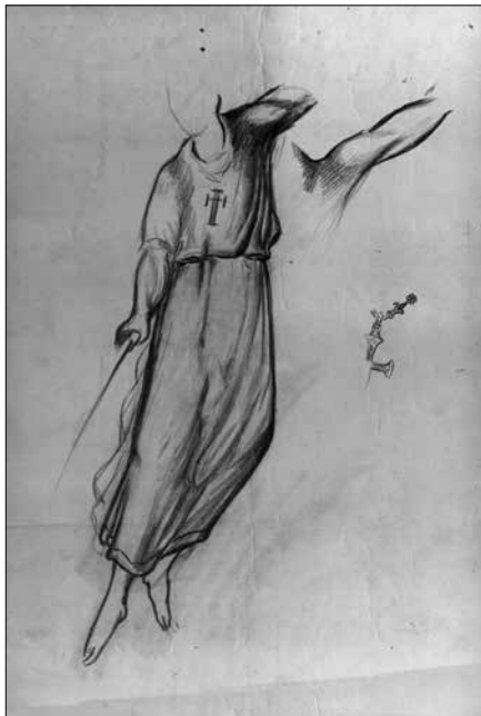
Fig.8. Esbós pel retaule de Sant Miquel (1949). Arxiu Comarcal de la Conca de Barberà, Ajuntament de Montblanc, CAT- ACCB-310-51-T-86 full 4.

musculatura i la posició del braç esquerre, aquell que en el retaule definitiu apareix estirat i assenyalant cap al cel. També presta molta atenció a una creu d'orfebreria, demostrant un alt nivell de detallisme en la seva representació, una individualització que possiblement responia a la possibilitat d'incorporar-la al pit de l'arcàngel en la versió final de l'obra.