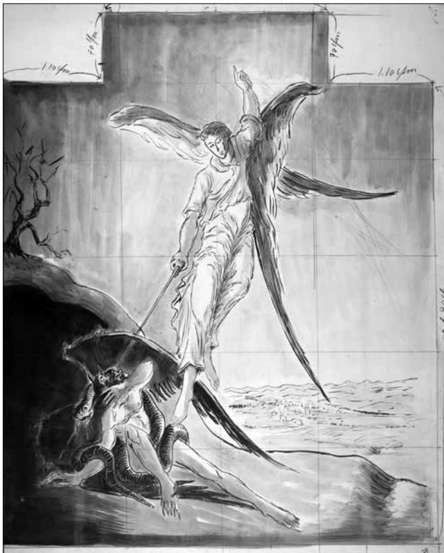
Fig.10. Esbós pel retaule de Sant Miquel (1949). Arxiu Comarcal de la Conca de Barberà, Ajuntament de Montblanc, CAT-ACCB-310-51-T-86 full 1.

Finalment, el quart i últim esbós, podem considerar-lo el darrer preparatiu abans de començar a pintar el retaule, ja que presenta una quadrícula que divideix tota l'escena per tal de convertir-lo en la pauta a seguir durant les jornades de treball [Fig.10]. 51 El dibuix, fet amb carbonet, llapis i tinta, confereix un gran protagonisme al paisatge