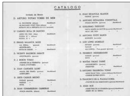
Fig.5. Portada del catàleg del Primer Saló de Septiembre (1949). Arxiu Comarcal de la Conca de Barberà, Antoni Rosselló i Sans, CAT-ACCB-310-29-T-809