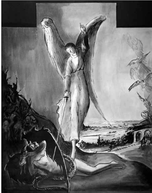
Fig.9. Esbós pel retaule de Sant Miquel (1949). Arxiu Comarcal de la Conca de Barberà, Ajuntament de Montblanc, CAT-ACCB-310-51-T-86 full 2.

El tercer esbós ja ens mostra una visió completa d'allò que l'artista creia que podria ser el retaule definitiu, tot i que si prestem atenció ens adonem que conté nombroses variacions respecte a l'obra final [Fig.9]. 50 Realitzat amb carbonet, llapis i clarió, el dimoni apareix amb les dues cames estirades, la serp enroscada al llarg de tot el seu cos, es cobreix el rostre amb el braç esquerra i les ales són completament