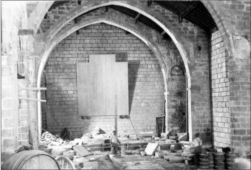
Fig. 3. Interior de l'església de Sant Miquel de Montblanc durant les tasques de restauració. Arxiu Comarcal de la Conca de Barberà, Vicenç Baldrich, c.1949, CAT-ACCB310-88-N-216,23.